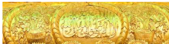
تصویر ۱۰: کتیبه محذب با نقوش برجسته، نوار چهارم ضریح

این کتیبه به صورت برجسته و همراه با تزئینات مشبک اسلیمی به وسیله نوارهای ضخیم هشتی از هم جدا شده‌است. بر روی این کتیبه نقشی از سبد درخت تاک که شاخه‌های آن سر به فلک کشیده و پر از خوشه‌های انگور، همراه با برگ‌های آن منقوش شده‌است. در پایین سبد، نقوشی از گل و برگ وجود دارد که می‌توان گفت برای پرکردن فضاهای خالی طراحی شده‌است. در هنر اسلامی وجود درخت، با ریشه‌های فرورفته در زمین و شاخه‌های بالا برده شده به سوی آسمان، سمبلی از پیوند زمین و آسمان است و با سه جهان پایینی (دوزخ)، میانی (زمین) و اعلی (بهشت) مرتبط است. به گفته دوبوکور (۱۳۷۳)