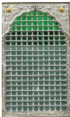
تصویر ۲۳: پنجره نقره‌ای ضریح

پیش از پنجره‌های نقره، از جنس فولاد برای ساختن شبکه‌های ضریح استفاده می‌شده‌است که به مرور زمان به سبب زیبایی و مقاومت به نقره تبدیل شده‌است (روحانی، ۱۳۸۸: ۶۳). بیشترین سطح ضرایح را پنجره‌های تشکیل شده از گوی و ماسوره فرا گرفته‌اند که افزون بر زیبایی و عبور روشنائی، زائران بتوانند از داخل پنجره‌ها، صندوق قبر امامان (علیه‌السلام) را ببینند. این گوی و ماسوره‌ها در نگاه اول نمادی از تسبیح و ذکر الهی را بازگو می‌کند. از این رو، در قسمت