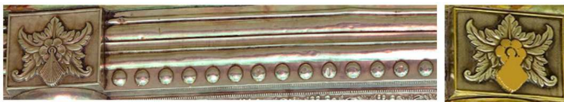
تصویر ۲۴: پایین نیم ستون‌های ضریح پیش و پس از بازسازی

این قسمت حمل‌کننده ضریح است که فشار و سنگینی وزن ضریح و زائرین را تاب می‌آورد و جنس آن از سنگ مرمر است. پاسنگ این ضریح از جنس نقره بوده که سرتاسر آن را پرچ‌های نقره‌ای برای اتصال ضریح به پایه اصلی تشکیل داده‌است. در پایین هر نیم‌ستون قابی با نقش گل شش پر وجود دارد که پس از بازسازی مزین به طلا شده که برگ‌های ختایی آن را احاطه کرده‌اند. تعداد این قاب‌ها ۲۲ عدد است که در قسمت شمال و جنوب ۶ عدد و در قسمت شرق و غرب ۵ عدد است. (تصویر ۲۴)