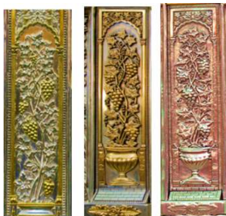
تصویر ۱۶: کتیبه ردیف چهارم، قصیده ابن ابی الحدید، نوار نهم، ضلع جنوبی

این کتیبه پایین‌ترین و آخرین نوار قرار گرفته بر روی ضریح است که جنس آن از نقره با ترکیبی از رنگ آبی و هنر میناکاری ۱۱ است. در تلفیق این کتیبه (تصویر ۱۶) از قاب‌هایی به شکل گل چهارپر