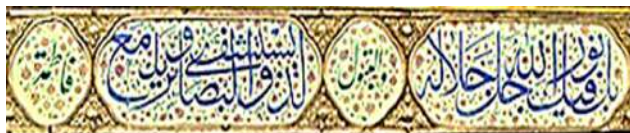
تصویر ۱۵: کتیبه ردیف سوم (سوره غاشیه)، نوار هشتم، ضلع جنوبی

تمام بندگان را خواهیم نوشت (طبرسی، ۱۳۸۴: ۳۷۸-۳۷۶). بر این اساس می‌توان گفت، افرادی که این سوره‌های قرآنی را برای ضریح مطهر امیرالمؤمنین