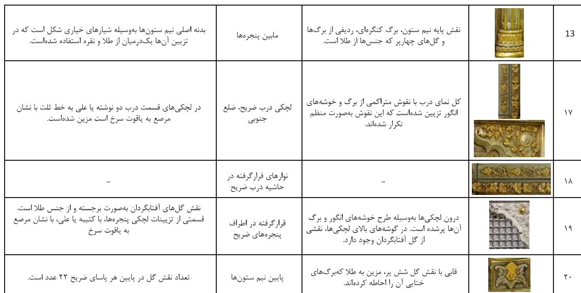
جدول ۲: کتیبه‌های ضریح امام علی علیه‌السلام