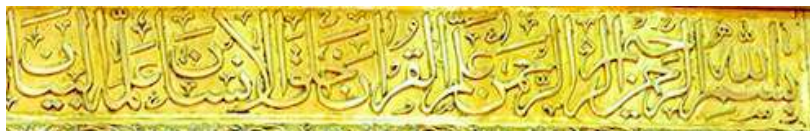
تصویر ۵: کتیبه ردیف اول (سوره الرحمن)، نوار دوم ضریح

دیدگاه حکما عدد کاملی است و در عرفان این عدد متعلق به حرف (واو) است که جزء حروف آسمانی قرار می‌گیرد (URL ۱ ). این عدد ۷ بار در قرآن آمده و در همه موارد با آفرینش آسمان‌ها و زمین مرتبط است؛ همچنین خانه کعبه شش وجه دارد که آفرینش تمام عالم از این نقطه بوده است (مکارم شیرازی، ۱۳۵۳، ج ۶: ۲۰۰).