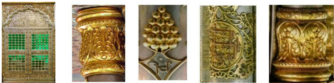
تصویر ۲۱: در ورودی ضریح، ضلع جنوبی

- کتیبه هو العلی العظیم با خط کوفی مزین به یاقوت سرخ - نقش انگور و کتیبه یا علی به خط ثلث و پایه ستون اصلی