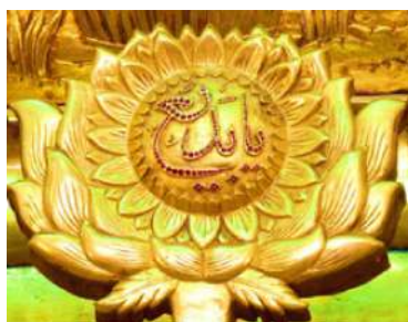
تصویر ۱۲: پرتاووسی، اسما احسنی (یا تواب) ضلع غربی، نوار پنجم ضریح