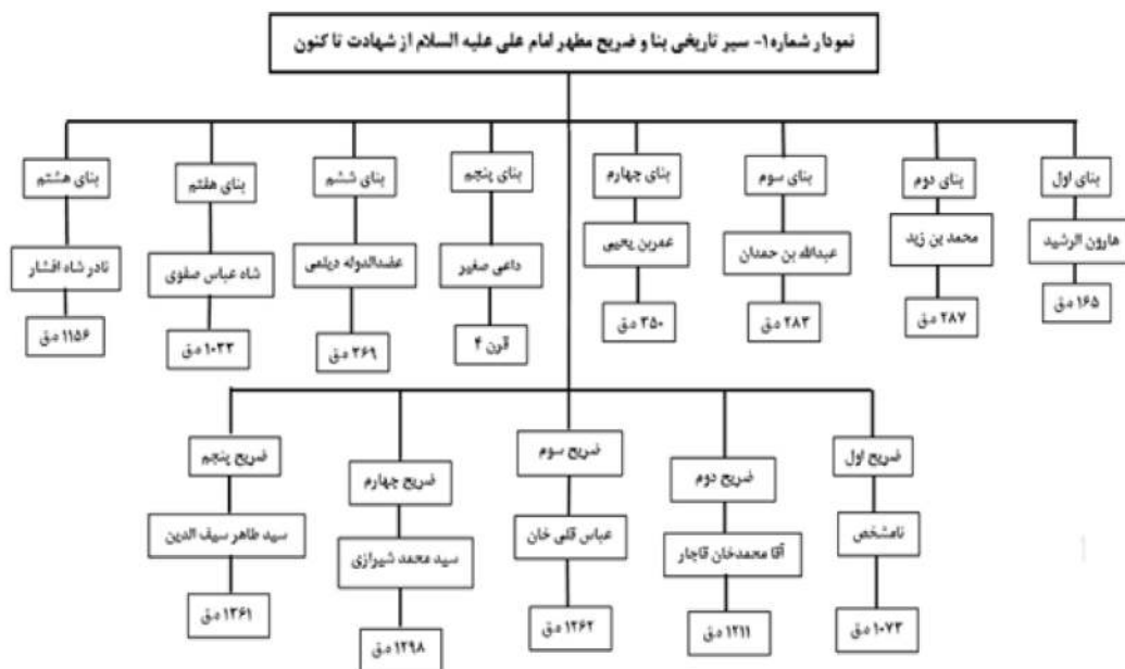
تصویر ۱: سیر تاریخی بنا و ضریح مطهر امام علی (علیه‌السلام) از شهادت تا کنون