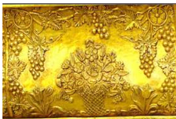
تصویر ۱۴: پیشانی ضریح، نوار هفتم ضریح