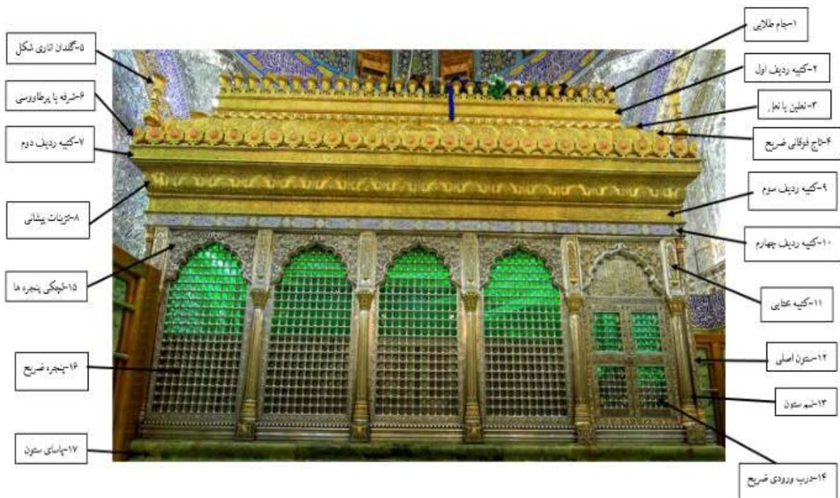
تصویر ۳: اجزای تشکیل دهنده ضریح

دارای سرپوش‌هایی هستند. تعداد کل این جام‌ها ۹۸ عدد است که در دو ضلع، غرب و شرق ۲۱ عدد و در قسمت شمال و جنوبی ضریح، تعداد این جام‌ها ۲۸ عدد است. در قسمت پایین این جام‌ها (تصویر ۴)