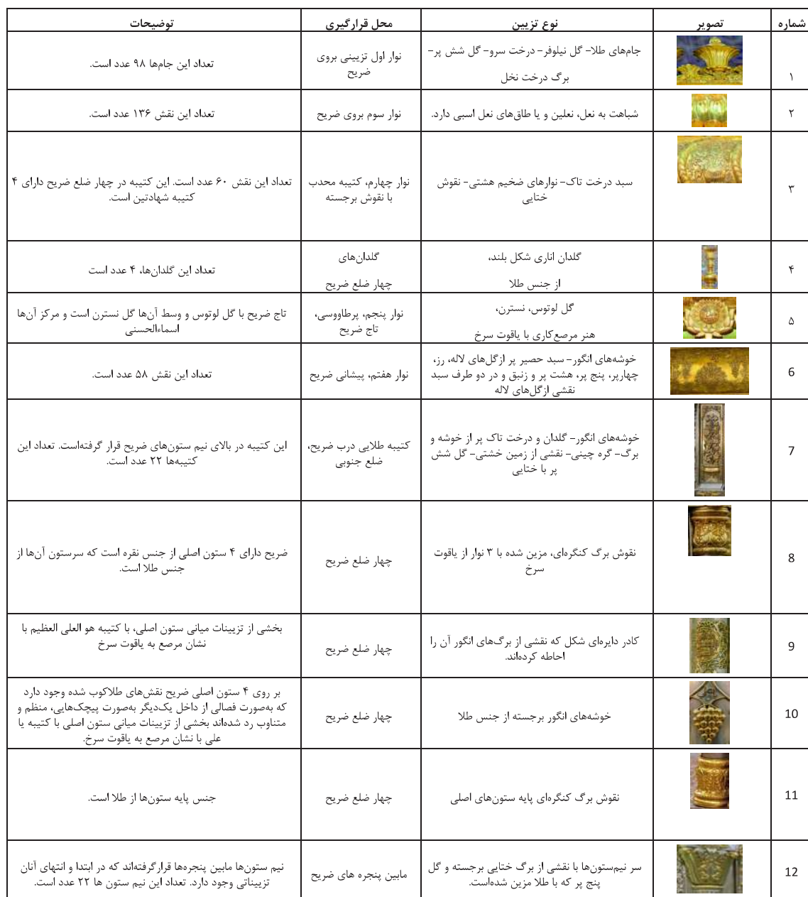
جدول ۱: تزئینات ضریح امام علی علیه‌السلام

تا دوره صفوی بر روی ضریح‌ها فقط یک کتیبه اول وجود داشته‌است. ولی برای نخستین بار در ضریح اهدایی داعی هند با کتیبه دومی که بر روی سینه کفتری قرار گرفته مواجه هستیم که کتیبه اول دارای قاب و کتیبه دوم فاقد قاب است. از این دوره به بعد، کتیبه دوم به جزیی از ضریح‌های مبدل می‌شود.