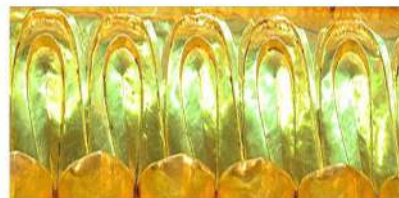
تصویر ۸: نعلین، نوار سوم بروی ضریح

این نقش بی‌شبهت به نعلین و نعل نیست. اگر واژه نعلین را از دید عرفا بنگریم، در می‌یابیم که بیشتر بازگوکننده این است که کفش، ابزاری است برای سفر و وسیله‌ای برای مسلک. برخی نیز گفته‌اند: «مراد از نعلین، دنیا و آخرت است. گویی که خداوند بنده خود را به استغراق در معرفه‌الله و مشاهده خود و وادی مقدس که همان مقام قدس جلال الله و عزت پاکش است، فرا می‌خواند؛ بنابراین، پس از وصول به مقصود، دیگر جایی برای توجه به مقدمه‌ها (نعلین) نمی‌ماند، چرا که قلب سالک دیگر مستغرق در نور قدس خداوند می‌شود. پس