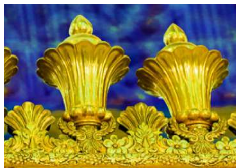
تصویر ۴: جام‌های طلائی، نوار اول تزئینی روی ضریح

در بالاترین قسمت ضریح، دورتادور سقف را جام‌هایی کوتاه شکل از جنس طلا فراگرفته که این جام‌ها