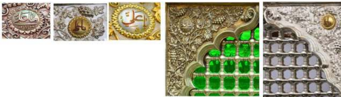
تصویر ۲۲: لچکی پنجره ضریح کنونی، پیش و پس از بازسازی از جنس نقره، ضلع غربی - کتیبه یا علی در داخل لچکی با یاقوت سرخ

لچکی‌ها تزییناتی هستند که اطراف پنجره‌های شامل گوی و ماسوره را در بر می‌گیرند. طرح نقوش موجود در لچکی‌های پنجره‌ها با هم یکسان است، (تصویر ۲۲) با این تفاوت که لچکی‌های قسمت در (ضلع جنوبی) از جنس طلا و دیگر لچکی‌ها ضریح از جنس نقره است. درون این فضا به وسیله طرح برگ و خوشه‌های انگور پر شده‌است. گوشه‌های بالای لچکی‌ها، نقشی از گل آفتابگردان وجود دارد که در وسط آن به خط ثلث واژه «یا علی» کتابت شده‌است. در ضریح بازسازی شده گل‌های آفتابگردان با طلا به صورت برجسته درآمده و واژه «یا علی» نوشته شده در وسط گل‌ها با نشان مرصع یاقوت سرخ تزیین شده‌اند.