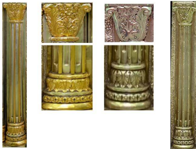
مجموعه تصویری ۱۹: نمای کامل ستون اصلی ضریح