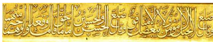
تصویر ۱۳: احادیث پیامبر صلی‌الله علیه واله وسلم، نوار ششم ضریح، کتیبه ردیف دوم، ضلع جنوبی

در طراحی پیشانی از نقش انگور بهره گرفته شده‌است، با این تفاوت که خوشه‌های انگور در اطراف این تزئینات قرار دارند. از بالا به پایین نقش هفت خوشه انگور و برگ مشاهده می‌شود که همه فضای حاشیه را در بر گرفته‌است. همچنین در دو گوشه قسمت بالا، دو گل شش پر که در دایره‌هایی محصور شده‌اند، خودنمایی می‌کند. در مرکز این کتیبه (تصویر ۱۴)، نقشی از سبد حصیری پر از گلی وجود دارد که آکنده از گل‌های لاله، رز، چهارپر، پنج پر، هشت پر و زنبق است. همچنین دو طرف این سبد نقشی از گل‌های لاله طراحی شده‌است. طرح‌های حاشیه‌ای این بخش از تزئینات