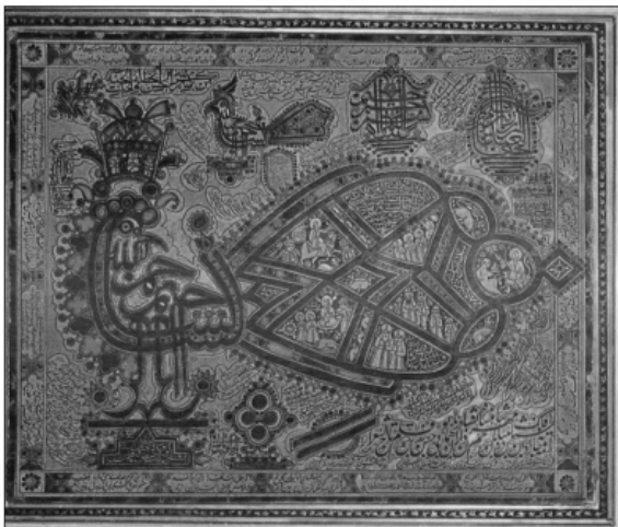
تصویر ۸. مرغ بسمله با نقش طاووس، منبع: سحاب، ۱۳۸۱: ۵۱