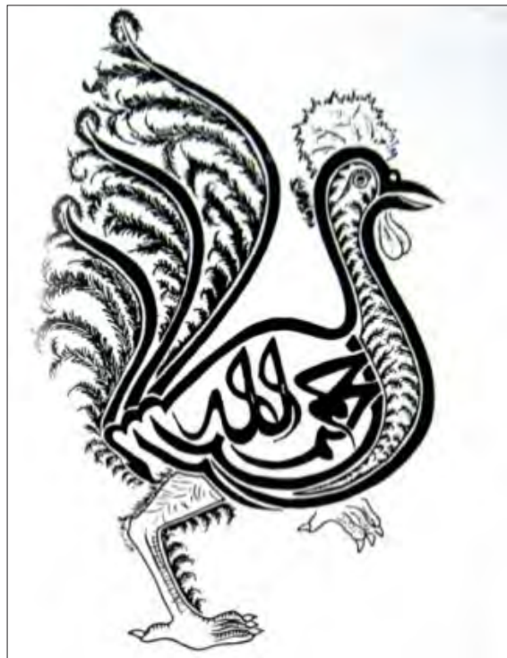
تصویر ۶. خروس، منبع: هراتی، ۱۳۶۷: ۲۱۶

طاووس: نقش طاووس همراه با خورشید یا درخت زندگی، در هنر و تمدن ایران باستان اغلب با مفاهیم مذهبی همراه بوده و از نمادهای دوره ساسانی محسوب می شده است که نمونه آن بر نقوش گچ بری تیسفون و پارچه های آن دوره دیده می شود. این پرنده در آیین زرتشت به عنوان مرغی مقدس مدنظر بود. طبری در مورد آتشکده ها و معابد زرتشتی که تا قرن سوم هجری باقی بود می گوید: در نزدیکی آتشکده بخارا محل خاصی برای نگهداری طاووس ها اختصاص داده شده بود و در آنجا طاووس به عنوان مرغی بهشتی مدنظر بود. وقتی حضرت آدم و حوا از بهشت رانده شدند، طاووس هم به دلیل اینکه رابط میان آن ها