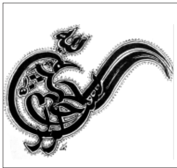
تصویر ۱۲.