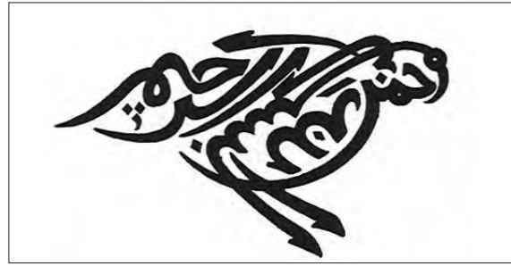
تصویر ۲. جوجه عقاب، منبع: زین‌الدین المصرف، ۱۳۹۱: ۲۲۶

همچنین پاسخ به ندای آسمانی، از مضامین اصلی در داستان‌ها و ادبیات فارسی و صور خیال مربوط به عقاب است. مولوی از میان پرندگان به باز یا شاهین بیشتر دقت داشته است و با توجه به آیه ۲۸ سوره فجر «ای نفس مطمئنه به‌سوی پروردگارت بازگرد»