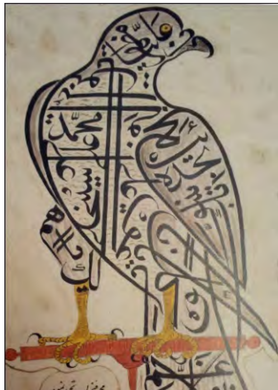
تصویر ۴. عقاب محمد فتح‌یاب، اوایل قرن نوزدهم، موزه طبیعی پاریس