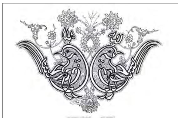
تصویر ۱۳. برگرفته از منبع: هراتی، ۱۳۶۷: ۳۶۰

ای هدهد صبا به سبامی فرستمت بنگر که از کجا به کجای فرستمت