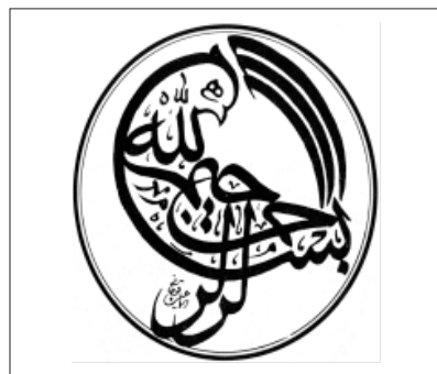
تصویر ۱۰.

خواهان اصل به وصل است. همان طور که تاج هدهد در طبیعت از مشخصات ظاهری اوست، در خوش نویسی مرغ بسمله نیز تاج او اغلب با «الله» نوشته می شود که مشخصه این پرنده است.