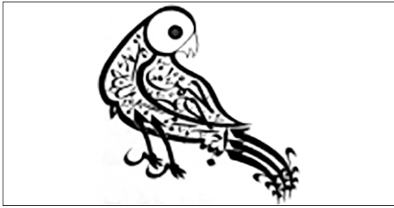
تصویر ۳. شاهین

که استادان، معلمان و دانش آموزان به شدت به آن توجه کرده‌اند. مسلمانان جهان اسلام در شرق، از دعای نادعلی در هیبت شاهین، به‌عنوان دعای محافظ استفاده می‌کردند. این گونه عبارات مقدس نه تنها در خانقاه‌های درویشان، بلکه در مساجد و خانه‌های مسلمانان هم وجود دارد و به‌عنوان دعای خیر و برکت و چشم‌زخم از در و دیوار این مکان‌ها آویزان می‌شده است (Frem-bgen the Aura of Alif, Munich, p. 81).