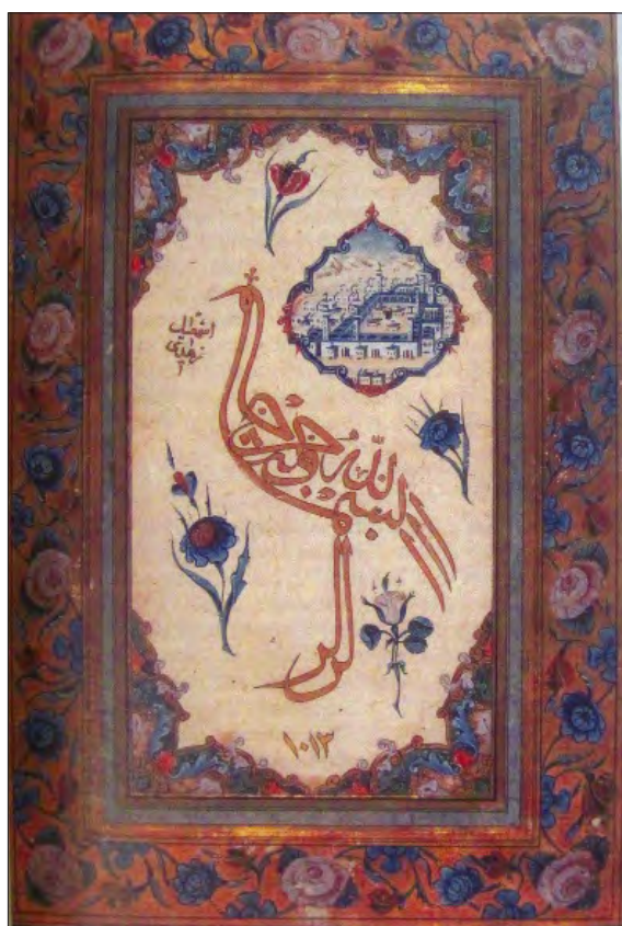
تصویر ۱. لک‌لک، اثر اسماعیل زاهدی، منبع: بلر، ۲۰۰۶: ۵۰۷

پارسا، نماد مناسبی برای خوش‌نویسی است (شیمل، ۱۳۸۲: ص ۱۵۲). همچنین در ترکیه، خوش‌نویسان - که معمولاً عضو سلسله مولویه بودند - دوست داشتند بسم‌الله را به صورت لک‌لک بنویسند؛ پرنده‌ای که در فولکلور فارسی، عربی و ترکی به دلیل تقوایش در سفر به مکه ستوده شده است (شیمل، ۱۳۸۴: ص ۶۵۶). این مورد به داستانی عامیانه اشاره دارد که در آن، لک‌لک‌ها هنگام مهاجرت، در زیارتگاه مخصوص صوفیان، برای ادای احترام به آن‌ها توقف کوتاهی می‌کنند.