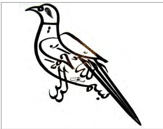
تصویر ۹.