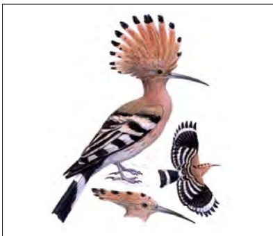
تصویر ۱۱. هدهد