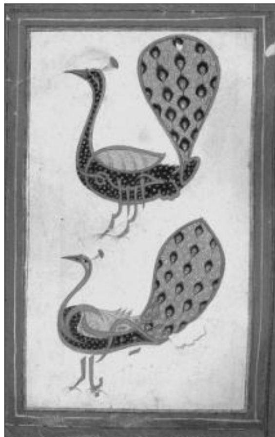
تصویر ۷. طاووس

و شیطان (در هیبت مار) بود، از بهشت رانده شد. همچنین جبرئیل را طاووس الملائکه خوانند (یا حقی، ۱۳۸۸: ص ۲۹۴).