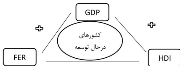
نمودار ۴. خلاصه روابط بلندمدت سه متغیر اصلی مدل در کشورهای در حال توسعه