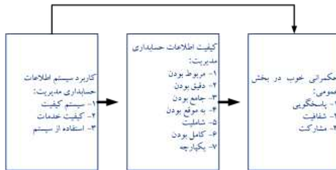
شکل ۲. نقش سیستم اطلاعات حسابداری مدیریت بر مسئولیت پاسخگویی، شفافیت و مشارکت

همانطور که شکل (۱) نشان می‌دهد، زیرساخت‌های حسابداری هرچقدر بهتر و قویتر باشند، تاثیر بیشتری بر فرهنگ پاسخگویی داشته و از طرفی با پیاده‌سازی سیستم‌های بودجه‌ریزی جامع‌تر و بهتر و همچنین، مدیریت عملکرد، مدیریت هزینه‌ها در بخش عمومی را نیز تحت‌تأثیر قرار می‌دهد. بر مبنای اظهارات مک‌لد (۲۰۰۷) کیفیت اطلاعات حسابداری مدیریت دارای ویژگی‌هایی مثل مربوط بودن، دقیق بودن و کامل بودن است. سیستم اطلاعات حسابداری مدیریت، یک سازوکار کنترلی و یک ابزار موثر برای ارائه اطلاعات سودمند برای پیش‌بینی پیامد فعالیت‌های انجام شده در سازمان می‌باشد (چنال و موریس، ۱۹۸۶، گامایونی، ۲۰۱۹: ۱۲۴۸). شکل (۲) تاثیر سیستم اطلاعات حسابداری مدیریت بر پاسخگویی، شفافیت و مشارکت را نشان داده است. ویژگی کیفی مربوط بودن، یعنی متناسب بودن اطلاعات ارائه شده با نیازهای شناسایی شده است. ویژگی کیفی دقیق بودن، یعنی اطلاعات ارائه‌شده، شرایط واقعی را نشان می‌دهد. جامع بودن اطلاعات، یعنی اینکه اطلاعات کامل به نظر می‌رسد. به موقع بودن، یعنی اینکه دسترسی به اطلاعات زمانی که مورد نیاز است، وجود دارد. شمولیت، یعنی اینکه با اطلاعات در دسترس بتوان رویدادهای آتی را پیش‌بینی کرد. کامل بودن، یعنی اینکه اطلاعات با وجود مختصر بودن هنوز کامل هستند. یکپارچگی، یعنی اطلاعات ارائه شده ارتباط بین واحدهای مختلف را منعکس می‌کند.