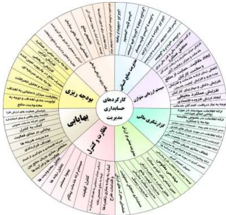
شکل ۲. کارکردهای حسابداری مدیریت در بخش عمومی (منبع: سلمان زاده و همکاران، ۱۴۰۰)