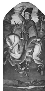
تصویر (۱۴): شاهزاده قاجار در گرفت و گیر با اژدها، اثر محمد صادق، سده سیزدهم ه.ق.