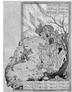
تصویر (۱): نبرد بهرام گور با اژدها، خمسه نظامی، اثر بهزاد، هرات، سده نهم ه. ق.