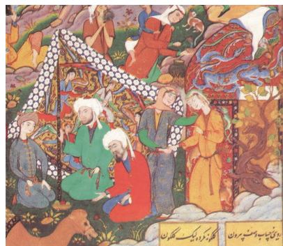
تصویر (۱۰): بخشی از نگاره قیس به خیمه گاه لیلی می رود، هفت اورنگ جامی، منسوب به مظفر علی، سده دهم ه.ق.