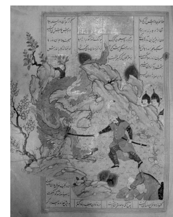
تصویر (۲): نبرد گشتاسب با اژدها، شاهنامه فردوسی، مکتب اصفهان، سده دهم ه. ق.

در نگاره‌ای از کمال‌الدین بهزاد مربوط به خمسه نظامی، بهرام گور در حال نبرد با اژدهاست. بهرام سوار بر اسب درحالی که کمان را کشیده است، به جانب اژدها پیش می‌تازد. اژدهای گول‌پیکر از روی تنه درخت به سمت بهرام می‌جهد (تصویر ۱). در نگاره‌ای متعلق به مکتب اصفهان نیز اژدها را در حال نبرد با قهرمان صحنه، گشتاسب، می‌بینیم. اژدها دارای طولی بلند، چهار بال شعله‌مانند، بدن پر از مو و پوست بدون فلس است. حرکت این اژدها سیال و همچون آبشاری از بالای کوه به سمت پایین در جریان است (تصویر ۲).