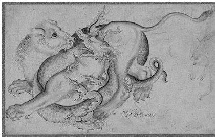
تصویر (۳): جدال اژدها و شیر، رقم محمدباقر، سده یازدهم ه. ق.