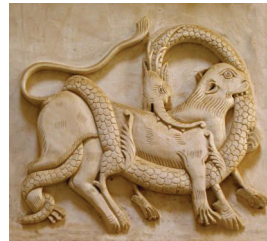
تصویر (۶): جدال اژدها و شیر، خانه بروجردی ها کاشان، دوره قاجار، سده سیزدهم ه.ق.