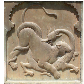
تصویر (۵): جدال اژدها و شیر، نقش برجسته، ایوان تخت مرمر کاخ گلستان، دوره قاجار، سده سیزدهم ه.ق.