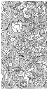
تصویر (۸): جدال اژدها و سیمرغ، پارچه ساتن، سده دهم ه.ق.

به ایوان تخت مرمر کاخ گلستان، نبرد اژدها با شیر نقش بسته است (تصویر ۵). در این نقش برجسته شیر و اژدها کاملاً در هم پیچیده اند و نمی توان نشان برتری را در هیچ کدام تمیز داد. همانند این نقش برجسته در خانه بروجردی ها در کاشان نیز دیده می شود (تصویر ۶). ترکیب بندی و جزئیات بدن دو حیوان به نقش برجسته کاخ گلستان شباهت نزدیکی دارد. در این نقش برجسته ها، هیچ حیوانی بر دیگری غلبه نمی کند و نشان برتری در هیچ یک مشاهده نمی شود؛ بنابراین همانند دو اصل یانگ و یین چین، دو جانور بر اساس نماد و نشانه های مشخص، مکمل یکدیگرند.