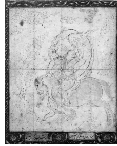
تصویر (۱۱): حمله اژدها به اسب سوار، طرح مرکبی، منسوب به سیاوش بیک، قزوین، سده دهم ه.ق.

نقش اژدها در هنر ایران برگرفته از اژدهای چین است. در هنر چینی، اژدها با توجه به نماد و مفهوم آن استفاده می‌شود. این نقش در آثار ایران گاهی فقط جنبه تزئینی داشته و گاهی با توجه به نماد و مفهوم آن به کار رفته است. از موضوعات مربوط به اژدها که سرشار از نماد و مفهوم است، می‌توان به نبرد و جدال این جانور با انسان و حیوانات دیگر اشاره کرد. جدال اژدها و قهرمان یکی از فراگیرترین نقش‌ها در هنر ایرانی است و حوزه وسیعی از ادبیات و هنر حماسی ایران را به خود اختصاص داده است. فردوسی از پای در آوردن اژدها را کرداری ویژه برای قهرمانان می‌داند. این