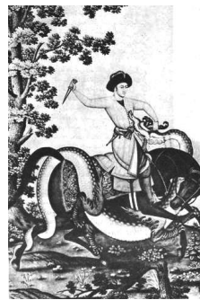
تصویر (۱۲): حمله اژدها به اسب سوار، رقم محمد زمان، مکتب اصفهان، سده یازدهم ه.ق.