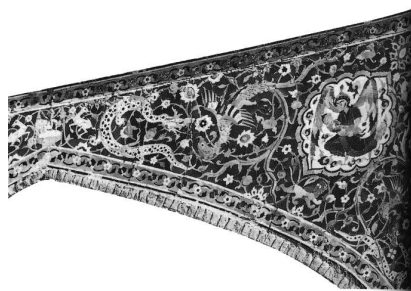
تصویر (۹): جدال اژدها و سیمرغ، کاشی معرق، کاروان سرای گنجعلی خان کرمان

بر پارچه ساتن مربوط به سده دهم هجری، اژدها و سیمرغ در میان نقوش اسلیمی و ختایی تصویر شده اند. در این پارچه، اژدهای قدرتمندی به همراه سیمرغی با پیچیدگی و چرخشی زیبا، طرح جالب و هیجان انگیزی ایجاد کرده است (تصویر ۸). این تصویر به نقش کاشی های کاروان سرای گنجعلی خان کرمان نیز شباهت دارد. طراحی فرم بدن و نقوش روی پوست اژدها بسیار به اژدهای پارچه ساتن شبیه است (تصویر ۹). نقش اژدها و سیمرغ در دوره تیموری و صفوی بسیار مورد توجه هنرمندان است. این نقش در بسیاری از آثار این دوره و حتی در جزئیات و نقش های موجود در نقاشی نیز فراوان استفاده شده است. بر پارچه خیمه گاه لیلی در نگاره ای منسوب به مظفر علی این نقش به خوبی مشاهده می شود (تصویر ۱۰).