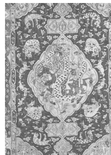
تصویر (۱۳): گلیم با ترنج و صحنه‌های اساطیری ایران، سده یازدهم ه.ق.