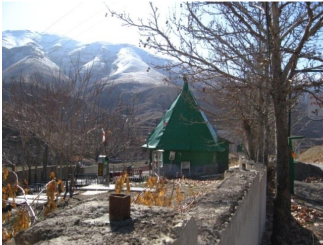
شکل ۱۱: امامزاده فضل و فاضل چهارباغ (نگارندگان)

فاضل بن عبدالله بن حضرت امام موسی کاظم، از بغداد روی به دارالمرز رستمدار نهادند و هنگامی که به موضع «زانوس» رسیدند، ایشان را در موضع «کندلوس» شهید کردند ([الف]: مقابل ۶۶). شهادت ایشان در موضع کندلوس، در نسخ دیگر نیز دیده می‌شود؛ بنابراین وجود مقبره‌ی آنها در چهارباغ لواسان شک برانگیز است. اینکه فضل و فاضل برادران طیب و طاهر در رستان هستند نیز درست نیست؛ زیرا مقبره‌ی واقع در رستان متعلق به یک نفر است و بر اساس همین بحرالانساب‌ها، امام کاظم فرزندی به اسم فضل و فاضل نداشته است که البته این مطلب نادرست است و ایشان فرزندی به اسم فضل داشته‌اند که مقبره‌ی وی در چهارباغ نیست. مرگ در اثر تشنگی یا ضربت فردی میر آب‌پیشه، چندان پذیرفتنی نیست و احتمالاً این روایت تحت تأثیر وقایع کربلا نقل شده است. از نمونه‌های مشابه در مناطق دیگر، بقعه‌ای با نام امامزاده آقا سید محمد، معروف به «فضل و فاضل» و از نوادگان امام کاظم (ع) است (حاج سیدجوادی، ۱۳۷۳: ۴۰۰).