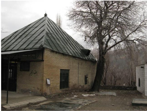
شکل ۵: امامزاده محمد و عبدالله بوجان (نگارندگان)

برخی منابع (بدون ذکر مرجع)، این امامزاده را از نوادگان امام کاظم (ع) می‌دانند (نجفی، ۱۳۹۰: ۱۷۹). در صورت مراجعه به بحرالانساب‌ها، احتمال تعلق این بقعه، به نوادگان امام زین‌العابدین بیشتر است؛ اما تعداد مهاجران از نوادگان امام کاظم بیشتر از امامان دیگر است.