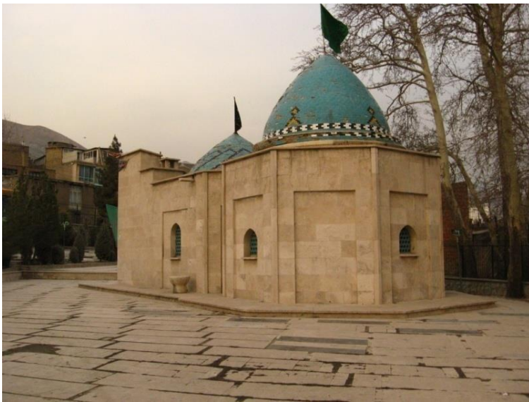
شکل ۳: امامزاده عبدالله جائیح

در تاریخ یعقوبی، ارشاد شیخ مفید، مناقب ابن شهر آشوب، الفخری فی انساب الطالبین زورقانی / زوارقانی، عمده الطالب ابن عنبه و ... نامی از عدنان / ادنان، فرزند امام کاظم (ع) دیده نمی‌شود. بیشتر اسامی منسوب به فرزندان ائمه، به‌ویژه امام کاظم (ع)، در نسخ خطی بحر الانساب، بهره‌نصاب یا کنز الانساب دیده می‌شود.