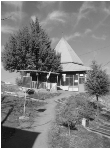
شکل ۷: امامزاده طیب رسان (نگارندگان)

سنگ قبر جدید و مرمرین بنا، دارای خطوط ثلث و نستعلیق و شامل سلام بر خداوند، پیامبر و نام امامزاده «امامزاده طیب و طاهر فرزند موسی بن جعفر امام هفتم» است. در زیارتنامه آمده است: «السلام علیک ایهاالشخص الشریف السیدالشهید الطیب الطاهر الکریم». احتمالاً دلیل آمدن نام «طیب و طاهر» بر سنگ قبر همین است و طبق متن زیارتنامه، بقعه به دو نفر تعلق ندارد. برخی منابع، نام امامزاده را یونس، لقبش را طیب و او را از نوادگان امام موسی کاظم دانسته‌اند (نجفی، ۱۳۹۰: ۱۷۸؛ سروقدی، ۱۳۸۶: ۱۶۴)؛ اما طبق زیارتنامه، امامزاده طیب فرزند امام کاظم است.