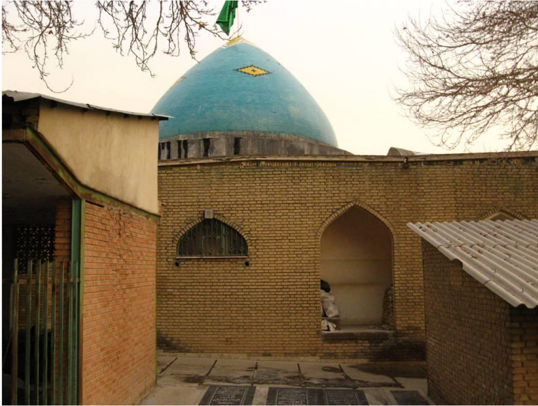
شکل ۴: امامزاده فضلعلی ناران