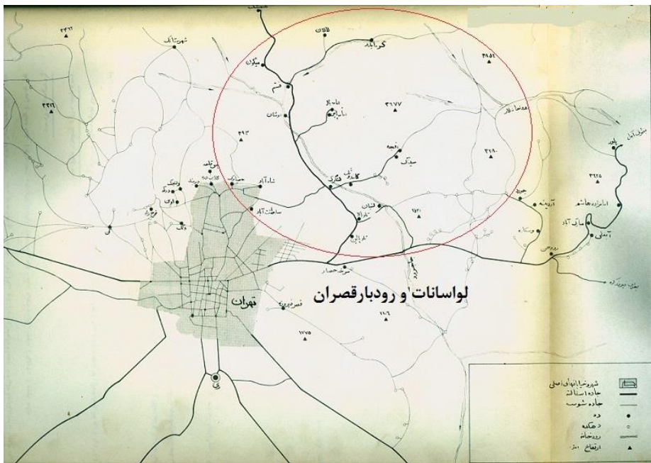
شکل ۲: موقعیت لوسانات (گروه علوم اجتماعی دانشگاه تهران، ۱۳۴۷-۴۸)