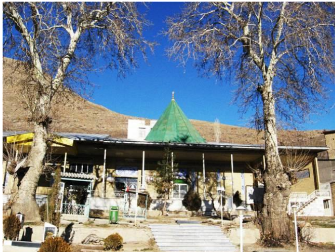
شکل ۹: امامزاده خواجه سلطان احمد در لواسان بزرگ (نگارندگان)

در منابع مختلف، احمد بن موسی (شاهچراغ) تنها احمد منتسب به فرزندان امام کاظم (ع) است (مجلسی، ۱۳۵۵: ۲۵۷؛ طبرسی، ۱۳۹۰: ۴۲۲). نام «خواجه احمد» تنها در بحرالانساب‌ها دیده می‌شود. در بحرالانساب‌ها، خواجه سلطان احمد به همراه طیب و موسی نام برده شده است. در این نسخ آمده است بعد از رسیدن این بزرگان به منطقه، «دو تن [سلطان احمد و موسی] را در موضع لواسان شهید کردند» (الف: مقابل ۶۱؛ ج: ۷۱). در نسخه‌ی خطی قرن ۱۲ آمده است: «احمد و موسی بن کاظم (ع) در لواسان شهید شدند» (اسکن ۲۷).