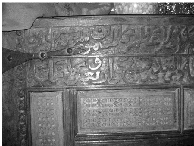
شکل ۸: نام حضرت مهدی (ع) و تاریخ ساخت صندوق بر بدنه‌ی صندوق امامزاده طیب رستان (نگارندگان)