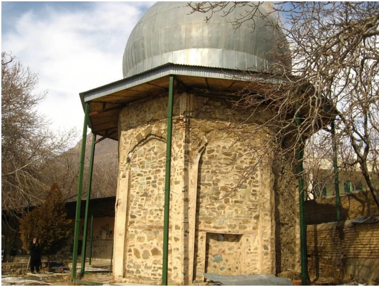
شکل ۱۰: امامزاده یونس در لواسان بزرگ (نگارندگان)

با وجود زرتشتی‌نشین بودن این ناحیه در قبل از اسلام، مدرکی دال بر آتشکده بودن این بقعه در دست نیست. در زمان مادها، مغان با مرکزیت ری، طایفه‌ی مهمی محسوب می‌شدند. در آنجا کاهن بزرگ (رئیس قبیله‌ی مغان) حاکم روحانی و دنیوی بود. احتمالاً این فرد «رئیس مغان» یا «مس مغان» (عربی مسمغان، کبیرالمجوس) نامیده می‌شد. در زمان ساسانیان و حتی اعراب، مالکان فتودال ناحیه‌ی دماوند (در شمال ری) دارای این لقب بوده‌اند (دیاکونوف، ۱۳۵۷: ۳۴۷).