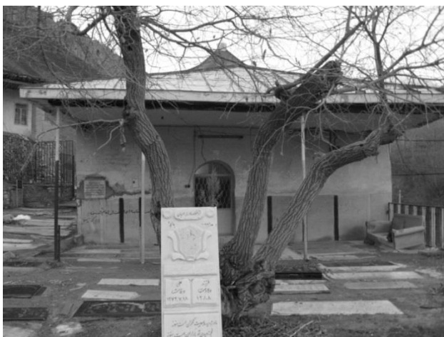
شکل ۶: امامزاده محمد شعیب کند سفلی (نگارندگان)

ساروقمش، گروهی از امامزادگان مانند محمد و ... شعیب، عبدالله و... به کند رسیدند و در قلعه‌ی درک / دزک گروهی از امامزادگان را شهید کردند؛ از جمله امامزاده شعیب ([الف]: مقابل ۷۱ و ۷۱). در ادامه آمده است: «امامزاده شعیب را تربتش ظاهر است و مردم آن ده را فیروز می خوانند» (همان؛ [ج]: ۸۳ و ۸۴). در نسخه‌ی ج، تعداد امامزادگان مدفون در آنجا هجده تن ذکر شده است (همان). در بدایع الانساب آمده است: «شعیب بن امام موسی (ع)» در خارج سبزوار بقعه دارد (بدایع نگار لاهوتی، ۱۳۱۹: ۳۳). با احتساب امامزاده شعیب بن موسی بن جعفر (ع) سبزوار (ملازاده و محمدی، ۱۳۷۸)، اکنون دو امامزاده به اسم شعیب بن موسی در لواسانات و سبزوار وجود دارد. احتمال مدفون بودن دو تن به نام‌های محمد و شعیب در بقعه‌ی روستای کُند سفلی نیز وجود دارد.