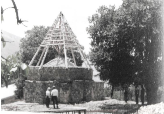
شکل ۱۳: امامزاده اسماعیل برگ جهان، قبل از خرابی بقعه (پازوکی، ۱۳۸۲)

عبیدالله به گریوه مایین مدفونند» (مستوفی، ۱۳۶۴: ۲۰۴). مائین در استان فارس قرار دارد. در این منابع مکان‌های مختلفی به عنوان مرقد اسماعیل بن موسی‌الکاظم ذکر شده است که مصر درست‌تر به نظر می‌رسد.