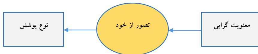
شکل ۱. الگوی مفهومی تحقیق

ب) به نظر می‌رسد معنویت‌گرایی از طریق تصور از خود بر نوع پوشش دانشجویان دختر دانشگاه شیراز تأثیرگذار است.