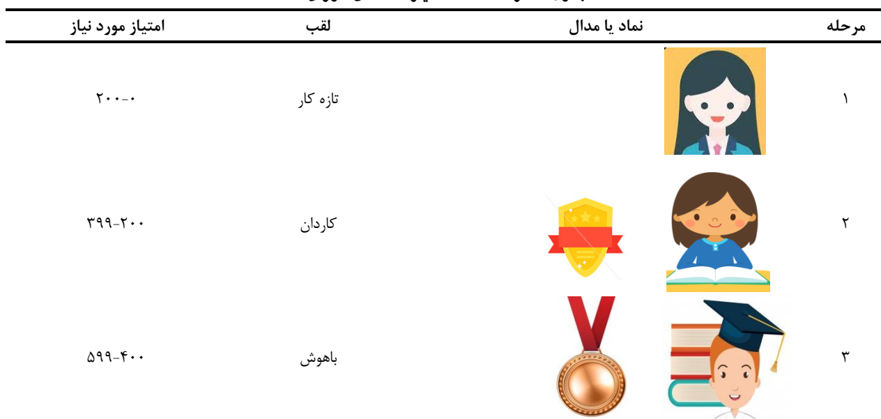
جدول شماره ۱. تخته امتیازات دانش‌آموزان