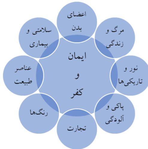
۱. حوزه‌های مبدأ ایمان و کفر در قرآن کریم