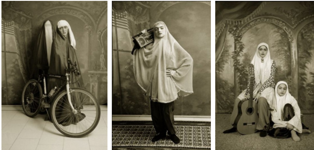
تصاویر ۱، ۲ و ۳، شادی قدیریان، قاجار، ۱۳۷۸ (آرشیو شخصی نگارنده).

پیچیده تر شده اند. با متنوع تر شدن اشیا، فیگورهای ماکم و کم تر می شوند. امروزه هدف اشیا آن ها را به بازیگران یک فرایند جهانی تبدیل ساخته است که انسان فقط در آن نقش بازی می کند یا تماشاگر است (بودریار، ۱۳۹۵: ۲۳).