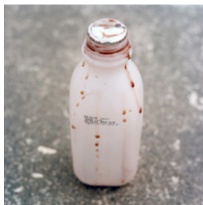
تصاویر ۶ و ۷- مهران مهاجر (۱۳۸۵)، توپ و تاریخ گذشته (آرشیو شخصی نگارنده).