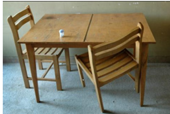
تصاویر ۱۱ و ۱۲- بهنام صدیقی، ۱۳۸۴، حال همه ما خوب است (URL1).

جدول ۱. بررسی نمونه‌های انتخابی در پژوهش به روش تحلیل متن پل جی: فعالیت‌های متن (Gee, 2011:715).