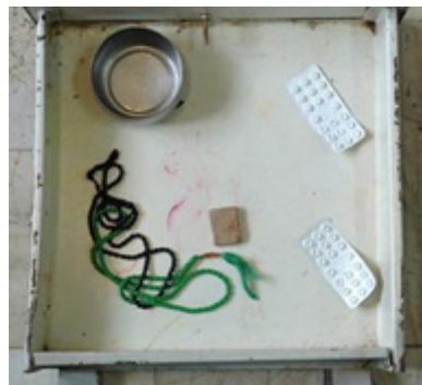
تصاویر ۹ و ۱۰- میثم محفوظ، کشو، ۱۳۸۸.