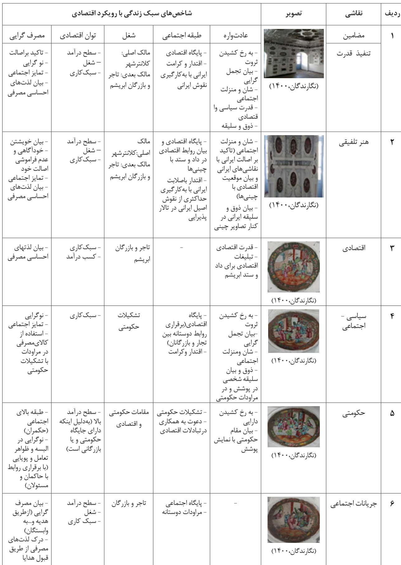
جدول ۲- شاخص‌های حاصل و متاثر از سبک زندگی در نمونه موردی (نگارندگان، ۱۴۰۰).