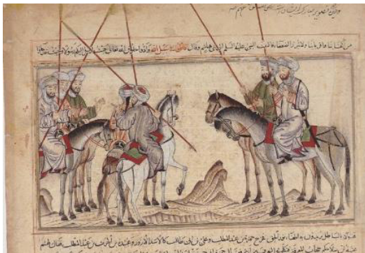
تصویر ۴. نگاره اعزام حضرت علی (ع) و حضرت حمزه به مأموریت جنگ بدر از سوی پیامبر (ص)، جامع التواریخ رشیدی، ۷۱۴ق، انجمن سلطنتی آسیایی در لندن (مجموعه ناصر خلیلی) (URL2)

حاضر در نگاره، نیزه در دست دارد و بر طبق روایت کتاب، برای جنگ، داوطلب شده است. در این نگاره، پیکره اشخاص و اسب‌های دو نفر سمت راست، از بقیه بزرگ‌تر است و بدین وسیله از مابقی سپاهیان پیامبر (ص) متمایز شده‌اند، اما نگارگر، تأکیدی بر برجسته‌کردن حضرت علی (ع) در این نگاره نداشته و حتی ایشان را بعد از حمزه قرار داده است و شخصیت هر دو را به عنوان سربازانی شجاع که برای جنگ داوطلب شده‌اند، در نظر گرفته است. هاله‌ای دور سر هیچ‌کدام از اشخاص دیده نمی‌شود و در چهره پردازی‌های سپاهیان نیز حالت برجسته‌ای دیده نمی‌شود. تمایزات چهره در این نگاره را در ریش قرمز حمزه و ریش سفید عبیده می‌توان مشاهده کرد. در اینجا حضرت علی (ع)، به عنوان شخصیتی از سپاه اسلام، پیش‌گام در جنگ و مطیع امر پیامبر (ص) تصویر شده است. نگارگر در این نگاره، شخصیت حضرت علی (ع) را به عنوان یکی از یاران برجسته پیامبر (ص) و جنگجویی از سپاهیان اسلام نشان داده است.