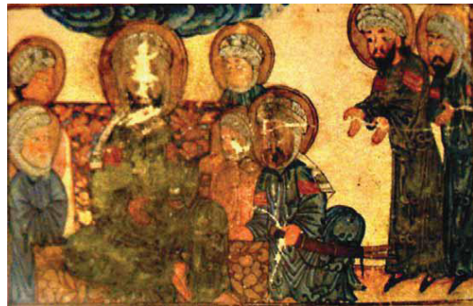
تصویر ۳. روزه روشن فرستادگان پیامبر دروغین با حضرت محمد (ص)، آثار الباقیه بیرونی، ۷۰۷ ق، کتابخانه دانشگاه ادینبورگ (افشاری، ۱۳۸۷: ۵۹)