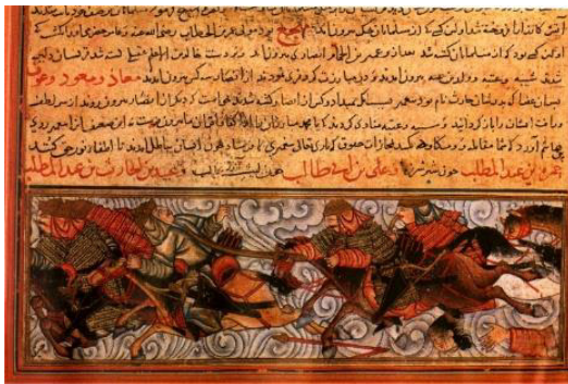
تصویر ۵. نگاره جنگ بدر، جامع التواریخ رشیدی، ۷۰۷ق، کتابخانه موزه توفقایی سرای استانبول (رهنورد، ۱۳۹۳: ۲۰۲)