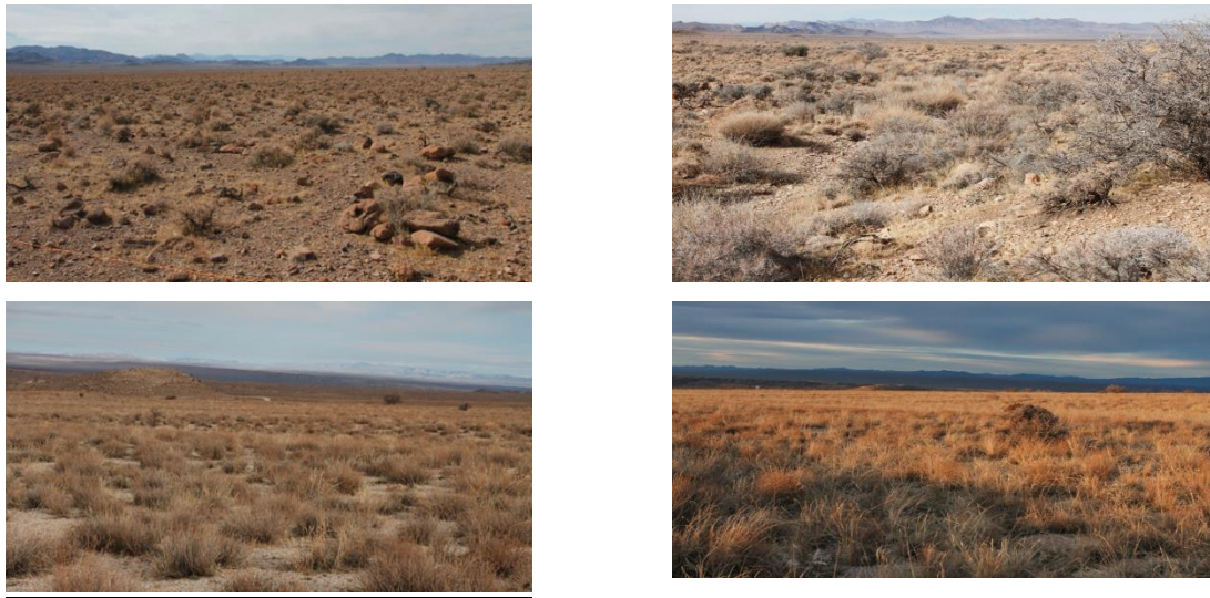
شکل ۱- نمایی از مناطق نمونه برداری شده، بالا: راست، گرم دست نخورده و چپ گرم دست خورده. پایین: راست، سرد دست نخورده و چپ سرد دست خورده.