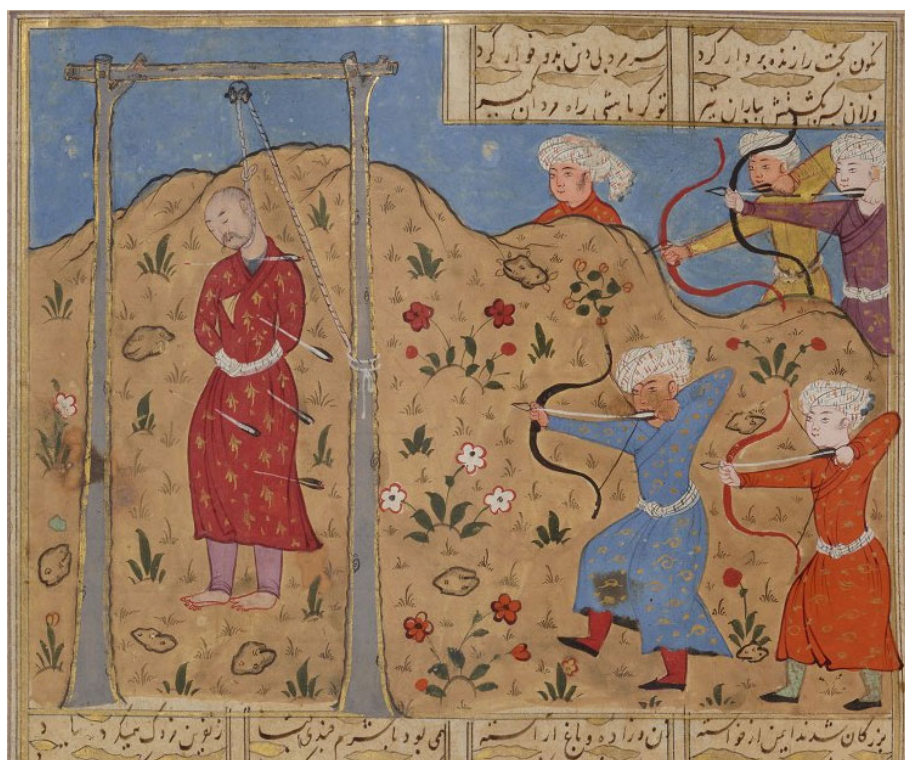
تصویر دوم: اعدام مزدک بر چوبه دار، در یکی از نسخ خطی شاهنامه