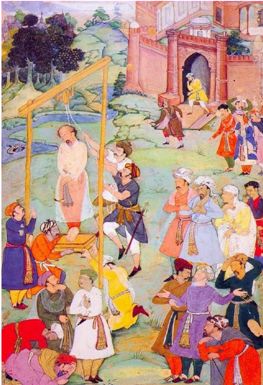
تصویر سوم: مینیاتور هندی بر دار کشیدن منصور حلاج