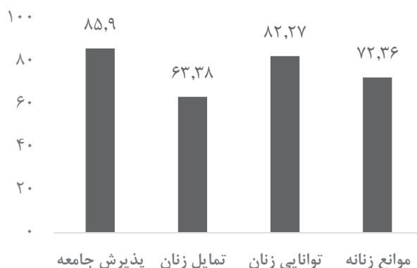
شکل ۳. امتیازات ابعاد موثر بر نگرش نسبت به تصدی پست‌های مدیریتی توسط زنان

همان‌گونه که مشاهده می‌شود عامل پذیرش عمومی جامعه نسبت به زنان بالاترین امتیاز (امتیاز ۸۵/۹۰) را کسب کرده است. پس از آن عوامل توانایی زنان (امتیاز ۸۲/۲۷)، موانع زنانه (امتیاز ۷۲/۳۶) و تمایل زنان (امتیاز ۶۳/۳۸) قرار دارند. با توجه به امتیازات کسب شده می‌توان گفت که بر اساس نگرش دانشجویان بزرگ‌ترین مسئله فراروی زنان جهت تصدی مناصب مدیریتی ابتدا پایین بودن تمایل زنان به مدیریت و سپس موانع زنانه است. به عبارتی دانشجویان نسبت به وجود تمایل در زنان و وجود یک سری موانع زنانه نگرش کلیشه‌ای تری دارند. به منظور بررسی آماری وجود تفاوت معنادار بین موانع فوق از آزمون تحلیل واریانس به شرح جدول شماره ۶ استفاده شده است.