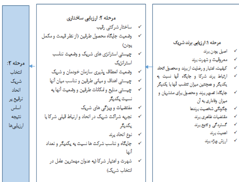
شکل ۲. چارچوب ارزیابی شرکای بالقوه جهت ورود به اتحاد ترفیع با آنها

در نتیجه بر اساس مرور نظام‌مند انجام پذیرفته مجموعاً ۲۲ عامل بر اساس توالی که در شکل ۲ نشان داده شده است، به‌عنوان عواملی که بر در انتخاب شریک در یک اتحاد ترفیعی در حالت کلی مؤثر هستند، شناسایی شدند و این موضوع حاکی از آن است که انتخاب شریک اتحاد ترفیع امری آسان نبوده و طرفین (مخصوصاً برند کانونی) باید در انتخاب شریک نگاهی دقیق و چندبعدی داشته و عوامل مختلفی را مدنظر قرار دهد.