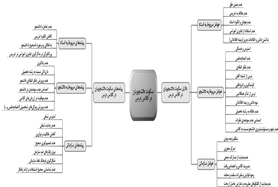
شکل ۲: نقشه مفهومی مستخرج از دلایل و پیامدهای سکوت دانشجویان در کلاس درس