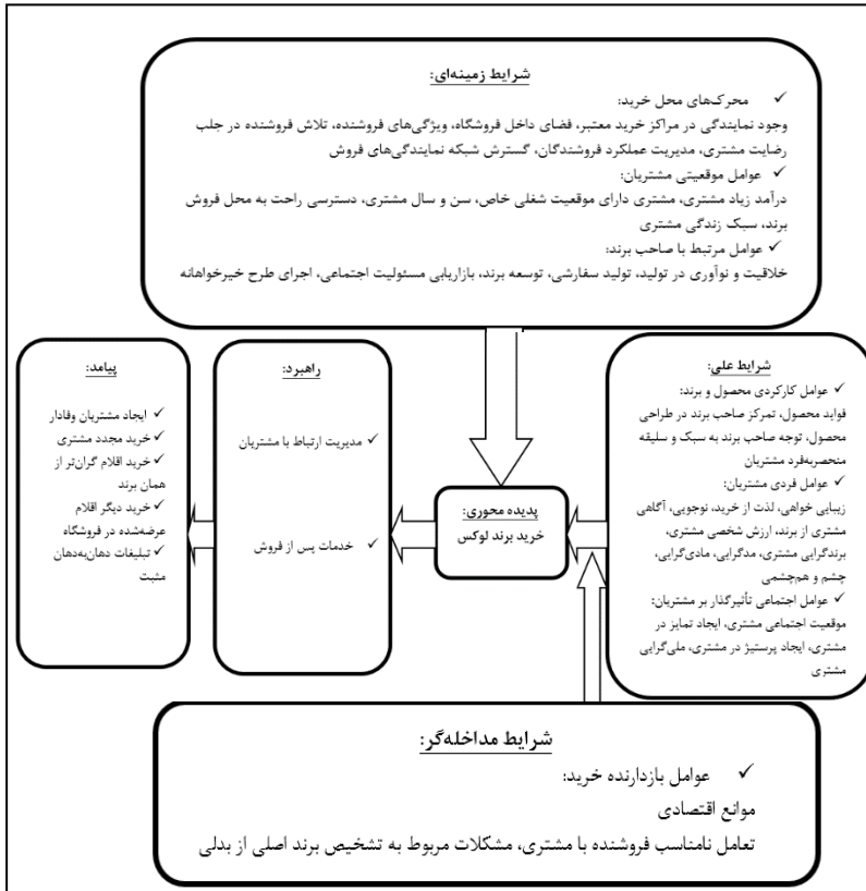
شکل ۲. الگوی پارادایمی خرید برند لوکس در صنعت پوشاک ایران

این فراین د در نظریه داده بنیاد به عنوان الگوی پارادایمی شناخته می‌شود. این الگو در شکل شماره دو، نشان داده شده است.