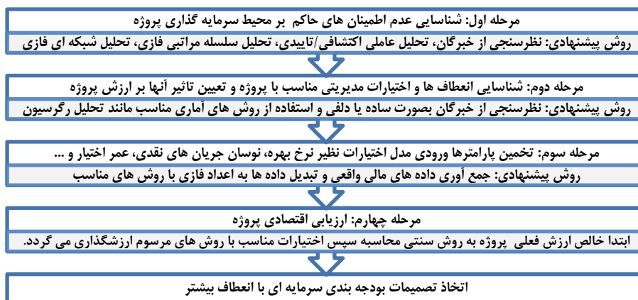
نمودار ۲. الگوی پیشنهادی پژوهش

در نهایت با توجه به یافته های پژوهش، الگوی پیشنهادی زیر جهت انعطاف پذیری بیشتر تصمیمات بودجه بندی سرمایه ای در ارزیابی اقتصادی پروژه های سرمایه گذاری در شرایط عدم اطمینان، با استفاده از رویکرد اختیار سرمایه گذاری به شرح نمودار (۲) ارائه می گردد.