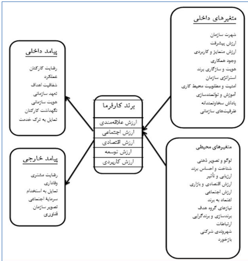
شکل ۱. مدل پژوهش

می‌کند در راستای نیل به اهداف سازمانی، تعامل سازنده‌ای در سطوح مختلف با همدیگر داشته باشند و توصیه می‌شود که مدیران و سازمان‌ها از مجراهای ارتباطی ساده، متعدد و بروز استفاده کنند که بتوانند اثربخشی لازم را به وجود بیاورند. همچنین ضروری است که نیازها و خواسته‌های کارکنان به‌عنوان مشتریان داخلی سازمان مورد توجه قرار گیرد که منجر به بهبود خدمات درونی در جهت کسب رضایتمندی هرچه بیشتر کارکنان شده و به دنبال آن رضایت و وفاداری مشتریان بیرونی سازمان را در پی خواهد داشت.