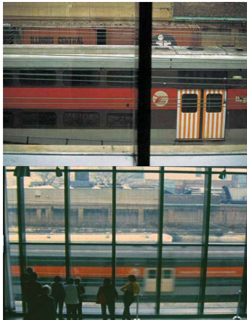
تصویر ۸- عکس یادگاری، لطفا به درها توجه کن! اثر در مکان، انستیتو هنر شیکاگو، ۱۹۸۰ تا ۱۹۸۲. م. (URL1).

حرکت فیزیکی، عنصری کلیدی برای درک آثار بورن می‌باشد. برای او تماشاگر باید فعال و در حال کاوش اثر از نقاط مختلفی باشد. در حالی که اثر، بایستی آماده برای دریافت در ابعاد مختلفی باشد که برخی تنها در جابه‌جایی آشکار می‌شوند. در نتیجه حرکت تماشاگر، موتور اثر می‌باشد. جابه‌جایی مخاطب به نسبت کادر نمایش (گالری، موزه، مکان عمومی و...)، مخاطب را در موضعی انتقادی نسبت به محیط قرار می‌دهد. این وضعیت خود را از طریق نوعی آگاهی القا می‌کند که منشای آن تعامل فیزیکی مخاطب با محیط است. نوعی بازی که بدن تماشاگر به واسطه‌ی دریافت اثر در محیط، به آن تن در می‌دهد. این نوع تعامل با اثر بورن به واسطه کارکردی نمادین را می‌توان در اثر دو حیاط ۳۹ (تصویر ۹) به سال ۱۹۸۶ در حیاط پشتی کاخ سلطنتی پاریس مشاهده کرد (Nakamura,