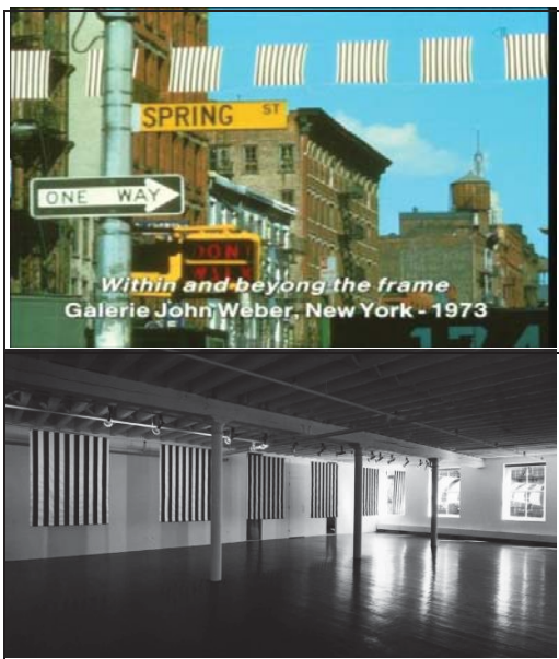
تصویر ۴- عکس یادگاری، «داخل و خارج کادر»، اثر در مکان، گالری جان وبر، نیویورک، اکتبر ۱۹۷۳. م. (URL1).

در پلاکارد وحشی بورن، این اثر هنری است که به پیشواز بیننده می‌رود؛ در واقع، او نوع دیگری از اثر را خلق می‌کند که این‌بار خود اثر، به استقبال بیننده خود می‌رود. آدم‌های ساندویچی ۲۶ بین سال‌های ۱۹۶۸ و ۱۹۹۰ اجرا شد؛ که شامل افرادی بود که تابلوهایی حامل نقش‌مایه‌های بورن را بر خود حمل می‌کردند و در خیابان‌های پاریس پرسه می‌زدند (تصویر ۳). در این جا نیز کارکرد موزه، به‌عنوان عنصری غیر پویا و منجمد در فرهنگ و پویایی مورد نظر هنر معاصر در ارتباط با مردم به سوال کشیده می‌شد.