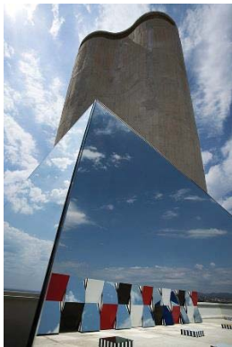
تصویر ۱۱- تعریف محدود در نامحدود، اثر در مکان، آینه، پلکس گلاس، نوارهای رنگی، شهرک مسکونی ماری، ۲۰۱۴. م. (URL3).

ثابت بودن نسبت به محیط، خصوصیت تمام آثار بورن نیست؛ اگر چه ارتباط بین این دو، همواره، تضمین شده است. در برخی از آثار دیگر، دانیل بورن امکان جابه‌جایی اثر را پیش‌بینی می‌کند. به صورتی که این آثار، توانایی تطبیق با محیط‌های مختلفی را داشته باشند. بورن این آثار را به تئاتر تشبیه می‌کند که امکان اجرا در مکان‌های مختلف با دکوری متفاوت بدون تغییر متن را فراهم می‌سازد. با هر بار تغییر ظاهر محیط، این آثار فهم ما را نیز تغییر می‌دهند. از جمله می‌توان به «کلبه‌های منفجر» ۴۴ شده اشاره کرد. بورن در تعدادی از آثارش - که ظاهری معماری وار دارند - از این عبارت استفاده می‌کند. این آثار شامل سازه‌هایی کلبه‌مانند با سطوحی نیمه پوشیده از نقش مایه بورن است و همچنین سطوح هندسی مشابهی که بر دیوارهای اطراف پخش شده‌اند. به نظر این گونه آثار، نوعی مکان را تعریف می‌کنند که با گسترده شدن قطعاتش با فضا ممزوج می‌شود. در این جا، پرسش میان اعمال تغییرات به فضا یا ساختن فضا مطرح می‌شود. سوالی که کار بورن را به حیطة معماری نزدیک می‌کند.