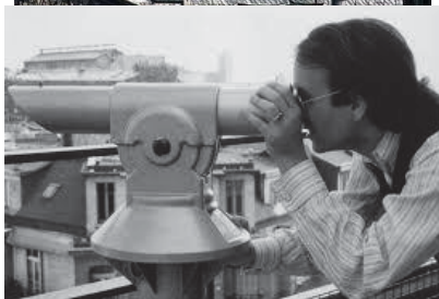
تصویر ۵- رنگ‌ها: مجسمه‌ها، ۱۹۷۵-۱۹۷۷، اثر در مکان، موزه ملی هنر مدرن، م. (URL2).