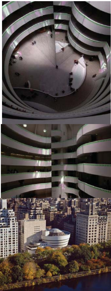
تصویر ۷- (پایین) نمایی هوایی از موزه گوگنهایم، (بالا و وسط) عکس یادگاری، گوشه خیابان، ۲۰۰۵، اثر در مکان، موزه گوگنهایم، نیویورک. م. (URL1).

این امکانات - که به صورت تعاملات فعال مخاطبان از قبل و توسط هنرمند پیش‌بینی شده - نه تنها به صورت نوعی از شناخت، باعث بروز آگاهی می‌گردد، بلکه از این راه نزد مخاطب نوعی مسئولیت‌پذیری و تعهد نسبت به اثر هنری و مقوله هنر را به وجود می‌آورد. ثابت بودن اثر از مخاطب، درخواست حرکت دارد.