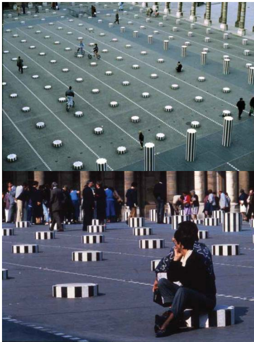
تصویر ۹- عکس یادگاری، دو حیاط، ۱۹۸۶، اثر در مکان، حیاط تشریفات کاخ سلطنتی، پاریس. م. (URL1).

جایی امر فرهنگی، از بستر زیبایی‌شناختی صرف خارج شده و به سوالی اجتماعی و سیاسی بدل می‌گردد. این نوع جابه‌جایی اثر هنری مستقل از فضای نهاد هنری در اثر دیگری در سال ۱۹۷۵ با عنوان بادبان/تابلو تابلو/بادبان ۳۸ دیده می‌شود. این اثر که در دریاچه‌ای در نزدیکی موزه‌ای در برلین اجرا شد، شامل چندین قایق بود که بادبان‌هایی با نقش‌مایه بورن داشتند و از داخل موزه قابل مشاهده بودند.