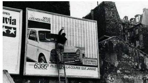
تصویر ۲- عکس یادگاری، دانیل بورن کاغذهای راه راه صورتی را برای پلاکاردهای وحشی نصب می‌کند، اثر در مکان، می ۱۹۶۹، م. (URL1).

بورن تجربه نقاشی با ابزار بصری را چنین تشریح می‌کند: «قبل از هر چیز، آن (ابزار بصری) مثل هر ابزار دیگری، اره، دوربین، چکش و... ویژگی‌های خاص خود را دارد. تمام این ابزارها، عموماً برای اجرای چیزی یا کارکرد معینی به کار می‌روند؛ اما وقتی نتیجه‌نهایی حاصل شد، دیگر اهمیتی ندارند. بر عکس، ابزار مورد اشاره و استفاده من نه تنها در ساختن اثر به کار می‌رود، بلکه از لحاظ بصری بخشی از نتیجه‌نهایی نیز می‌باشد» (Buren, 1998: 100).