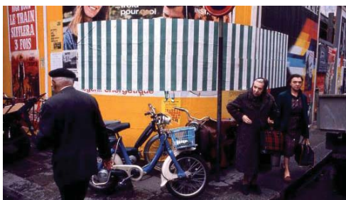
تصویر ۱- عکس یادگاری، پلاکارد وحشی، اثر در مکان، پاریس، می ۱۹۶۸ م. (URL1).

اجتماعی به صورت تنش‌هایی در محیط دانشگاهی بروز کرد که امروزه به نام انقلاب دانشجویی ماه می ۱۹۶۸ شناخته می‌شود. دنیای هنر هم از این تحولات سیاسی به دور نماند و جامعه هنری پیشرو هم با به چالش کشیدن ارزش‌های زیبایی‌شناختی حاکم، عرصه را برای بروز نسل جدیدی از هنرمندان با رویکردی نئوآوانگارد در هنر مهیا کرد، که دانیل بورن یکی از آنان بود. نگاه انتقادی برنده و پرسش‌گر این هنرمندان که عملاً رویکرد زیبایی‌شناسی را با موضع-گیری سیاسی آمیخته بود، باعث بروز ژست‌های هنری می‌شد که وجه مشترکشان رادیکال بودن و رد صریح سنت‌های مدرنیستی بود. فرم هنری مسلط در این زمان، هنر انتزاعی بود که توسط مدرسه هنرهای زیبای ترویج می‌شد. این فرم هنری -که دوران طفولیت خود را در اروپا طی کرده بود و سپس، در ایالات متحده به بلوغ رسیده بود- در این زمان، نشانه-هایی از ضعف زیبایی‌شناختی در تعریف خود به عنوان روش هنری موجه نشان می‌داد.