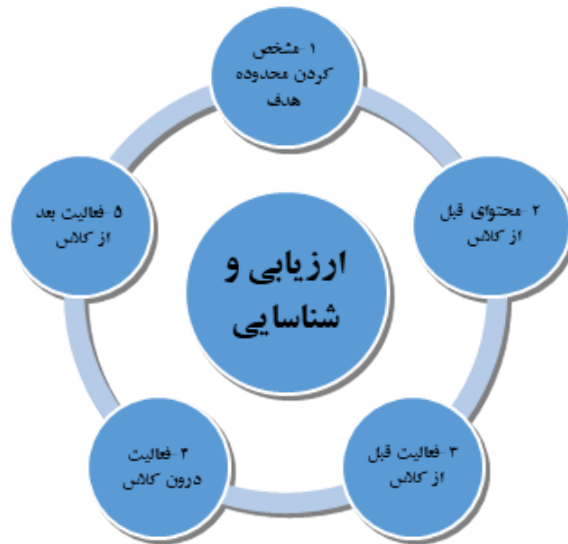
نمودار ۱: فرایند کلاس معکوس

فرایند کلاس معکوس بر اساس الگوی نمودار (۱) با مراحل زیر تشریح می‌شود: