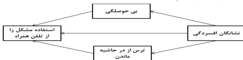
شکل ۱: مدل مفهومی پژوهش