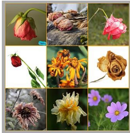
تصویر ۲: تصاویر نمایش داده به گروه دوم شرکت‌کنندگان (طبیعت بیجان و جاندار)

آرشیو نهایی گروه دوم، یعنی طبیعت بیجان و جاندار، شامل تصاویر مثبت، خنثی و منفی از گل، برگ و ساختمان بود که در کل ۱۴۳ تصویر مثبت و ۲۰۳ تصویر خنثی یا منفی را شامل می‌شد.