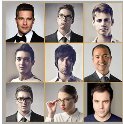
تصویر ۱: تصاویر نمایش داده به گروه اول شرکت‌کنندگان (چهره‌ها)

آرشیو نهایی گروه اول، یعنی جلوه‌های هیجانی چهره، شامل ۱۱۸ تصویر بود که ۵۵ تصویر با بارهیجانی مثبت و ۶۳ تصویر با بارهیجانی خنثی یا منفی بودند.