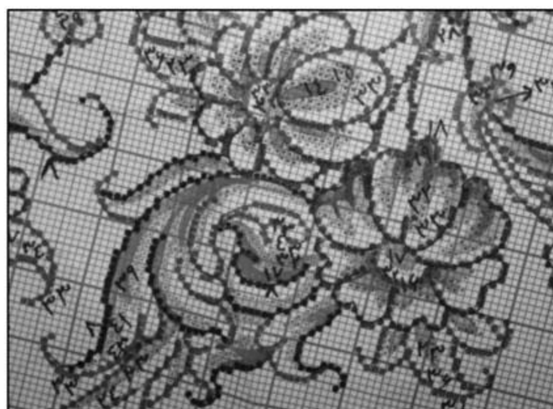
تصویر ۵: بخشی از نقشه نقطه‌شده بدون رنگ زمینه، رنگ سایه‌های ایجاد شده معمولاً در مرحله بافت با توجه به مستوره تغییر می‌کند.

رنگ و نقطه‌زدن است، توسط ماژیک و آبرنگ رنگ‌آمیزی و نقطه می‌شود. عمل نقطه‌کردن به بافنده در تشخیص محل دقیق گره‌ها و بافت سالم کمک می‌کند. از مزایای این روش می‌توان به مقایسه قسمت‌های بافته‌شده فرش با نقشه آن برای رفع عیب‌های احتمالی در هر مرحله از بافت اشاره کرد. این روش مطلوب بافندگان تازه‌کار نیز هست (تصویر ۳).