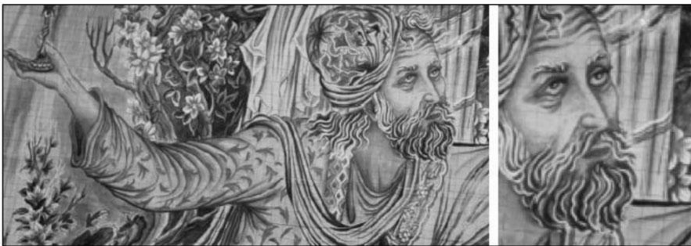
تصویر ۴: قسمتی از نقشه تصویری نقاشی شده بدون نقطه گذاری، اجرا شده روی کاغذ شطرنجی