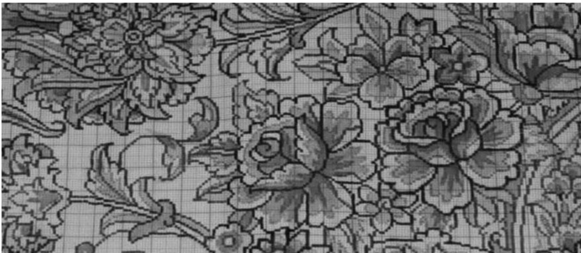
تصویر ۳: قسمتی از نقشه رنگ و نقطه‌شده به شیوه تبریز

در این روش پس از پیاده‌شدن طرح روی کاغذ شطرنجی مناسب، به وسیله طراح و یا فرد دیگری که شغلش منحصرأ