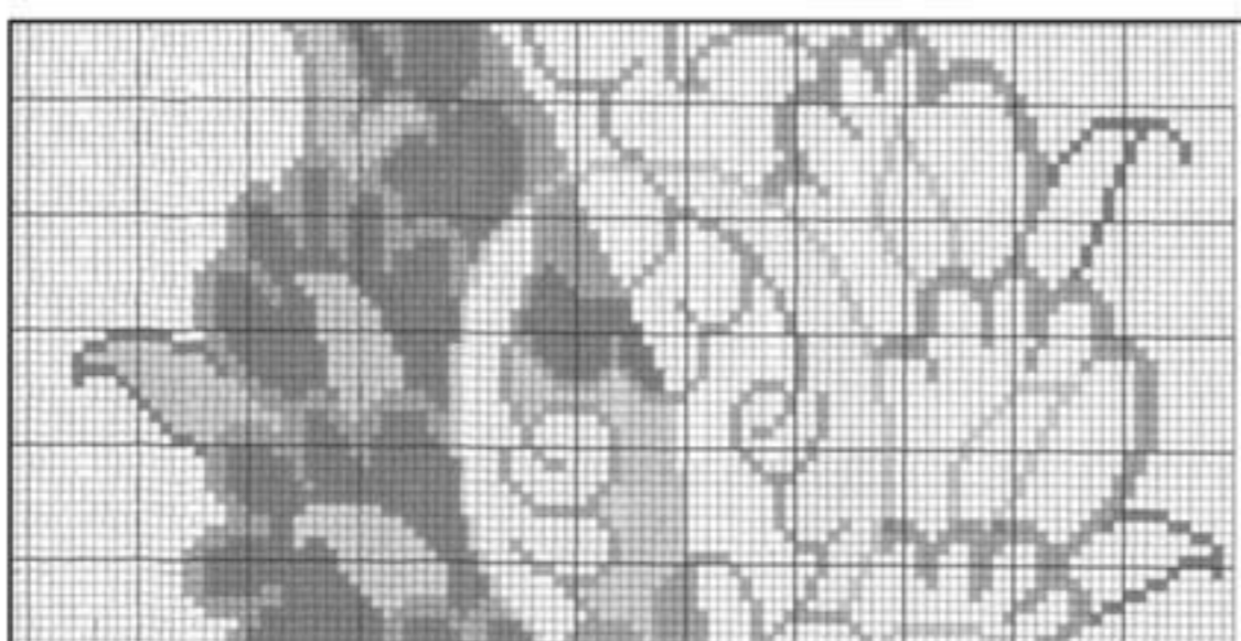
تصویر ۹: بخشی از یک طرح چاپی شطرنجی شده توسط رایانه