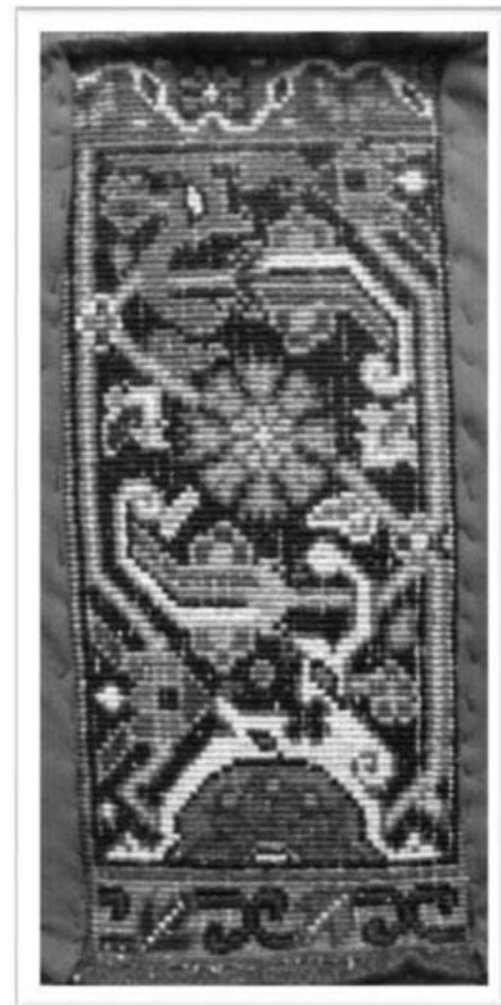
تصویر ۲: واگیره یا اورنگ، با طرح حاشیه سماوری، الگوی رایج بافت حاشیه‌های فرش در هریس

نگارگری و تذهیب و لزوم انتقال بی‌نقص و کامل طرح‌های نگارگران و مذهبانی چون سلطان محمد، آقا میرک اصفهانی و... روی فرش‌های دوره تیموری و صفوی، ضرورت استفاده از شیوه‌های کامل‌تر و دقیق‌تر برای این کار احساس شد. این احساس باعث ابداع نقشه‌های کاغذی طرح فرش و شطرنجی کردن آن‌ها به‌وسیله استادان جدول کش شد (میرزایی، ۱۳۸۸: ۱۲۴). چنانچه موری آیلند نویسنده کتاب قالی‌های شرقی می‌نویسد: «علیرغم فقدان شواهد مستقیم به‌نظر می‌رسد، استفاده از شیوه‌های طراحی روی کاغذ شطرنجی در بافت طرح‌های پیچیده در قالی‌های دوره صفوی رایج بوده است؛ همانطور که تناسبات و قرینگی‌های دقیق، این موضوع را تأیید می‌کند» (Eiland, 1998: 28). با پیشرفت تکنولوژی و اختراع دستگاه‌های چاپ، کاغذهای شطرنجی چاپی برای طراحی نقشه فرش در اختیار طراحان قرار گرفت. «بر اساس قدیمی‌ترین نقشه‌های فرش باقیمانده، احتمالاً فاصله سال‌های ۱۳۱۵-۱۳۲۰ هجری شمسی صنعت چاپ برای جدول کردن کاغذ طراحی فرش به کمک طراحان آمد» (ژوله، ۱۳۸۱: ۵۰). با این کار بیش از نیمی از زمانی کاهش یافت که طراحان صرف آماده‌کردن کاغذ طراحی و شطرنجی کردن آن به‌وسیله دست و با استفاده از قلم فلزی، مرکب و خط‌کش می‌کردند. ورود کاغذهای شطرنجی و استفاده از آن‌ها باعث شد طرح‌ها دقیق‌تر، ماندگارتر و بافت آن‌ها از سهولت بیشتری بهره‌مند شود.