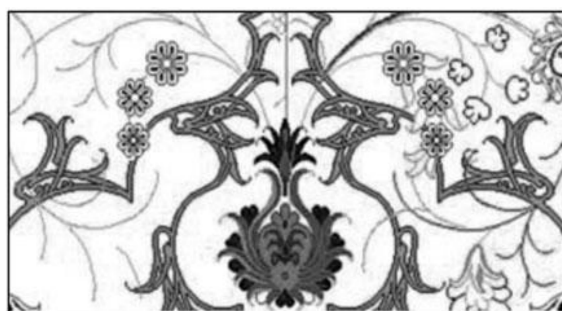
تصویر ۱۰: آماده‌سازی نقشه رایانه‌ای با رعایت اصول طراحی سنتی و دستی در تبریز

با توجه به اختصاص سهم قابل توجهی از تولیدات فرش تبریز به تابلوبافی از تصویرهای اشخاص، منظره‌ها و تابلوهای نقاشی، استفاده از رایانه و نرم‌افزارهای پشتیبان در تهیه نقشه‌ها جایگاه خاصی دارد با اینکه شیوه آماده‌سازی نقشه در محیط مجازی رایانه تقریباً از روش ثابتی پیروی می‌کند با این حال در نحوه ارائه نقشه‌های رایانه‌ای به بافندگان تفاوت‌های شاخصی وجود دارد که مطالعه جداگانه آن‌ها را ایجاب می‌کند.