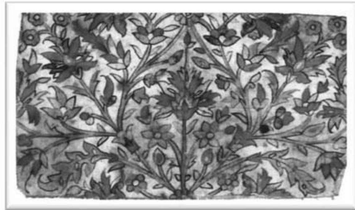
تصویر ۱: دستمال نقشه یا چشنی هریس، طرح واگیره‌ای (سر هم سوار) اجراشده روی پارچه کتان

آن، به‌ویژه در محیط کارگاه فرشبافی به نظر می‌رسد، پیاده‌کردن این طرح‌ها و نقوش آن روی پارچه‌های سفید و محکم (تصویر ۱) و یا بافت نمونه‌های کوچک با نقش‌مایه‌های اصلی فرش، موسوم به «اورنگ» یا «واگیره» (تصویر ۲) برای الگوسازی بافت فرش‌های بزرگ از راه حل‌های اولیه بوده است.