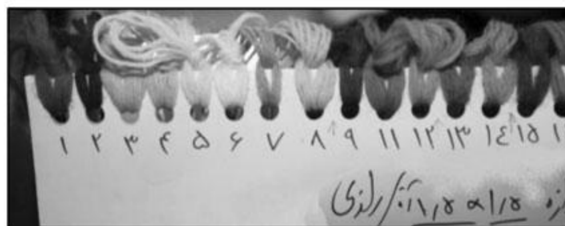
تصویر ۶: بخشی از یک مستوره رنگ، اندازه نقشه و شماره رنگ‌ها روی آن نوشته شده است.