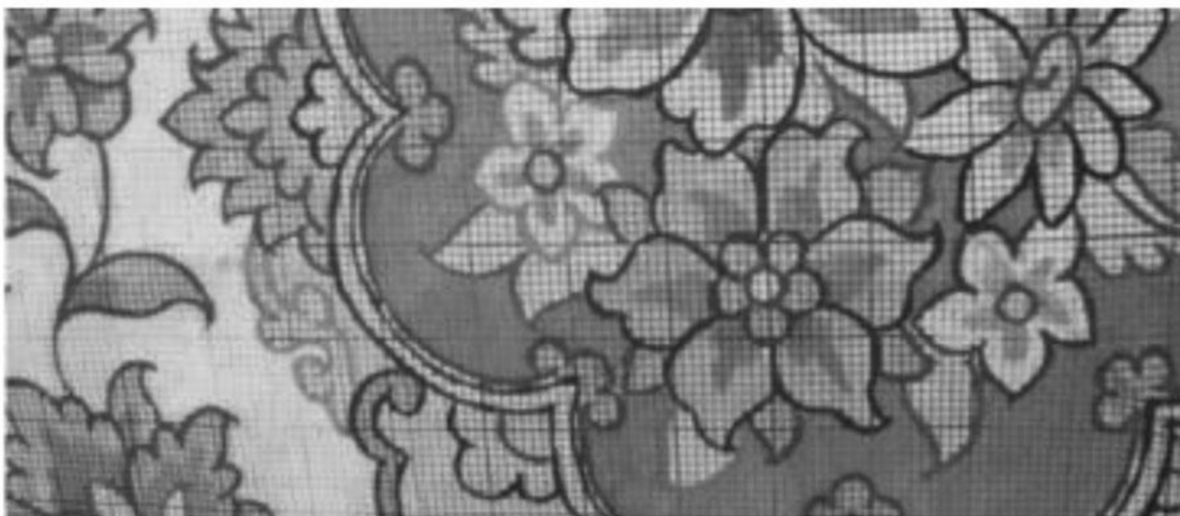
تصویر ۷: بخشی از یک نقشه رنگی دورگیری‌شده بدون نقطه‌گذاری خطوط جداکننده

«در بعضی مناطق ایران، بافندگان چنان ماهرند که می‌توانند از روی عکس یا یک طرح خام، اقدام به بافت قالی نمایند» (Eiland, 1998: 28). در این روش بافنده ماهر، عکس یا نقاشی را بر اساس اندازه و استاندارد مورد نظر برای بافت به‌وسیله یک شبکه مربع به نحوی که هر یکصد گره در یک مربع قرار گیرد (ده گره طولی و ده گره عرضی) تقسیم‌بندی می‌کند، سپس با چله‌کشی بر اساس خانه‌های به‌دست آمده اقدام به بافت آن می‌کند. در برخی مواقع نیز برای سهولت تشخیص مرزهای رنگی، اقدام به دورگیری اجزاء تصویر به‌وسیله مداد می‌کند. بافت این قبیل نقشه‌ها نیازمند دقت، مهارت و استعداد بالای هنری است. این سبک ارائه نقشه تا قبل از رواج نقشه‌های رایانه‌ای استفاده وسیعی در تابلوبافی تبریز داشت؛ ولی امروزه در بافت نقشه‌های هنری و بسیار ظریف استفاده می‌شود.