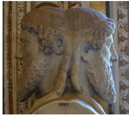
شکل ۲: سردیس زانوس

در دیدگاه کارای (Caray, 2011)، تکرار از جنبه ساختاری و ظاهری سازنده است و به نوعی هماهنگی و یک‌پارچگی در متن ایجاد می‌کند. همان‌گونه که سردیس زانوس نشان می‌دهد در ظاهر با رونوشت یک‌چهره یا «تکرار همان» مواجهیم. هر چند، در اصل، این سردیس بیانگر «تکرار همان در غیر» است و نمی‌توان این دو را به بهانه یکسان بودن صورت، یکی دانست. بنابراین تکرار، با وجود سازندگی ظاهر، برای دریافت متن، پذیرش معنا و درک آن ویرانگر است. چرا که خواننده را دچار سردرگمی می‌کند. به ویژه اینکه در متن ساروت با پدیده‌ای به نام تروپیسیم و احساس‌های غیر قابل بیان زبان درونی روبه‌رو هستیم. بنابراین، تکرار در صورت و ظاهر، سازنده و در معنا و باطن مخرب و ویرانگر است. می‌توان ادعا کرد که تکرار در نوشتار ساروت، نقشی فراتر از یک فیگور یا آرایه ساده نوشتار را بر عهده داشته و در کنار سایر ساختارهای زبان کلامی، در نوعی فرآیند خودتخریبی و خودتنظیمی مشارکت می‌کند. این ناپیوستگی و نوساناتی که در اثر تکرار صورت یا حتی معنا ایجاد می‌شود جنبه پراگماتیک یا عملگرایی زبان ساروت را قدرتمندتر می‌کند.