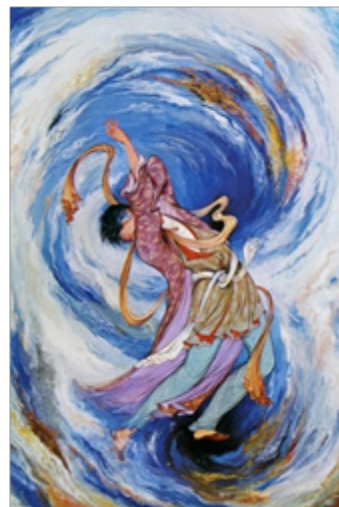
تصویر ۹- «گرداب»، ۵۲ × ۷۲، ۱۳۴۴.

ترکیب‌بندی مدور به‌طور چشمگیر، از دهه چهل