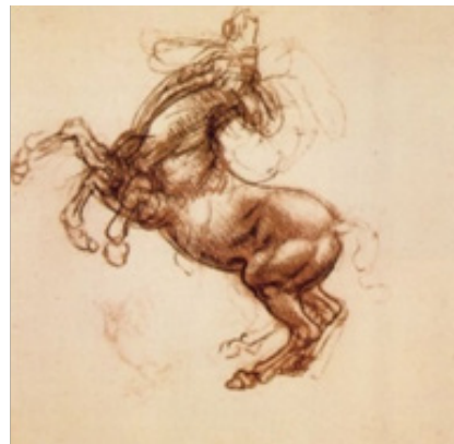
تصویر ۸- طراحی از اسب، فرشچیان، پراتو ایتالیا، ۱۲۸۳. مأخذ: (فرشچیان، ۱۳۸۷: ۱۴۰)