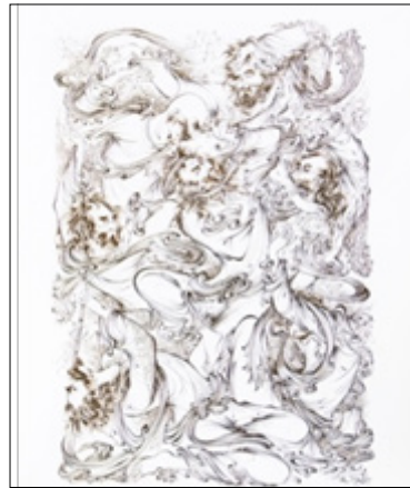
تصویر ۵- حکایت نی، سیاه‌قلم، ۱۳۵۴. مأخذ: (فرشچیان، ۱۳۵۵: ۳۷)