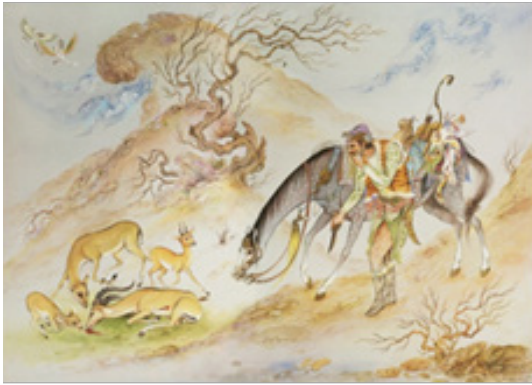
تصویر ۱- «شکار»، ۵۲ × ۷۲، ۱۳۵۰.

عمل را تقبیح می‌کند، بلکه فراتر از آن، حتی در اثری چون «انتقام»، درصدد خون‌خواهی نیز برمی‌آید. این مضمون با این رویکرد در مکاتب سنتی گذشته، به کلی بی‌سابقه بوده است. خود هنرمند در این مورد می‌گوید: «استادان بزرگ و هنرمندان قدیم در تصاویر خود طبق روال طبیعت، حیوانات درنده را بر حیوانات ضعیف مسلط می‌نمودند. من برای نخستین مرتبه سعی کردم، حیوانات ضعیف و رام را بر حیوانات درنده خو مسلط نمایم و توفیق دهم.» (فرشچیان، ۱۳۹۳: ۱۹۷).