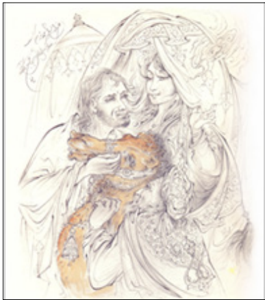
تصویر ۶- طراحی مدادی، بی‌عنوان، ۱۳۸۷. مأخذ: (فرشچیان، ۱۳۹۱ الف: ۳۳)

«جلوت» و به‌مانند خوشنویسی، یکسره دارای مشق «ذهنی»، «نظری» و «عملی» است. به استناد مشاهدات چندین ساله نگارنده و اظهارات هنرمند و همسر ایشان، هنرمند همواره یک دفتر و مداد طراحی به همراه دارد. وی در مطب پزشکی به فکر قرص و شربت و یا در هواپیما و سالن انتظار فرودگاه در اندیشه تأخیر پروازها نیست، او هوشمندانه وقتش را مدیریت می‌کند. او مجموعه‌ای از همین طراحی‌ها را در تابستان سال ۱۳۹۱ و توسط خانه فرهنگ و هنر گویا منتشر نموده است. حدود بیست اثر از این طراحی‌ها دارای تکرنگ اکر (اخرایی) به‌مانند سیاه‌قلم‌ها هستند. (تصویر ۶) او ارزش طراحی را، ابتدا نزد حاج میرزا آقا امامی، سپس عیسی بهادری و در نهایت در نزد استادان بزرگ رنسانس آموخت. وزارلی «طراحی یا طرح‌بندی» ۵ را اصل بنیادین هنر و طبیعت و مأخذ داوری هنرمندان می‌داند. او این واژه را به‌مثابه بنیاد یا پدر نقاشی، پیکره‌تراشی و معماری می‌داند که منجر به خلق پیکره‌های برسائو (آرمانی) شده می‌گردد (ماری، ۱۳۸۹: ۱۴۵). در آغاز کار او با قدرت و با پشتکاری مثال‌زدنی و به‌طور شبانه‌روز طراحی می‌نمود و بدان جا رسید که در قلم‌گیری‌ها و سیاه‌قلم‌های سال ۱۳۵۴، خود را نشان داد. او بعدها حتی نیازی به طراحی مدادی و پیش‌طرح نداشت و غالب آثارش را، چون بداهه‌نوازی در موسیقی ایرانی و بداهه‌نوازی بتهوون ۵۱ در موسیقی