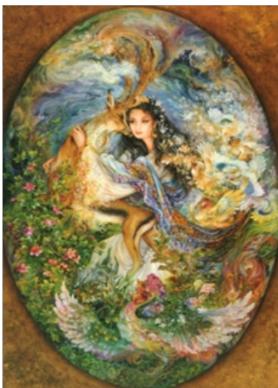
تصویر ۴- «تصویری از مهر»، ۸۰ × ۵۶، ۱۳۷۱.

به لحاظ «هستی‌شناسی»، عالم مثال از کلیدی ترین و پیچیده‌ترین مباحث نظام فلسفی و آفرینش‌های هنری ایرانی اسلامی است. عالم خیال جوهری مستقل، ممتاز و فراتر از جوهر جسمانی دارد و به جوهر عقلانی صورت می‌دهد و از جوهر جسمانی ماده می‌گیرد. این ویژگی‌ها در آثار فرشچیان قابل‌بازشناسی است. یعنی در آثار موردبررسی، از طرفی شاهد صورت‌هایی هستیم که از عالم محسوسات و تجربه محیط هنرمند سرچشمه گرفته‌اند ولیکن فاقد ماده هستند و از طرف دیگر شاهد امور خیالی، متافیزیکی و معقولی هستیم که در کالبد صورت‌ها و فرم‌های محسوس دیداری تنزل یافته‌اند. اگر چنین نبود، نگاره‌ها مجال تفسیر و تأویل نمی‌یافتند و یکسره ترجمه تجسمی می‌یافتند و در حد آثار طبیعت‌گرا و واقع‌گرا تنزل پیدا می‌کردند. در جغرافیای خیال آثار فرشچیان اقلیم مشخصی مشاهده نمی‌گردد؛ یعنی قلمرو خیال و تخیل هنرمند به‌طور کلی گرانمند و زمانمند نیست و راوی عوالم انفسی و درونی هنرمند است. (تصویر ۴)