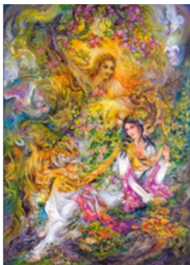
تصویر ۳- «برای زیستن»، ابعاد ۳/۸۱ در ۵۶

نگاره‌های فرشچیان که بر پایه اصالت‌های نقاشی سنتی ایرانی است؛ با رویکرد «انسان‌شناسی» ۱۵ و «هستی‌شناسی» ۱۶ سرشار از تخیل خلاق و جهش‌های نوآورانه است که هیچ تقلید و تقیدی را بر نمی‌تابد. همچنین، همان طوری