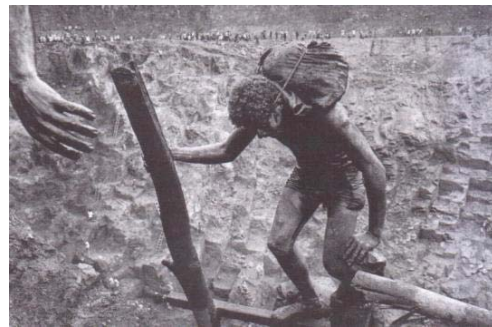
تصویر ۱۰- سالگادو، معادن طلای برزیل، ۱۹۷۲. (کریم مسیحی، ۱۳۸۹: ۱۷۸)