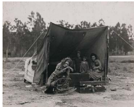
تصویر ۱- دورتیا لانگ، مادر و فرزندانش، ۱۹۳۶.

می‌شوند. از این نظر، برخی از عکس‌های مستند اجتماعی نیز حالتی ارجاعی و گزارشی دارند و اطلاعاتی را در اختیار مخاطب قرار می‌دهند. مخاطب، به‌وسیله تماشای عناصر درونی عکس، از موضوع یا رویدادی با خبر می‌شود و اطلاعاتی حقیقی و اثبات‌پذیر نسبت به موضوع عکس دریافت می‌کند. به‌مانند نثر که پیام را روشن و مستقیم بیان می‌کند، این نوع از عکس‌ها نیز بی‌پیرایه در خدمت نمایش واقعیت صحنه‌اند. از این رو، عکاس با انتخاب قابی عادی، عناصر گزینش‌شده را به‌گونه‌ای متعارف و معمولی در قاب عکس با هم ترکیب می‌کند، تا سوژه موردنظر را بی‌کم و کاست و بدون جرح و تعدیل ثبت کند و جنبه گزارشی و اطلاع‌رسانی عکس را حفظ نماید (تصاویر ۱ و ۲).