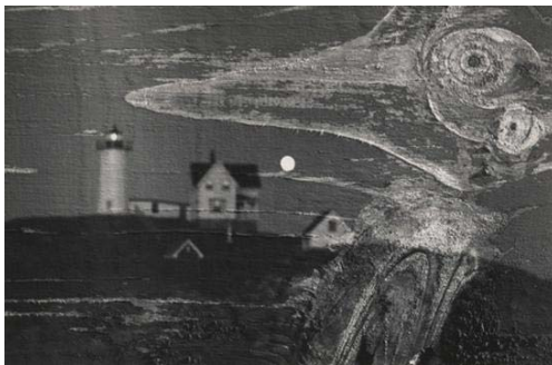
تصویر ۱۲- ماینور وایت، دابل اکسپوز، ۱۹۶۹. (www.leegallery.com/minor-white/photography)

شعر، با گریز از قواعد دستوری زبان عادی و خودکار آفریده می‌شود (صفوی، ۱۳۸۳: ۵۴). در عکاسی مستند اجتماعی، اصلی‌ترین ابزار عکاس برای گریز از ثبت عادی عناصر و رویدادهای اجتماعی و خلق عکس‌های شعرگونه، قاب و لحظه گرفتن عکس است. در بعضی از شاخه‌های عکاسی، عکاس می‌تواند با به‌کارگیری امکانات دوربین، مانند حرکت دوربین، چرخش لنز، استفاده از فیلترهای ویژه، ایجاد کنتراست غیرمعمول، محو نمودن عناصر و... به آشنایی‌زدایی از واقعیت بپردازد و جلوه‌های تصویری و بصری خاصی ایجاد نماید؛ یا از واقعیت فاصله بگیرد و حتی آن را مخدوش نماید و عکسی شعرگونه خلق نماید (تصویر ۱۲).