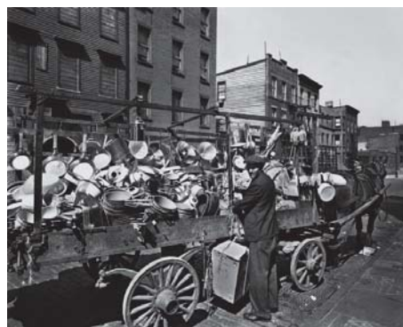
تصویر ۲. برنیس ابوت، فروشگاه سیار، نیویورک، ۱۹۳۶. ( www.commercegraphics.com/ba_gallery.html )

وظیفه اصلی زبان عادی و روزمره، تفهیم و تفاهم است (شمیسا، ۱۳۷۲: ۸۵)؛ در نثر، به‌عنوان زبان عادی، دلالت از نوع صریح است. بدین شکل که، در نثر، دریافت و درک پیام، آسان و راحت است؛ از این نظر، در برخی از عکس‌های مستند اجتماعی نیز موضوعات به شکلی ساده و آشنا به تصویر درآمده‌اند و فهم‌دنیای آن‌ها، چندان دشوار و پیچیده نیست. چراکه، عکاس