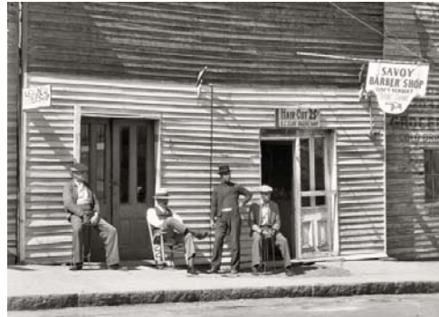
تصویر ۳- واکر اوانز، خیابان، ۱۹۳۵. (www.shorppy.com/node/5776)