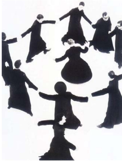
تصویر ۷- جاکومتی، راهبه‌ها، ۱۹۷۰.

در عکس‌های نظم‌گونه، عناصر دنیای واقعی در قاب عکس به عناصری بصری چون نقطه، خط و سطح تبدیل می‌شوند، که حاوی پیامی نیز هستند؛ به این شکل اطلاعاتی پیرامون موضوعی ارائه می‌کنند. در واقع، به‌مانند گونه نظم، در این عکس‌ها، پیام و موضوع در قالب و صورتی موزون به مخاطب عرضه می‌شود. برخی از عکس‌های برسون از چنین حالت و کیفیتی برخوردارند. به طوری که «بی‌آنکه بخواهیم ارزش گزارشی کارهای برسون را کوچک جلوه دهیم، باید گفت، عکس‌های کارتیه برسون، بیش‌تر به لحاظ زیبایی‌شان توسط عکاسان دیگر ستوده می‌شوند. آن‌ها دارای جذبه تعادل و تناسب، شگفتی، سادگی و ایجاز، کشش و ظرافت بصری‌اند» (سارکوفسکی، ۱۳۹۳: ۱۹۴). به‌هرفقدیر، در عکس‌های نظم مانند، عکاس به‌واسطه نحوه قاب‌گذاری و ثبت سوژه در لحظه‌ای خاص از جهان واقعی، آشنایی‌زدایی می‌کند و به‌جای ارجاع صرف مخاطب به واقعیتی بیرونی، توجه او را به نحوه ترکیب عناصر با یکدیگر و صورت عکس جلب می‌نماید. اگر در حیطه زبان، «نظم از طریق قاعده‌افزایی ۴ بر نثر پدید می‌آید» (صفوی، ۱۳۸۳: ۵۴)، در حیطه عکاسی مستند اجتماعی، عکاس به‌وسیله قاب‌گذاری (عمودی یا افقی و زاویای پایین و بالا و چپ و راست) و انتخاب لحظه گرفتن عکس و ترکیب عناصر در زمانی خاص، می‌تواند از ثبت صریح