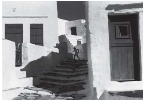
تصویر ۶- کارتیه برسون، یونان، ۱۹۶۱. (همان)

در این نوع عکس‌ها، چگونگی ترکیب تک‌تک عناصر با یکدیگر برای عکاس اولویت داشته و عناصر و رویدادهای اجتماعی جهان پیرامون، بهانه‌ای برای مکاشفه بصری و زیبایی‌شناسی او بوده‌اند. عکس‌های نظم‌گونه را می‌توان در تطابق با این دیدگاه برسون (Bereson)، درباره عمل عکاسانه دانست: «عکس گرفتن به معنای یافتن ساختار جهان، غرقه شدن در لذت ناب فرم و آشکار ساختن این مساله است که در سرتاسر این هاویه (برزخ دنیا) نظمی برقرار است» (سونتاگ، ۱۳۹۰: ۱۱۹-۱۲۰).