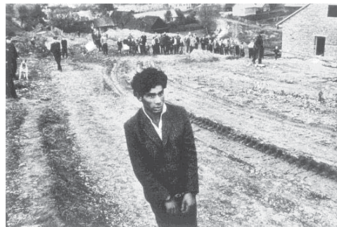
تصویر ۱۳- کودلکا، دستگیری سارق، ۱۹۳۸. www.pro.magnomphoto.com/c.aspx

در رابطه با قاب انجام می‌دهد، دچار تغییر شده و در کیفیت و کارکرد و حالت عکس، مؤثر واقع می‌شود. چشم عکاس به کمک قاب، همواره در حال ارزیابی است. از طریق قاب، عکاس می‌تواند به عکس خود، جلوه و کارکرد و کیفیت متفاوتی ببخشد. «عکاس می‌تواند به سادگی با حرکت دادن سرش، به اندازه یک میلی‌متر، تطابق خط را برقرار سازد. می‌تواند با اندکی خمیدن زانو، پرسپکتیوها را تغییر دهد. او با قرار دادن دوربین در فاصله‌ای نزدیک‌تر یا دورتر از موضوع، شاخ و برگ می‌دهد» (برسون، ۱۳۸۸: ۸۷). همچنین، از آنجاکه محورهای عمودی و افقی در بازنمایی‌های تصویری، نقش مهم و تأثیرگذاری دارند (چندلر، ۱۳۸۷: ۱۳۸)؛ قاب عمودی یا افقی یک عکس و زوایای چپ یا راست و بالا یا پایین آن، هر کدام دلالت‌های ضمنی مختص خود را ایجاد می‌کنند و سبب خلق عکس‌هایی با کارکردها و کیفیت‌های بصری و معنایی متفاوت می‌شوند. مانند عکس شماره ۱۲، که عکاس با ایجاد اندکی انحراف در قاب عکس، توانسته بر دلالت‌های ضمنی عکس بیفزاید (جاده به مانند طناب داری شده که دور گردن متهم، پیچیده شده است).