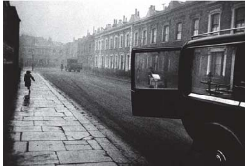
تصویر ۹- رابرت فرانک، لندن، ۱۹۵۳. (کو، ۱۳۷۹: ۱۹۸)

استنباط، گمانه‌زنی و خیال‌پردازی وامی دارند (تصاویر ۹ - ۱۱).