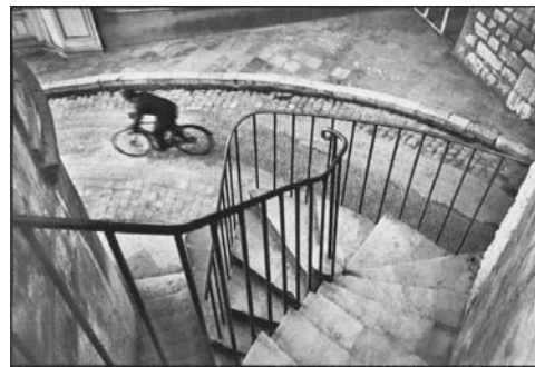
تصویر ۵- کارتیه برسون، فرانس، ۱۹۳۲. (www.henricartiebresson.org)

لحظه‌ای خاص و به شکلی جدید، نامتعارف و جسورانه، صورت عکس یعنی نحوه هم‌نشینی و رابطه درونی عناصر عکس را برجسته ساخته است (تصاویر ۵-۷). از این بابت، اگر در عکس‌های نثرمانند، با مساله ثبت ساده وقایع و لحظه‌های معمول، سروکار داریم، در عکس‌های نظم‌مانند، با ترکیب عناصر واقعی به شکلی موزون و جذاب و در لحظه‌ای خاص، مواجهه می‌شویم؛ ترکیبی که حس زیبایی شناسانه ما را برمی‌انگیزاند. در این نوع عکس‌ها، نحوه نگاه عکاس به موضوع اهمیت بیش‌تری دارد، تا خود موضوعی که ثبت شده است. از این جهت، تفاوت عکس‌های شبیه نثر با عکس‌های شبیه نظم را می‌توان تفاوت میان گرفتن تصویر با ساختن تصویر دانست.