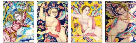
تصویر ۴- نقش اساطیری فرشته در کاشی‌های محوطه باستانی کاخ گلستان.

فرشتگان در برخی از تصاویر نقاشی شده روی کاشی‌ها و استفاده از سایه روشن و حجم نمایی در پوشش فرشتگان و اندام آن‌ها، تاکید محکمی بر نفوذ شیوه نقاشی اروپایی در هنر نقاشی قاجار است. علت این تاثیرپذیری از غرب، در پی رشد ارتباطات فرهنگی میان جامعه ایران و اروپا در دوره قاجار بوده است. مشابه این تصاویر را می‌توان در نقاشی دیواری‌های دوران رنسانس در اروپا نیز مشاهده نمود. «این فرشتگان یادآور (کوپید) کودک- خدای عشق یونانیان باستان می‌باشند؛ بنابراین، در دوره قاجار هم مانند رنسانس، فرشته‌ها از جایگاه آسمانی خود به زمین نزول کرده‌اند» (صفرزاده، ۱۳۹۳: ۶۴). فرشتگان به صورت تفکیک شده و در فریم‌های جداگانه ترسیم شده‌اند و در کنار این نقش، پیکره‌های انسانی دیگری دیده نمی‌شود. این طور به نظر می‌رسد که، تلفیق و همراهی فرشتگان با دیگر شخصیت‌های انسانی، از اهمیت و ارزش آن‌ها می‌کاسته است؛ بنابراین، ترسیم جداگانه این شخصیت‌ها، در هر قاب و قرار دادن فضاهای مجزا برای آن‌ها، تاکید بر ارزش و اهمیت آن‌ها است. در مقابل نقش زن فرشته، نقش انسانی مرد قرار دارد، که از دیگر نقش‌های پرکاربرد انسانی در کاشی‌های محوطه باستانی کاخ گلستان می‌باشد و بسیار متمایز از نقش فرشته، ترسیم شده است. در بخش بعدی، ویژگی نقش انسانی مرد بررسی شده است.