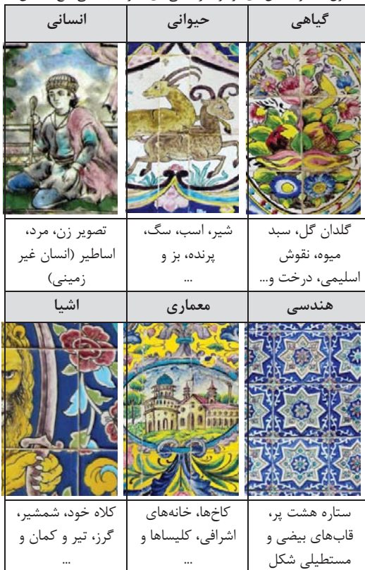
جدول ۱. نمونه نقش‌های موجود در کاشی‌های محوطه باستانی کاخ گلستان

به کار رفته در کاشی کاری قاجار به چند گروه تقسیم می‌شوند، گروه نخست، چهره شاهزادگان، درباریان زن و مرد با لباس‌های فاخر؛ گروه دوم، صحنه‌های درباری شامل حضور سفیران و نمایندگان سیاسی، دیدار مردم با شاه و غیره؛ گروه سوم، نقاشی‌های درباری مانند رقص و حرکات بندبازی که عموماً زنان انجام می‌دادند؛ گروه چهارم، نقاشی‌های حماسی، مذهبی و ملی بودند (آیت‌اللهی، ۱۳۸۰: ۳۰۰). در مجموعه کاشی‌های محوطه باستانی کاخ گلستان نیز شاهد نقوش متنوعی از این گروه، مانند نقوش گیاهی، جانوری، انسانی و هندسی می‌باشیم که نقش‌های هندسی، اسلیمی و پیچک‌ها در کنار نقش گلدان‌های گل و سبدهای میوه، فرشتگان و اساطیر و یا پرندگان مشاهده می‌شوند. در لابلای این نقوش، تک قاب‌هایی از کاشی نیز به چشم می‌آید که صحنه‌هایی از بناهای معماری و یا شخصیت‌های انسانی را در بر گرفته‌اند، که تمامی این نقش‌ها، ویژگی‌های ترسیمی قاجار دارند و در این بین، موضوع انسان و شیوه ترسیم شخصیت‌ها بیش از دیگر نقوش، چشم بیننده را به خود جلب می‌کنند. در جدول ۱، نمونه نقش‌های استفاده شده در حیاط باستانی مجموعه، معرفی شده است.