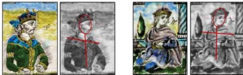
تصویر ۳- آنالیز ترکیب‌بندی و جهت نگاه با تاثیر از عکاسی، در نمونه نقش‌های انسانی در کاشی‌های محوطه باستانی کاخ گلستان.

- نقش انسانی مرد: در تصویر مرد، تنوع بیش‌تری هم از لحاظ شیوه ترسیم و هم از لحاظ موضوعی دیده می‌شود. مرد به صورت شخصیت‌های سیاسی، ملی، مذهبی، سربازان جنگجو یا محافظ وجود دارد. گاه تصویر انسانی مرد به صورت انفرادی در قاب قرار می‌گیرد و گاه تصویر نقاشی شده او را در تابلوهای داستانی محوطه می‌توان مشاهده نمود. تک فریم‌های موجود بر روی کاشی‌های لعابدار و برجسته محوطه باستانی کاخ گلستان، تصاویری از شخصیت‌های ملی، مذهبی را به نمایش می‌گذارند. این پیکره‌ها اغلب به صورت برجسته هستند و با استفاده از هاشور و دورگیری‌های مشکی رنگ ترسیم شده‌اند و رنگ‌های روشن، آن‌ها را پوشش داده‌اند. این شیوه، الهام گرفته از تصاویر چاپ سنگی این دوره می‌باشد. پیکره‌ها به صورت نیم‌رخ یا سه‌رخ ترسیم شده‌اند و نگاه آن‌ها به خارج از کادر هدایت می‌شود؛ این نوع ترکیب‌بندی و شبیه‌سازی از رواج عکاسی در این دوره، ریشه گرفته است. تصویر ۳، این نوع ترکیب‌بندی را مشخص می‌نماید.