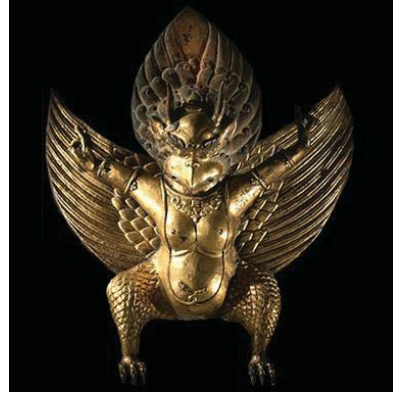
تصویر ۱۰- گارودا.

آن قوم نزد حنظله بن صفون که پیامبرشان بوده است، رفتند و شکایت کردند. او هم دعا کرد و خدا آن مرغ را از میان برداشت (ثروتیان، ۱۳۵۲: ۲۰۴). اما باید توجه داشت که تنها وجه مشترک سیمرغ و عنقا در مرغ بودن و افسانه‌ای بودن آنان است. در واقع عنقا یک اسطوره عربی است و سیمرغ یک اسطوره ایرانی. شباهت‌های گفته شده باعث شده است که در ذهن شاعران و نویسندگان، این دو مرغ اسطوره‌ای، گاهی به هم مشبه شوند؛ حال آن‌که در حقیقت خاستگاه متفاوت دارند.