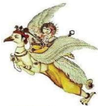
تصویر ۹- گارودا.