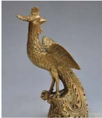
تصویر ۵- ققنوس.