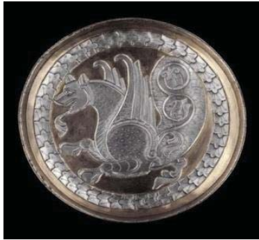
تصویر ۲- سینی دارای روکش نقره و نقش سیمرغ، قرن ۷-۸ م. (محمدی حاجی‌آبادی و پورمند، ۱۳۹۰: ۶۰).

گرفته است که در برخی موارد، این فرم بر طراحی سیمرغ نیز اثر گذاشته است. نقوش تزیینی یا هندسی دارای قابلیت تکرار است و حرکت دایره‌ای و پویایی را تشدید می‌کند که مفهوم نمادین عالم، زندگی و حیات است. سیمرغ در دایره، تمثیلی از الوهیت و نیروهای آسمانی است (همان: ۱۹-۲۳).