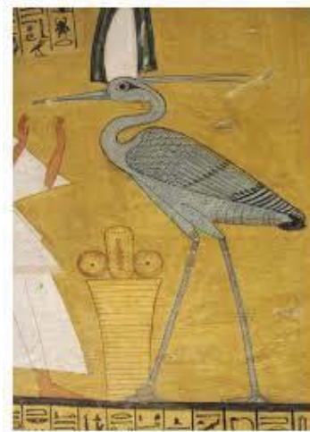
تصویر ۶- بنو.

یونان و افسانه‌های مسیحی، فونیکس خوانده می‌شود(همان: ۱۳۹). (تصویر ۷ و ۸).