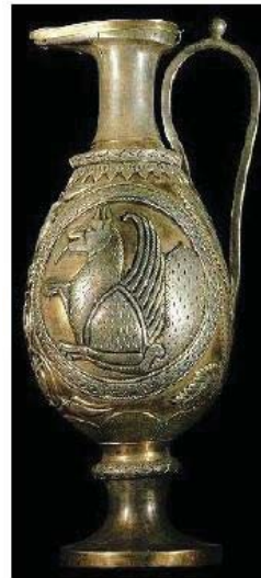
تصویر ۱- ابریق سیمین زراندود شده با نقش سیمرغ، موزه ارمنستان (www.hermitagemuseum.org).

ترکیبی از اژدها و طاووس می‌دانند که زبانه آتش از دهانش فوران می‌کند (تصاویر ۱ و ۲). آثار فلزی و منسوجات ساسانی، مملو از این نقش نمادین است (گیرشمن، ۱۳۵۰: ۲۱۹). بدن و سر سگ، شیر (در برخی از موارد، دیگر چهارپایان) نماد زمین، بال‌های پرنده سمبل آسمان، پولک و فلس‌های ماهی در پوشش بدن سیمرغ، نماد آب است و در برخی موارد، آتشی نیز از دهان وی خارج شده است. به نظر می‌رسد که میان انتخاب این حیوانات برای نقش‌مایه سیمرغ و عناصر اربعه ارتباط معناداری وجود داشته باشد؛ هر یک از حیوانات نماد یکی از عناصر اربعه بوده‌اند و این موضوع، می‌تواند متأثر از نیروی جاودانگی حیات و یاری رسانندگی وی باشد که با نسبت دادن عناصر اربعه به نقش مایه وی، متجلی شده است (طاهری، ۱۳۸۸: ۱۸-۱۹).