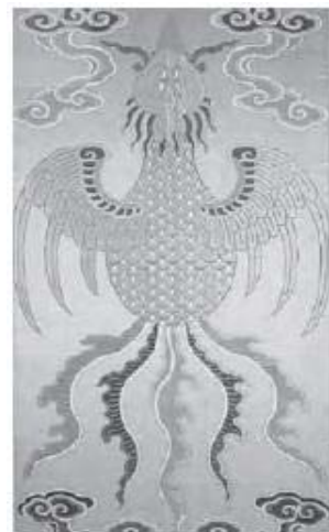
تصویر ۸- فونیکس چینی، قرن ۱۷ میلادی (Bushell, 1910: 97).

شفیعی کدکنی در تصحیح منطق‌الطیر راجع به اشتقاق ققنوس و فونیکس می‌گوید: در مصر باستان، فونیکس با عقاید مربوط به پرستش خورشید آمیخته شده است و نمادی از مرگ و زندگی و تقابل آن‌ها است. خورشید در مغرب می‌میرد و در مشرق زاده می‌شود. پس به تعبیری خورشید، همان فونیکس است(عطار نیشابوری، ۱۳۸۳: ۱۶۷). در روایات، چون مرگ فونیکس فرارسد، خود را در آتشی می‌افکند و از شراره‌های آن، فونیکس جوانی زاده می‌شود. ظاهراً میان فونیکس و ققنوس به لحاظ اشتقاق و تعبیر ارتباطی وجود ندارد (سهروردی، ۱۳۷۳: ۶۴۹). ویژگی و خصوصیات احیای مجدد و حیات دوباره و نامیرایی بین سیمرغ و فونیکس بسیار مشابه است. به همین دلیل در بسیاری از مواقع، سیمرغ و فونیکس یکی شده و در شمار زیادی از نگاره‌های ایرانی سیمرغ، ظاهر فونیکس را دارد(طاهری، ۱۳۸۸: ۱۷).