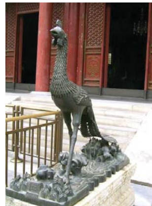
تصویر ۴- فنگ هوانگ (ققنوس چینی). کاخ تابستانی بیجینگ.

آن‌گونه که از قراین بر می‌آید، ققنوس از اساطیر چین و مصر به هنر و ادبیات فارسی راه یافته است. شباهت‌های زیادی بین سیمرغ سهروردی و ققنوس وجود دارد که احتمالاً به دلیل دادوستد میان این دو فرهنگ بوده است. اما آنچه مورد توجه است، آن است که، شباهت داستان‌های اسطوره‌ای سیمرغ و ققنوس در ادبیات فارسی بیش از شباهت آن‌ها در نقش‌مایه‌های ترسیم شده روی آثار مختلف هنری است. در جدول ۵، ویژگی‌های ققنوس به اجمال آورده شده است.