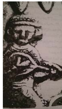
تصویر ۲۷- تنبورنواز، از تنگی زرین متعلق به دوران ساسانی (شهرنادر، ۱۳۷۶: ۶۴)

ساز دیگری که در ایران، سابقه‌ای بسیار قدیم دارد، تنبور است. این ساز، دو سیم داشته و مضرابی بوده که با انگشتان دست راست نواخته می شده و هم اکنون در کردستان معمول است. برخلاف عود که دسته کج دارد، دسته تنبور راست و بلند است؛ مانند تار پرده بندی می شود، کاسه آن از چوب است و دهانه آن، پوست ندارد و در نقاشی‌ها دیده می شود (تصویر ۲۷).