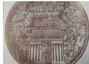
تصویر ۴۲- بشقاب سیمین زراندود با نقش محاصره سربازان قرن ۸-۱۰ م. موزه ارمیتاژ (راهگانی، ۱۳۷۷: ۱۴۷)

موسیقی مذهبی در این دوره رشد شایان توجهی داشته است. در رابطه با موسیقی نظامی، اهمیت نوازندگان موسیقی نظامی، به اندازه نگاهدارندگان درفش فرماندهی دانسته شده است. در نتیجه، تعدادی نوازنده موسیقی نظامی در واحد فرماندهی، مشغول به کار بودند. مهم‌ترین ساز نظامی شیپور بوده است. تاثیر موسیقی ساسانی تا قرن‌ها، بر کشورهای همجوار از ارمنستان تا عربستان بسیار مشهود است.