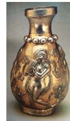
تصویر ۳۷- تنگ سیمین زراندود با نقش نوازنده موسیقار و قاشقک، ساسانی، گالری فریرر (آزاده فر، ۱۳۹۳: ۱۷۰)

چندین تنگ سیمین زراندود دوره ساسانی، در موزه هنرهای زیبای لیون و گالری فریرر نگهداری می‌شوند که، آلاتی چون موسیقار، قاشقک، فلوت دوتایی و بربط روی آن‌ها تصویر شده است (تصویر ۳۷).