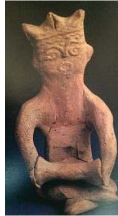
تصویر ۳۰- پیکرک سفالین مرد طبل زن، شوش، ساسانی، موزه ملی ایران (آزاده فر، ۱۳۹۳: ۱۷۱)

کشف شده- و در موزه ملی نگه‌داری می‌شود (تصویر ۳۰).