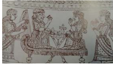
تصویر ۸- جام مفرغی با تصویر نوازندگان ۱۰۰۰-۱۲۰۰ ق.م. (همان: ۵۳)