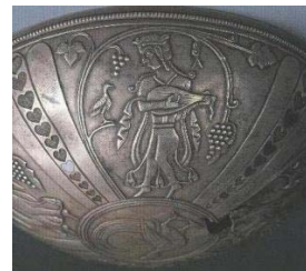
تصویر ۳۲- نوازنده موسیقار، جام نقره، کلاردشت، ساسانی، موزه ملی ایران. (گیرشمن، ۱۳۷۰: ۲۱۶)