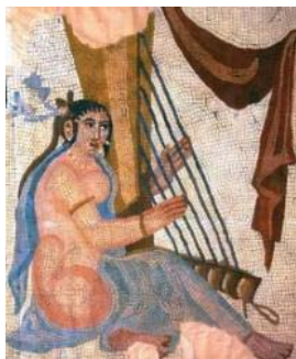
تصویر ۲۸- نقش نوازنده زن روی موزائیک، کاخ بیشاپور، نیمه دوم سده سوم میلادی (گیرشمن، ۱۳۷۰: ۲۵۷)

شرقی آن، نقوش زنانی به چشم می خورد که در آن میان، نقش زن نشسته چنگ نواز با پوششی نیمه عریان دیده می شود؛ به گفته گیرشمن، این نقوش، نمایانگر ضیافتی درباری است با حضور زنان درباری، نوازندگان و رقاصان. گیرشمن معتقد است، این تصویر، ضیافتی شاهانه در دربار ساسانی است و نباید آن را اسطوره‌ای قلمداد کرد. ولی با توجه به اینکه، اصل عریانی در فرهنگ‌های شرقی مختص مراسم و مضامین مذهبی و اسطوره‌ای است، این مساله، قابل تامل است. عریانی در آثار ایرانی مرسوم نبوده است؛ حضور با پای برهنه در این مراسم، بیانگر ورود به مکانی مقدس و اجرای آیینی است. این قطعه موزائیک - که در بیشاپور کشف شده- مربوط به نیمه دوم سده سوم میلادی است و اکنون در موزه لوور نگه داری می شود؛ تصویر زنی در حال نواختن چنگ را نشان می دهد. (تصویر ۲۸)، (رضایی نیا، ۱۳۸۲: ۱۰۶).