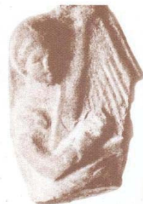
تصویر ۲۰ - پیکرک گلین زن چنگ نواز، سلوکی - اشکانی موزه ملی ایران. (میثمی، ۱۳۸۶: ۶۵)

سازهای زهی در دست دارند؛ مجموع این قطعات در موزه آرمتاژ نگهداری می‌شود. (ایازی، ۱۳۸۳: ۶۷) (تصویر ۱۴).