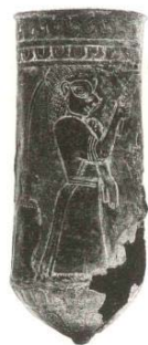
تصویر ۷- جام مفرغی با نقش زن چنگ نواز، هزاره اول ق. (ایازی، ۱۳۸۳: ۵۲)