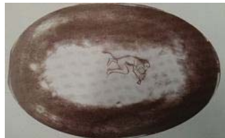
تصویر ۳۸- جام سیمین با نقش میمون نوازنده، موزه لوس آنجلس، ساسانی (ایازی، ۱۳۸۳: ۱۰۰)

نمونه آثاری که، مزین به نقش حیوانات نوازنده است، یک ظرف نقره بیضی در موزه لس آنجلس است. مربوط به ساسانیان قرن ۶ و ۷ میلادی، که یک میمون در حال نواختن فلوت است (تصویر ۳۸). یک ظرف سیمین از میمون‌های نوازنده- که یکی فلوت و دیگری طبل دوطرفه می‌نوازد- در موزه ارمیتاژ موجود است (تصویر ۳۹).