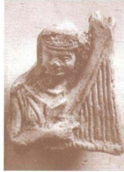
تصویر ۲۱- پیکرک گلین زن چنگ نواز، سلوکی- اشکانی، موزه لوور (ایازی، ۱۳۸۳: ۷۹)

چند پیکره دیگر موجود در موزه ملی، کامل نیستند. این پیکره‌ها نیز حاکی از چنگ نوازان زن هستند و چنگی مثلثی در آغوش دارند که همگی از شوش کشف شده‌اند. اغلب چنگ نوازان نقش برجسته‌ها و نقاشی‌های قدیمی، چنگ را روی زانوان خود نهاده‌اند، و در حال نشسته می‌نوازند. ولی در نمونه‌های پیکرک‌های شوش، زنان چنگ نواز همه ایستاده‌اند (تصویر ۲۲).