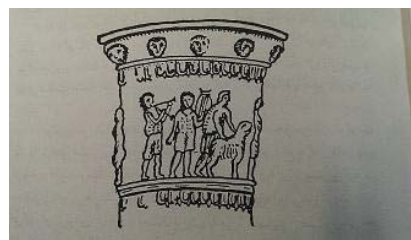
تصویر ۱۰- ساتگین مزین، سده دوم ق.م. اشکانیان، نسا (بینش، ۱۳۷۴: ۲۷)

گلین با نقش نوازندگان، اشاره کرد. بسیاری از یادگارهای تصویری موسیقی ایران، مربوط به این دوره است. در واقع، موسیقی تبدیل به اصیل‌ترین موضوع نقاشی در این دوره شده است. سازهای این دوره، امتداد منطقی سازهای سلوکیان و هخامنشیان است. تا آنجا که از متون موجود بر می‌آید، بیش‌تر، سازهای نظامی هستند. تفکیک موسیقی بزمی و رزمی، با توجه به فرهنگ ویژه جهان باستان تا حدی دشوار است. تنها چند ساز مخصوص (نی‌های مختلف)، آشکارا، ویژه موسیقی بزمی دیده می‌شود. انواع مختلف لیر یا همان چنگ امروزی را نیز می‌توان از این دست دانست (جوادی، ۱۳۸۰: ۲۳). از قدیم‌ترین محل استقرار اشکانیان در نسا ترکمنستان، جام شاخوار عاجی (ساتگین) ۱۰ مربوط به سده دوم ق.م. کشف شده است. نقش روی آن نشان می‌دهد که، گروهی با دو نوازنده - که یکی چنگ می‌نوازد و دیگری سازی بادی - به دنبال شکار روانند. (تصویر ۱۰). با توجه به این نقش معلوم می‌شود، موسیقی علاوه بر جشن‌ها و آیین‌های مذهبی در مراسم شکار هم، مرسوم بوده است.