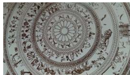
تصویر ۵- جام برنزی ارجان بهبهان، هزاره اول ق.م. (ایازی، ۱۳۸۳: ۲۳)

از نمونه‌های دیگر آلات موسیقی در ایران باستان، می‌توان به نقوش روی جام برنزی ارجان اشاره کرد. مقبره‌ای مربوط به هزاره اول ق.م. در ارجان بهبهان کشف شد که، گور یکی از پادشاهان یا حاکمان محلی عیلام نو، به نام (کیدین هوتران) ۳ ، بود. روی این جام، پنج ردیف نوار منقوش به شیوه کنده‌کاری حک شده است؛ نوار چهارم آن، مجلس بز می را تصویر کرده است که شش نفر مشغول نواختن هستند؛ یک تار زن، یک فلوت زن و سه چنگ نواز و یکی در حال نواختن دایره زنگی، همه در مقابل شخصی - شاید شاه یا حاکم محلی - مشغول اجرا هستند (تصویر ۵).