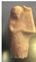
تصویر ۱۹ - زن چنگ نواز ایستاده با پیراهنی بلند، سلوکی - اشکانی، موزه ملی ایران (همان: ۷۸)