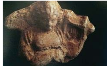
تصویر ۲۲- پیکرک نیم تنه زن چنگ نواز، شوش، سلوکی- اشکانی، موزه ملی ایران (آزاده فر، ۱۳۹۳: ۱۶۵)

چند پیکره دیگر موجود در موزه ملی، کامل نیستند. این پیکره‌ها نیز حاکی از چنگ نوازان زن هستند و چنگی مثلثی در آغوش دارند که همگی از شوش کشف شده‌اند. اغلب چنگ نوازان نقش برجسته‌ها و نقاشی‌های قدیمی، چنگ را روی زانوان خود نهاده‌اند، و در حال نشسته می‌نوازند. ولی در نمونه‌های پیکرک‌های شوش، زنان چنگ نواز همه ایستاده‌اند (تصویر ۲۲).