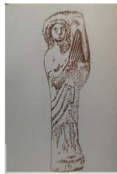
تصویر ۱۱- پیکرک ایستاده زنی چنگ نواز، سلوکی - پارتی (ایازی، ۱۳۸۳: ۷۱)

از ویرانه‌های شهر باستانی اوروک، ۲۵۰ کیلومتری جنوب شرقی بغداد، پیکرک‌های کوچک متعددی از نوازندگان به دست آمده است؛ یکی از آن‌ها، پیکرک