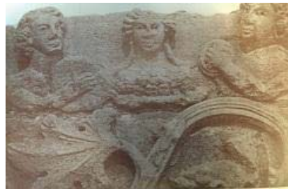
تصویر ۱۵ - فریز معماری با نقش نوازندگان هترا. (همان: ۷۵)

از آثار به دست آمده از هترا (الحضر) نزدیکی موصل - که امروزه خارج از مرز ایران است، ولی در آن زمان، تحت حکومت اشکانیان بود - یک فریز معماری به چشم می‌خورد که در آن، گروهی از نوازندگان زن و مرد، در حال نواختن دف، دایره زنگی و شیپور هستند (تصویر ۱۵).