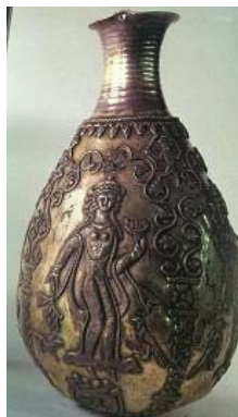
تصویر ۳۵- جام نقره با تصویر نوازندگان و رامشگران، کلاردشت، موزه ملی ایران. (ایازی، ۱۳۸۳: ۹۴)

جام نقره دیگری از کلاردشت کشف شده که، نوازندگان را مشغول نواختن برپط و نوعی ساز بادی نشان می‌دهد. و یکی از نوازندگان این جام نقره‌ای، حلقه‌ای در دست دارد که گویی، نوعی آلت موسیقی است (تصویر ۳۵).