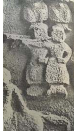
تصویر ۲۶- کرنا، طاق بستان، ساسانی (ملاح، ۱۳۷۶: ۵۷۵)

کرنا نیز از جمله سازهایی است که در طاق بستان، نقش آن به چشم می خورد (تصویر ۲۶). کرنا، سازی است بادی- که در میان سازهای بادی ابتدایی از بقیه بزرگ تر است- این ساز از سه بخش تشکیل شده است: اول محل دمیدن، دوم بدنه و سوم نفیر یا دهانه انتشار صوت است- که مانند سر عصار خمیده است- صدایش درشت و گوش خراش است. در روزگار قدیم، یکی از سازهای در خور اهمیت واحدهای نظامی بوده است.