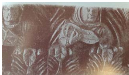
تصویر ۱۴- فریز معماری با گروه نوازی طبل و سازهای زهی و چنگ، قرن اول دوم میلادی، ایرتام، ازبکستان (ایازی، ۱۳۸۳: ۷۴)

یک نمونه از آثار دیگر این دوره - که مربوط به قرن اول و دوم میلادی هستند - در دهکده ایرتام واقع در ساحل شمالی آمودریا در نزدیکی ازبکستان است که یک فریز معماری، با نگاره بودایی از جنس سنگ آهک است. این حجاری، صحنه‌ای از یک بزم با تصاویر نیم تنه نوازندگان زن و مرد و تقدیم کنندگان هدایا را نشان می‌دهد و نوازندگان سازهایی شبیه طبل و