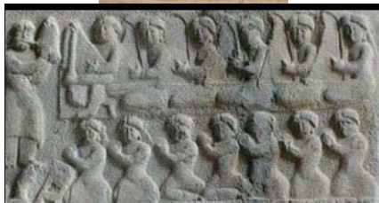
تصویر ۲۴- منظره شکار با تصاویر نوازندگان، طاق بستان، کرمانشاه (پوپ و اکرم، ۱۳۸۷: ۱۶۳)