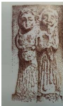
تصویر ۱۳- پیکره های گلین دو نوازنده دف و ساز بادی سلوکی - پارتی. (آزاده فر، ۱۳۹۳: ۱۶۴)