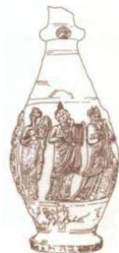
تصویر ۲۹- گلدان نقره با نقش نوازندگان ساسانی، ساجا، روسیه (ایازی، ۱۳۸۳: ۹۰)

یک گلدان نقره از ناحیه ساجا در روسیه، کشف شده که، تصویر چند نوازنده با ساز، روی آن حک شده است (تصویر ۲۹). از دیگر آثار موسیقی ساسانی، پیکرک گلین مردی در حال نواختن تبیره است - که از شوش