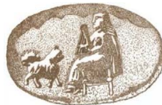
تصویر ۹- مهر سنگی با نقش زن پارسی در حال نواختن چنگ، هخامنشی، موزه بوستون (آزاده فر، ۱۳۹۳: ۱۶۲)

مداوم، موسیقی به سازمان‌های حکومتی راه یافت. بنابراین، سازهایی چون کوس، دهل، کرنا، شیپور، سرنا و دیگر آلات موسیقی جنگی رواج یافتند. بر این اساس، موسیقی جنگی و سرودهای رزمی شکل گرفت و از سازهایی چون شیپور و طبل استفاده شد. ویل دورانت درباره موسیقی عهد هخامنشی می‌گوید: آواز خواندن و رقصیدن را دوست داشتند و از نواختن چنگ، نی، طبل و دف، لذت می‌بردند (دورانت، ۱۳۷۷: ۴۳۷). سازه‌های مرسوم دوره هخامنشی عود، چنگ، نی، نوعی ارغنون (ساز دهنی)، چغانه (نوعی قاشقک) و سازه‌های نظامی شیپور، نقره، دهل، گاودم، جام، ججل، تبیر یا تبیره (نوعی طبل) کرنا و سرنا بودند (راهگانی، ۱۳۷۷: ۶۳). یکی از جالب‌ترین آثار بازمانده از دوره هخامنشی، کرنا فلزی طویل و بزرگی است که، اکنون در موزه تخت جمشید فارس نگهداری می‌شود. این اثر - که از بالای سر آرامگاه اردشیر سوم در تخت جمشید یافته شد - می‌تواند نماد عظمت ایران و گسترش موسیقی رزمی آن دوره باشد. در موزه ایران باستان تهران، نمونه‌هایی شبیه سنج وجود دارد - که ظاهراً در مراسم مذهبی استفاده می‌شده است - و روی یکی از آن‌ها نگاره انار (نماد آناهیتا) و چهار گاو (نماد میترا) دیده می‌شود (بینش، ۱۳۷۴: ۲۵). اثر دیگر، سازی شبیه به چنگ، متعلق به اقوام سکایی در گنجینه پازیریک است که، در موزه ارمنستان نگهداری می‌شود. در گورهای دیگر، تنها طبل دیده شده، که علاوه بر نواختن آهنگ، به منظور ترساندن ارواح خبیثه نیز به کار می‌رفته است. یک نمونه دیگر، چنگ مربوط به این دوره را می‌توان در یک مهر بیضی شکل از سنگ یمانی موجود در موزه بوستون ملاحظه کرد؛ یک زن پارسی را به حالت نیمرخ نشسته، در حال چنگ نواختن، نشان می‌دهد (ایازی، ۱۳۸۳: ۵۹) (تصویر ۹).