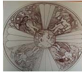
تصویر ۳۶- تنگ نقره مطلا با تصویر چهار رامشگر، کلاردشت، موزه ملی ایران. (جوادی، ۱۳۸۰: ۱۲۶)

دیگری، تنگ نقره مطلا است که چهار رامشگر را نشان می‌دهد که در چهار جانب بالای ظرف، چهار نقش کوچک طراحی شده است؛ دو نقش به حالت بازی با طناب، و دو دیگر در حال نواختن بربط (ایازی، ۱۳۸۳: ۹۵) (تصویر ۳۶).