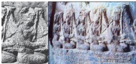
تصویر ۲۵- تصویر چنگ نوازان، سنگ نگاره طاق بستان، ساسانی (راهگانی، ۱۳۷۷: ۱۴۸)