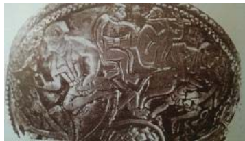
تصویر ۳۹- جام سیمین زراندود با نقش میمون‌های نوازنده، موزه ارمیتاژ (همان: ۱۰۱)

از دوره ساسانی، مهرهای زیادی کشف شده که، منقوش به نقش رامشگران است. در آن‌ها، هم نقش میمون و هم انسان در حال نواختن ساز مشاهده می‌شود که نشانگر قوت موسیقی در این دوران است. در موزه ارمیتاژ، ظروف نقره دیگری با نقش نوازندگان وجود دارد. یکی از آن‌ها، بشقاب نقره‌ای است که شاه را نشسته بر تخت، نشان می‌دهد که، نوازندگان مقابل او در حال نواختن نای و چنگ هستند (تصویر ۴۰).