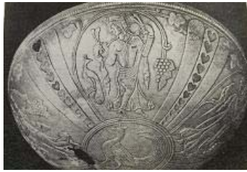
تصویر ۳۳- نوازنده سرنا، جام نقره، کلاردشت، ساسانی، موزه ملی ایران (راهگانی، ۱۳۷۷: ۱۴۳)

دو نوازنده دیگر همان جام، یکی سورنای می‌نوازد (تصویر ۳۳) و دیگری نوازنده چغانه است (تصویر ۳۴). سرنا، از خانواده سازهای بادی است. چغانه، سازی است هم از خانواده سازهای ضربی و هم رشته‌ای. کهن‌ترین نقشی که از این ساز، بر جای مانده، همین جام نقره‌ای دوره ساسانی است زنی را نشان می‌دهد که در حال پایکوبی، چغانه‌ای در دست دارد.