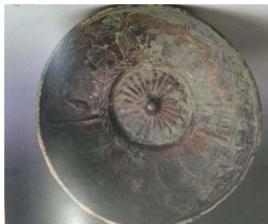
تصویر ۶- جام مفرغی با تصویر نوازنده، لرستان قرن ۹ ق.م. کاخ لیون (پوپ و اکرم، ۱۳۸۷: ۷۲)

طی حفریاتی در لرستان، جامی مفرغی کشف شد که، تصویر مردی در حال نواختن سازی شبیه به تنبور در آن مشاهده می‌شود (تصویر ۶). تصویر مربوط به قرن نهم ق.م. است و در کاخ هنر لیون نگهداری می‌شود. سازی که در تصویر مشاهده می‌شود، شبیه ساز محلی مراسم مذهبی اهل حق، به نام تمیره، است که در کنار کمانچه، نی، سرنا، دهل، تنبک و دوزله در لرستان رایج است (ایازی، ۱۳۸۳: ۴۵). روی جام مفرغی دیگری در این محل، تصویر زنی در حال نواختن چنگ مشاهده می‌شود (تصویر ۷). از دیگر آثار مربوط به لرستان، ظرفی است مربوط به ۱۰۰۰-۱۲۰۰ ق.م. نقش آن، یک ردیف نوازندگان را در یک بزم نشان می‌دهد که، هر یک، سازی مانند دایره، چنگ، دونای یا نای مضاعف می‌نوازد (تصویر ۸).