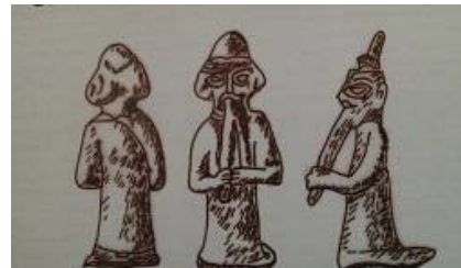
تصویر ۲۳- پیکرک مفرغی مرد نوازنده، مسجد سلیمان، سلوکی- اشکانی (ایازی، ۱۳۸۳: ۸۳)

چنگ ایستاده یا زاخال - که بعدها به عنوان چنگ ایرانی شناخته شد- در قرون وسطی به سوی مناطق شمالی کرانه اقیانوس آرام برده شد. پروفیسور گیرشمن، در مسجد سلیمان پیکرک مردی را کشف کرد که دونای یا نای مضاعف می‌نوازد. این پیکرک در قسمت بالای یک مهر قرار گرفته است (تصویر ۲۳).