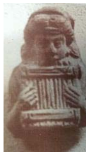
تصویر ۱۷ - پیکرک گلین زن نوازنده سیرنکس، شوش، اشکانی، موزه لوور. (ایازی، ۱۳۸۳: ۷۶)

اثر دیگر، تصویر نیم تنه سنگی، پان خدای موسیقی را نشان می‌دهد که، در ساز نه دهانه می‌دمد (تصویر ۱۶). در یونان، به این ساز سیرنکس ۷ می‌گویند. همین ساز، در دست پیکرک گلین زنی در شوش نیز کشف شده است، که در موزه لوور نگهداری می‌شود (تصویر ۱۷). استمرار این ساز را در دوره ساسانی، روی بعضی ظروف نقره‌ای شاهدیم.