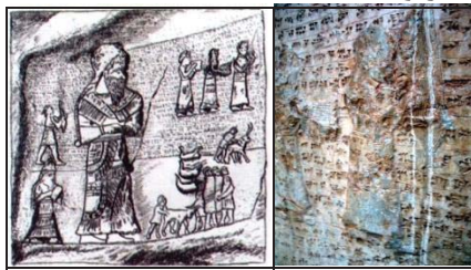
تصویر ۲ و ۳- نقش برجسته عیلامی کول فره یا فرعون)، ایزه ۲۷۰۰ ق.م. (صراف، ۱۳۷۲: ۸۸)

دست می‌یابیم. فارمر، موسیقی شناس برجسته انگلیسی، می‌گوید: نخستین نقش برجسته که دارای تصاویر سازهای موسیقی است، نقش برجسته عیلامی، کول فره (یا فرعون) است، که در آن، کاهنان در حال اهدای قربانی هستند و با سه موسیقیدان همراه می‌شوند که، مشغول نواختن دایره و ون‌هایی دارای جعبه طنین بالا و پایین هستند. ون‌ها (سازهایی از خانواده چنگ هستند) (تصویر ۳ و ۳). شبیه به نمونه‌های یافت شده در نقش برجسته‌های آشور بانیپال است که در موزه بریتانیا قرار دارند (پوپ و اکرم، ۱۳۸۷: ۳۲ و ۳۸). از دیگر سازهای مکشوفه شوش - که در تمام دوران‌ها مورد توجه بوده، به‌ویژه در آیین‌های دینی ایرانیان - تنبور است. نگاره‌ای، متعلق به ۱۵۰۰ ق.م، در شوش، تنبورزی را نشان می‌دهد که، نقش انسان دیگری - به اندازه کودکی - را روی شانه راست خود دارد... بی‌گمان نشانه‌ای از یک اعتقاد، یا افسانه یا آیین ویژه است و رمزی را بازگو می‌کند. وگرنه، چنان نیست که، هیچ تنبورزی در هنگام نوازندگی، کسی را بردوش خویش بگذارد (جنیدی، ۱۳۷۲: ۱۱۴) (تصویر ۴). پاهای نوازنده از هم باز، و از قسمت زانو، شکسته است.