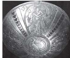
تصویر ۳۱- زن برپط نواز، جام نقره، کلاردشت، ساسانی، موزه ملی ایران، (سامی، ۱۳۸۸: ۱۸۹)

از دیگر آثار مهم دوره ساسانی، اشیاء نقره است؛ روی برخی از آن‌ها شواهدی - که نمایانگر شکوفایی موسیقی در این دوره است- به چشم می‌خورد. جام نقره‌ای که، از ناحیه کلاردشت مازندران کشف شده و در موزه ملی نگهداری می‌شود، نقش برجسته چهار زن نوازنده را نشان می‌دهد که، یکی از آن‌ها در حال نواختن برپط یا (عود) است (تصویر ۳۱). به روایتی، خاستگاه این ساز، ایران بوده است و «رود» نامیده می‌شد. نوازنده دیگر در حال نواختن موسیقار ۱۰ است - که این ساز در اروپا فلوت «پان» نامیده می‌شود- و امروزه به ساز دهنی معروف است (تصویر ۳۲).