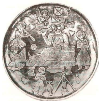
تصویر ۴۰- نوازندگان روی بشقاب نقره، ساسانی، موزه ارمیتاژ (سپنتا، ۱۳۸۲: ۳۵)

از دوره ساسانی، مهرهای زیادی کشف شده که، منقوش به نقش رامشگران است. در آن‌ها، هم نقش میمون و هم انسان در حال نواختن ساز مشاهده می‌شود که نشانگر قوت موسیقی در این دوران است. در موزه ارمیتاژ، ظروف نقره دیگری با نقش نوازندگان وجود دارد. یکی از آن‌ها، بشقاب نقره‌ای است که شاه را نشسته بر تخت، نشان می‌دهد که، نوازندگان مقابل او در حال نواختن نای و چنگ هستند (تصویر ۴۰).