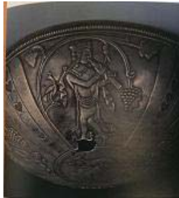
تصویر ۳۴- نوازنده چغانه، کلاردشت، ساسانی، موزه ملی ایران (سامی، ۱۳۸۸: ۱۸)

از دیگر آثار مهم دوره ساسانی، اشیاء نقره است؛ روی برخی از آن‌ها شواهدی - که نمایانگر شکوفایی موسیقی در این دوره است- به چشم می‌خورد. جام نقره‌ای که، از ناحیه کلاردشت مازندران کشف شده و در موزه ملی نگهداری می‌شود، نقش برجسته چهار زن نوازنده را نشان می‌دهد که، یکی از آن‌ها در حال نواختن برپط یا (عود) است (تصویر ۳۱). به روایتی، خاستگاه این ساز، ایران بوده است و «رود» نامیده می‌شد. نوازنده دیگر در حال نواختن موسیقار ۱۰ است - که این ساز در اروپا فلوت «پان» نامیده می‌شود- و امروزه به ساز دهنی معروف است (تصویر ۳۲).