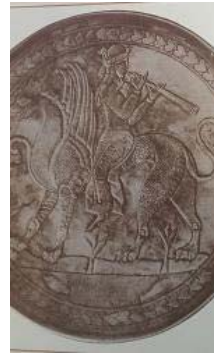
تصویر ۴۱- بشقاب نقره با نقش الهه نی نواز سوار بر حیوان افسانه‌ای، قرن ۶-۸ م. موزه ارمیتاژ (پوپ و اکرمین، ۱۳۸۷: ۲۳۳)

بشقاب نقره‌ای دیگر این موزه، متعلق به قرن ۶-۸ م.، نقش الهه نی نواز سوار بر حیوان افسانه‌ای را نشان می‌دهد (تصویر ۴۱). بشقاب زراندود سوم، مربوط به قرن ۸-۱۰ م.، تصویر دژی را در محاصره سربازان نشان می‌دهد که، در این نقش، نوازندگان در حال نواختن شیپور و کرنا هستند (تصویر ۴۲).