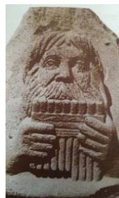
تصویر ۱۶ - نیم تنه سنگی پان خدای موسیقی، قرن دوم میلادی، هترا (میثمی، ۱۳۸۶: ۸۰)

اثر دیگر، تصویر نیم تنه سنگی، پان خدای موسیقی را نشان می‌دهد که، در ساز نه دهانه می‌دمد (تصویر ۱۶). در یونان، به این ساز سیرنکس ۷ می‌گویند. همین ساز، در دست پیکرک گلین زنی در شوش نیز کشف شده است، که در موزه لوور نگهداری می‌شود (تصویر ۱۷). استمرار این ساز را در دوره ساسانی، روی بعضی ظروف نقره‌ای شاهدیم.