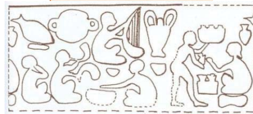
تصویر ۱. مهر چغامیش، ۳۳۰۰ تمدن عیلام - ۳۱۰۰ ق.م (سپنتا، ۱۳۸۲: ۲۱)

جورج فارمر می‌گوید: پاندورا، همان عود دسته بلند است که در ایران تنبور می‌نامند؛ و این کلمه، ترکیبی است از دنبه بره، و به علت شباهتی است که، تنبور به دنبه بره دارد. و می‌افزاید تنبور، پیش از ظهور اسلام - هنگامی که ایران بر بین‌النهرین فرمانروایی داشت - وجود داشت؛ یعنی در این عهد، تنبور و بریط و چنگ