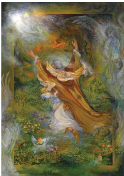
تصویر ۱- ابراهیم نبی، محمود فرشچیان

صداقت، وفاداری و اراده‌ای که در وجود حضرت ابراهیم(ع) و سیاوش متجلی شده، آن‌ها را به نمادهای خیر تبدیل کرده است. در مقابل، انعکاس ردایی نظیر شرک، بی‌اعتمادی، سرپیچی، ناپاکی، کفر، بی‌خردی، کینه، زشتی، دروغ‌گویی، خیانت و سستی اراده در نمرود و سودابه، از آن‌ها سمبل‌های شر ساخته است. در بین خیرهای اخلاقی، اراده از جایگاه ویژه‌ای برخوردار است و می‌توان گفت، محور اصلی دیگر صفات اخلاقی است. فارابی معتقد است: رسیدن به سعادت غایی یعنی تجرد از ماده با افعال ارادی ممکن است- که برخی فکری و بدنی است- اما نه با هر گونه فعلی؛ بلکه با افعال معینی که از ملکات دینی سرچشمه گرفته باشد (گنجی، ۱۳۸۶: ۱۳۹). در سیر داستان حضرت ابراهیم(ع) و سیاوش نیز اراده نقش تأثیر گذاری دارد (جدول شماره ۱).