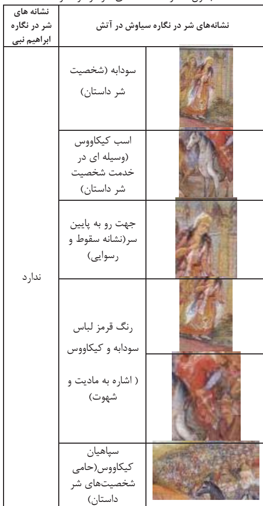
جدول شماره ۴: نشانه‌های شر در دو نگاره

تزیینات و زرق و برقی که روی لباس و کلاه او شاید نشان از طبقه اجتماعی او باشد. اما رنگ قرمز لباس کیکاووس با توجه به سیر داستان و معنای نمادین این رنگ، نشانه شر است. «رنگ قرمز از نظر سمبلیک مانند خونی است که به هنگام فتح و پیروزی ریخته می‌شود. آتشی را در روح آدمی شعله ور می‌کند و ادراک حسی آن به صورت میل و اشتها می‌باشد» (لوشر، ۱۳۸۸: ۸۴)