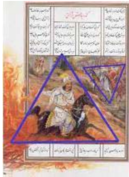
تصویر ۳. تحلیل نماد های تصویری خیر و شر. نگارنده

داخل مثلثی قرار می‌گیرد، که رأس آن به سمت بالا است. اما کیکاووس، درون مثلثی با رأس رو به پایین جای دارد؛ همین اشاره‌ای ظریف از رویارویی خیر و شر است (تصویر ۳).