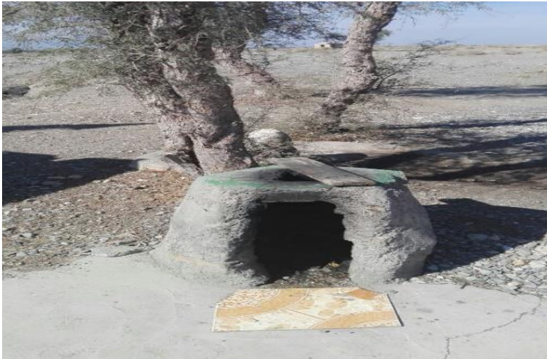
تصویر ۵. جایگاه روشن کردن آتش در بیرون قدمگاه