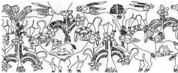
تصویر ۱. سه نقش مایه درخت و حیوان بر روی ظروف تمدن حوزه هلیل‌رود، هزاره سوم قبل از میلاد (طرح از یوسف مجیدزاده)

همچنان که در تصویر شماره یک مشاهده می‌شود، بر بعضی از ظروف موزه باستان‌شناسی جیرفت نقش درخت نخل و سایر درختان به همراه حیوانات از جمله شیر و بز نقش بسته است. ۱۰ درصد از نقوش ظروف تمدن حوزه هلیل‌رود را نقوش نباتی و ۱۲