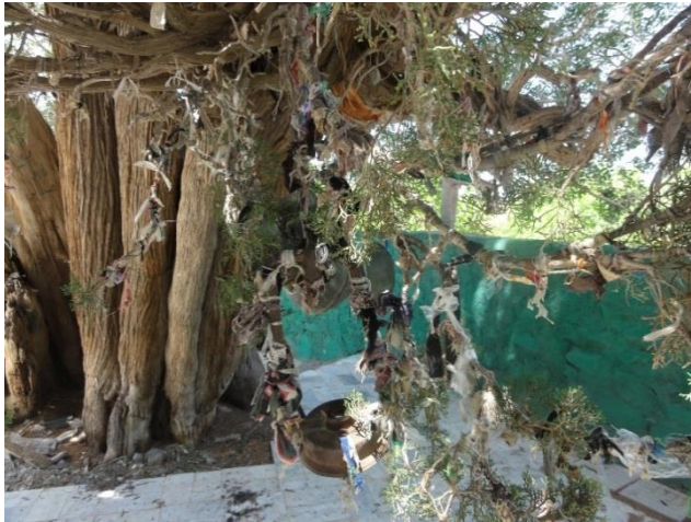
تصویر ۳. درختی در قدمگاه که به آن پارچه‌های رنگی بسته شده است