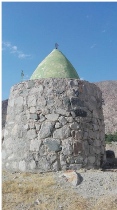
تصویر ۴. قدمگاه به فرم ماندالا

شده‌اند (تصویر ۴). هر بنای مذهبی یا غیرمذهبی که بر مبنای طرح ماندالا ساخته شده، فرافکنی تصویر کهن‌الگویی از ناخودآگاه، به جهان خارج است. شهر، قلعه و یا معبد هر کدام نماد وحدت روانی می‌شوند و بدین‌سان بر روی افرادی که وارد آنها می‌شوند و یا در آنها زندگی می‌کنند تأثیری خاص می‌گذارد (یونگ، ۱۳۷۸: ۳۷۱). قدمگاه، زیارتگاه و نظرگاه به عنوان مکان‌های مقدس در بیشتر موارد بر فراز بلندی کوه و تپه، یا در مکانی نزدیک به کوه بنا شده‌اند و دلیل آن این است که این‌گونه فضاها در مرکز توجه و جهان‌بینی قرار بگیرند و از این منظر به‌عنوان مکان وحی، شهود، تجلی‌گاه الوهیت و نماد قدرت به شمار بروند (Mei. 1986, Vol 14: 130-132). فضای زیارتگاه‌های این حوزه، معنوی و اثرگذار هستند به گونه‌ای که هنگامی که فرد عامی وارد این مکان می‌شود زندگی مادی را فراموش می‌کند و با ذکر دعا و نیایش به یک وحدت درونی می‌رسد. خادم زیارتگاه یا (شیخ) پس از نظافت، در محراب زیارتگاه چراغ یا شمع روشن می‌کند و با خواندن دعا شرایط را برای فرو رفتن در اندیشه ژرف مهیا می‌کند. این امر سبب دگرگونی شخصیت فردی مطابق با نظریه فرایند فردیت یونگ می‌شود.