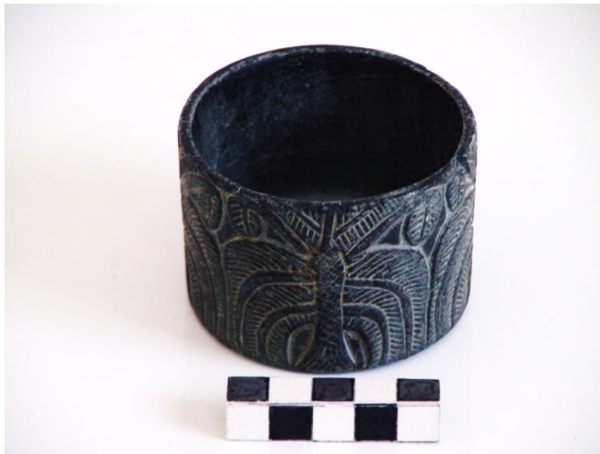
تصویر ۲. ظرف گُلمیتی منقوش به درخت نخل، یافت شده از حوزه فرهنگی هلیل‌رود (موزه باستان‌شناسی جیرفت)

درصد را نقوش گیاهی تشکیل داده‌اند که حاکی از احترام به گیاهان و درختان در باور مردمان حوزه هلیل‌رود است (Basafa and Mohammad Hosein Rezaei, 2014). به نظر می‌رسد که احترام به درخت و به‌خصوص درخت نخل برای مردم حوزه هلیل‌رود از نوع احترام به درخت زندگی در میان‌رودان باشد. زیرا در منطقه میان‌رودان برخی درختان به دلیل طول عمر و زیبایی، سودمند و مقدس هستند. از جمله این درختان می‌توان به درخت سدر، تاک، انار و نخل اشاره کرد. همچون حوزه هلیل، درخت نخل در میان‌رودان نیز غالباً بین دو محافظ با هیبت شیر ترسیم شده است (هینلز، ۱۳۸۳: ۴۶۱).