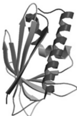
شکل ۲: آلرژن اصلی درخت گان ۱ Bet v متعلق به خانواده پروتئین‌های وابسته به پاتوژن (PR-10) Ivanciuc et al., (2003)

امروزه از تکنیک‌های دیگری مانند NMR و بررسی ساختار با اشعه X در ارزیابی ساختار آلرژن‌ها و کمک به بیوانفورماتیک جهت دستیابی به نتایج دقیق‌تر در پیش‌گویی آلرژنیسته استفاده می‌شود. شکل ۳ نشان دهنده ۹ آلرژن که بوسیله NMR تعیین شده و دارای بیشترین فراوانی در پایگاه داده Pfam (خانواده پروتئینی) هستند، است (C. H. Schein et al., (2010). الگوریتم‌های معمول مقایسه توالی‌ها در پایگاه‌های داده آلرژن‌ها FASTA Pear- (Altschul et al., (2000) و son, (1997) هستند. روش‌های محاسباتی برای شناسایی اپی‌توپ‌های سلول‌های T و B به درک بهتر واکنش‌های کامل آلرژیک کمک می‌کند. روش‌های اولیه بیوانفورماتیک برای شناسایی اپی‌توپ‌های بالقوه سلول B از توالی و خواص آمینواسیدی (مانند آب دوستی) و پایین بودن دقت استفاده می‌کنند. روش‌های خیلی جدیدتر از مدل‌سازی ساختار سه بعدی علاوه بر استراتژی‌های اولیه استفاده می‌کنند (Valenta & Kraft, (2001). با رشد انفجاری اطلاعات مربوط به آلرژی از طریق ژنومیکس عملکردی (Saito et al., (2001)، میکرواری (Harwanegg et al., (2003) و پروتئومیکس (Yu et al., (2002)، بیوانفورماتیک به یک ابزار ضروری و کاربردی برای مدیریت داده‌های آلرژیک، تفسیر نتایج و طرح‌های تجربی تبدیل شده است. ابزارهای مقایسه توالی در تعیین آلرژیک‌زایی و واکنش‌های متقابل آلرژیک معمولاً ضروری‌اند (Gendel, (2002). آنالیز توالی موتیف به عنوان یک روش مهم برای تعیین واکنش‌های متقابل آلرژیک در آلرژن‌های با تشابه کم در حال