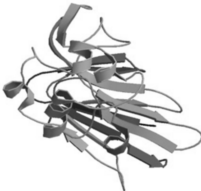
شکل ۴: ساختار سه بعدی پروتئین اسموتین (ژن AP24) با کد ۱PCV از پایگاه داده PDB

شود. اسموتین یک پروتئین چندکاره پاسخ دهنده به استرس است که موجب تحمل گیاهان نسبت به فشارهای اسمزی می شود. اسموتین از طریق تحریک تجمع پرولین و افزایش پایداری باعث مقاومت گیاه در برابر استرس های زیستی و غیر زیستی می شود. این پروتئین عضوی از خانواده پروتئینی PRP بوده و در حفاظت گیاهان در برابر عوامل بیماری زا نقش ایفا می کند. در این بخش بررسی آلرژن زایی پروتئین اسموتین (ژن AP24) بعنوان نمونه جهت استفاده از پایگاه های داده آلرژن انجام شد.