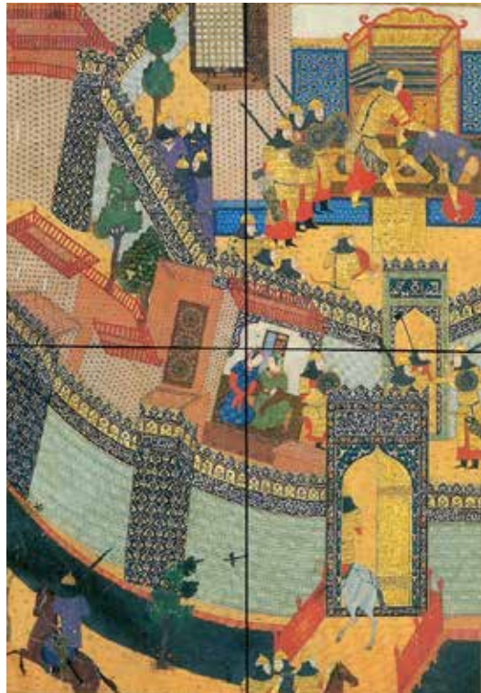
تصویر ۵- تقسیم کادر از طریق رسم محورهای عمودی و افقی.

نحوه نمایش عناصری چون دیوارها، درختان، انسان‌ها، زمین، فرش‌ها و حتی سقف اتاق‌ها به‌گونه‌ای است که همه‌گی قابل مشاهده بوده و حاکی از عدم رعایت اصول ژرف‌نمایی و لحاظ نمودن ترسیم سه‌نما در طراحی دارد که این مسئله آگاهانه و طبق قواعد جاری در نگارگری ایرانی است.