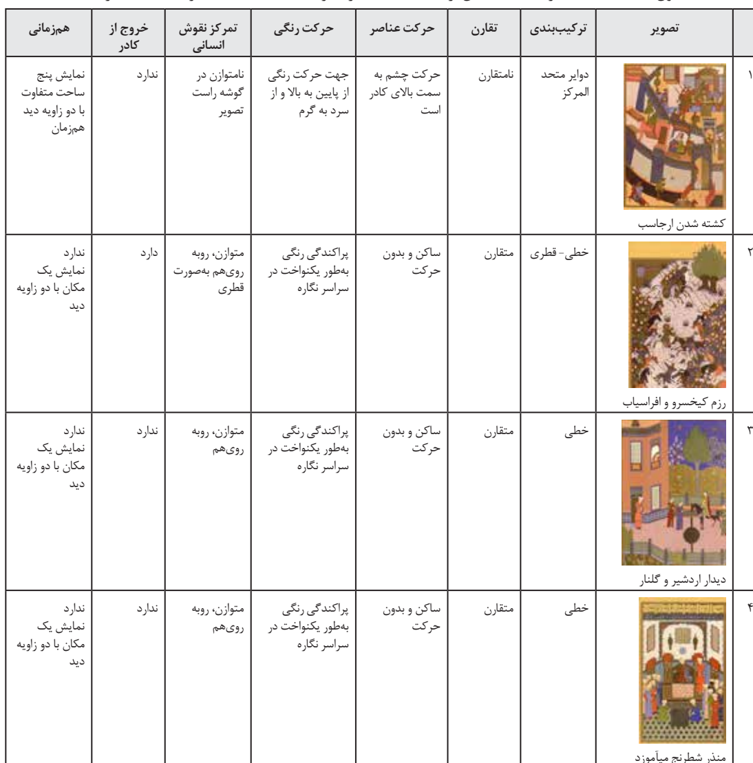
جدول ۵- مقایسه‌ی نگاره «کشته شدن ارجاسب...» با سایر نگاره‌های شاهنامه بایسنقری (مأخذ: نگارنده)

مشاهده نمی‌شود و عناصر در حالت سکون قرار دارند؛ حتی در نگاره‌هایی مانند رزم کیخسرو و افراسیاب (تصویر ۹) که موضوع آن نبرد است نیز حرکت و جنبشی دیده نمی‌شود. خروج عناصر ترکیب‌بندی از کادر نگاره با وجود کثرت سوژه‌ها و ورود نوشتار به داخل کادر در نگاره کشته شدن ارجاسب در روئین دژ، دیده نمی‌شود؛ ولی در اغلب نگاره‌های شاهنامه بایسنقری این اتفاق مشهود است. در نگاره کشته‌شدن ارجاسب در روئین دژ، نگارگر پنج فضای متفاوت را هم‌زمان از دو زاویه دیده است در حالی که نگاره‌های دیگر شاهنامه بایسنقری یک فضا از دو زاویه دیده‌شده است که این امر از بارزترین تفاوت‌های نگاره موردنظر با سایر نگاره‌های شاهنامه بایسنقری است.