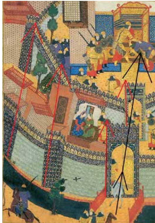
تصویر ۲- جهت قرار گرفتن دروازه‌ها و برج‌ها.

فعل «معنا شده است. در نظر ارسطو حرکت از هر قسم که باشد از جهت نقص و برای رسیدن به کمال است؛ بنابراین حرکت جاری در این نگاره با ماهیت داستان و کارکرد سوژه‌ها تطابق دارد. همچنین حرکت و جهت خود دارای حالات متفاوت و معانی مختلف است. خط دورانی دارای حرکتی صعودی و یا نزولی است، این حرکت میل به کمال‌گرایی دارد؛ اما خط مستقیم اشاره بر تغییر وضعیت داشته و در مقایسه با حرکت خط دورانی کمال‌گرا نیست. در این نگاره شخصیت‌ها و موضوعات اصلی بر روی خطوط حلزونی متحدالمرکز با جهت بالارونده از پایین به بالا چیده شده‌اند، فشردگی نقوش انسانی در بالای تصویر و جهت حرکت چشم از پایین به بالا و همچنین خطوط عمودی دیوارها و برج‌های دژ که خطوط غالب در ترکیب‌بندی این نگاره هستند کمک به تأکید بر موضوع اصلی نگاره دارد. (تصویر ۱) همین تأکید را در (تصویر ۲)، بر روی جهت قرارگیری دروازه‌ها نیز می‌توان مشاهده کرد.