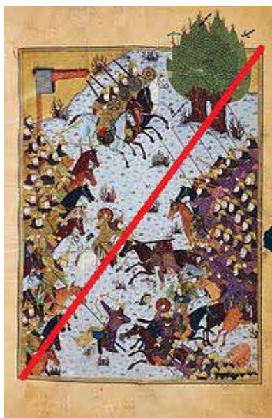
تصویر ۹- رزم کیخسرو و افراسیاب.