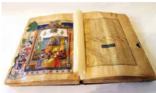
تصویر ۷- تصویری از شاهنامه بایسنقری

- نگاره کشته شدن ارجاسب در روپین دژ سراسر حرکت و جنبش است در حالی که نگاره‌های دیدار اردشیر و گلنار (تصویر ۱۰) و آموزش شطرنج (تصویر ۸) و همچنین سایر نگاره‌ها که به تفصیل در جدول زیر آمده است، متناسب با ویژگی‌های مکتب هرات، سراسر نگاره از آرامش و وقار برخوردار است. غلبه نقوش معماری بر طبیعت‌گرایی، استفاده از نقوش هندسی در آرایش بنا و توجه به جزئیات دیده می‌شود؛ ولی هیچ‌گونه حرکت و پویایی در این نگاره‌ها