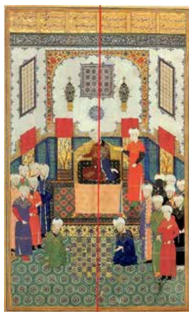
تصویر ۸- منذر شطرنج را در بارگاه انوشیروان می‌آموزد.