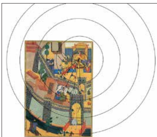
تصویر ۱- جهت حرکت چشم بر روی چرخش دایره‌ای.

نگهبانی بیرون دژ، دسته دوم در کنار خواهران خود و برای محافظت از آن‌ها و دسته سوم به همراه اسفندیار برای کشتن ارجاسب، وارد حیاط مرکزی شده‌اند. آنان درحالی که سپاه ارجاسب در سرمستی به سر می‌بردند، وی را از تخت پایین کشیده و اسفندیار سر از تن او جدا کرده و خواهرانش را آزاد می‌کند.