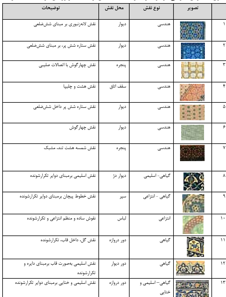
جدول ۲- نقوش انتزاعی موجود در نگاره «کشته شدن ارجاسب در روپین دژ» (مأخذ: نگارنده)

جالب آنکه مفاهیم حیات و جاودانگی و رهایی، از مفاهیم اساسی منطبق با اهداف داستان هستند که نگارگر بدین طریق آن را به نمایش درآورده است.