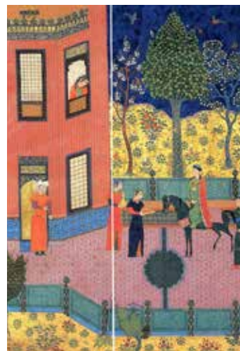
تصویر ۱۰- دیدار اردشیر و گلنار.

مشاهده نمی‌شود و عناصر در حالت سکون قرار دارند؛ حتی در نگاره‌هایی مانند رزم کیخسرو و افراسیاب (تصویر ۹) که موضوع آن نبرد است نیز حرکت و جنبشی دیده نمی‌شود. خروج عناصر ترکیب‌بندی از کادر نگاره با وجود کثرت سوژه‌ها و ورود نوشتار به داخل کادر در نگاره کشته شدن ارجاسب در روئین دژ، دیده نمی‌شود؛ ولی در اغلب نگاره‌های شاهنامه بایسنقری این اتفاق مشهود است. در نگاره کشته‌شدن ارجاسب در روئین دژ، نگارگر پنج فضای متفاوت را هم‌زمان از دو زاویه دیده است در حالی که نگاره‌های دیگر شاهنامه بایسنقری یک فضا از دو زاویه دیده‌شده است که این امر از بارزترین تفاوت‌های نگاره موردنظر با سایر نگاره‌های شاهنامه بایسنقری است.