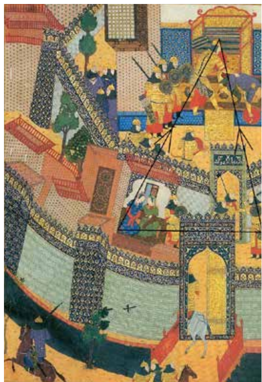
تصویر ۳- نحوه قرارگیری سپاه اسفندیار.

کلیه عناصر تصویر در سه سطح متفاوت و هر سطح در چند بخش چیده شده و همان‌طور که در (تصویر ۴) دیده می‌شود، نگارگر تمامی این عناصر و بخش‌ها را از زوایای مختلف؛ ولی به صورت هم‌زمان، نمایش داده است.