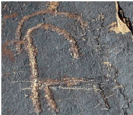
تصویر ۳- سنگ‌نگاره بز کوهی یافت شده در سرکوبه خمین متعلق به دوران نوسنگی. مأخذ: (ناصری فرد، ۱۳۸۸: ۱۲).

از بدو خلقت همواره هنرمند با خلق اثر تلاش کرده است یک ارتباط بصری با دنیای اطراف و بیننده برقرار نموده و پیغامی را به مخاطب ارسال نماید. در طول زمان نوع و کیفیت این ارتباط بصری تغییر نموده و ارزش‌های فرهنگی، اعتقادی را نیز در بر گرفته است، بصورتیکه هنر تجلی بارز فرهنگ هر قوم و ملتی شده است. تولستوی بیان می‌دارد که هنر عالی‌ترین تجلیات تصور خدا، زیبایی و لذت روحی و معنوی است.