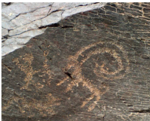
تصویر ۴- سنگ‌نگاره بز کوهی یافت شده در گلپایگان، مأخذ: (جمالی، ۱۳۹۴، تصویر شماره ۵۶ صفحه ۲۵۶).

دوران نوسنگی ۷ (۷۵۰۰-۵۰۰۰ ق.م) دارای دستاوردهای شامل گسترش کشاورزی (تولید گندم و جو) و اهلی کردن حیواناتی شامل بز، میش، گوسفند و اسب، اختراع چرخ و قایق، تکنیک کار با سفال، آشنایی با بافت البسه و ریسندگی، ایجاد واحدهای اجتماعی نظیر روستاها با نظام‌های مشارکتی ساده، نهادینه شدن برخی باورهای آیینی و اعتقادی، بوده است. شکل‌گیری حرفه‌هایی نظیر، دام‌پروری، کشاورزی، ریسندگی، شکار و سفالگری را می‌توان در این دوران دید. فرایند مهاجرت نیز در