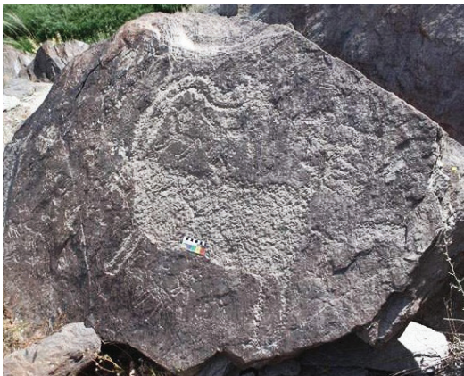
تصویر ۲- نقش بز کوهی با شاخ‌های موج‌دار بر سنگ‌نگاره بازمانده از ۷۰۰۰ سال پیش از میلاد (نوسنگی)، یافت شده در تیمره خمین (۱۱۴×۱۲۳ سانتی‌متر)، موج‌دار بودن شاخ بیان‌کننده نماد آب و جریان است.