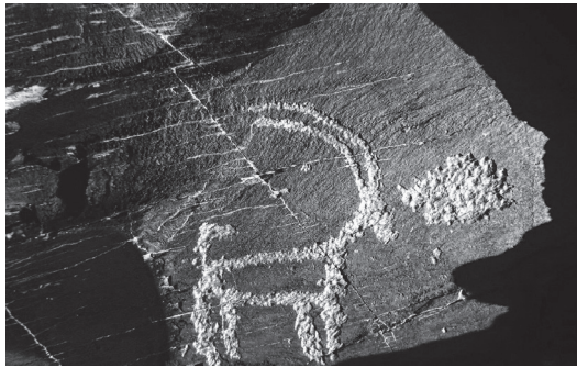
تصویر ۱- سنگ‌نگاره بز کوهی ساده‌شده یافت شده در کوه‌های خراوند، متعلق به دوره پارینه‌سنگی.