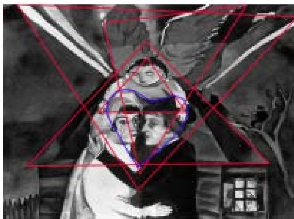
شکل ۴ و ۵: شکل‌های هندسی و غیرهندسی که با وصل کردن نقاط اصلی اثر ایجاد شده‌اند.