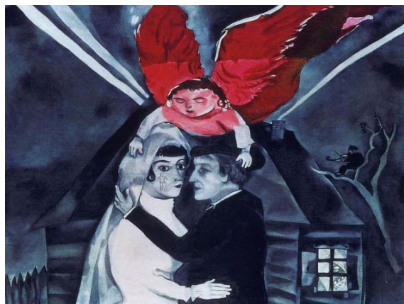
شکل ۲: 1918 Marc Chagall, Wedding, Oil on canvas, 119*100 cm, The Tretyakov Gallery, Moscow, Russia