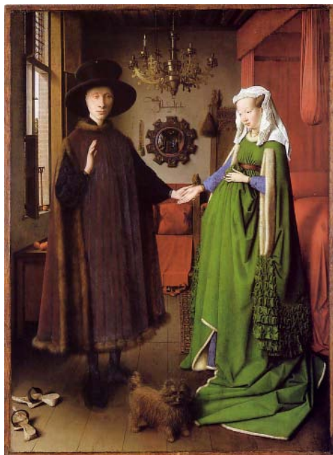
شکل ۱: Van Eyck, The Arnolfini Marriage, 1434, Oil on panel, 59.5*82 cm, Current location English: National Gallery

بر روی آستری مات و یک‌رنگ تکمیل می‌کردند. به این ترتیب، روی تخته مسطح با زمینه سفید طراحی دقیقی پدید می‌آمد. ماده چسباننده رنگ، دانه‌های روغنی بود که به سرعت خشک می‌شد. به ظاهر، رمز اسلوب جدید افزودن ماده‌ای ناشناخته بر ترکیب معمولی لعاب‌ها بوده است. این وسیله درخشان و پرتوان دقیقاً همان ابزاری بود که نقاشان شمال اروپا برای اجرای نیت‌هایشان لازم داشتند. هدف اینان نمایاندن جزئیات تمرکز یافته آشکار و درخشان هزاران شیء، از بزرگ و متوسط تا اشیای تقریباً نامرئی بود. نقاشان شمال اروپا می‌کوشیدند شکل‌های ظاهری و سطوح درخشان و رنگی اشیائی را که در معرض نور قرار می‌گرفتند، نشان دهند.