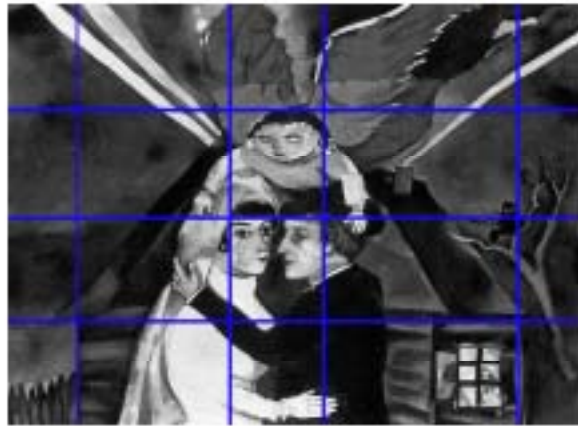
شکل ۶ و ۷: تقسیم‌بندی عمودی و افقی اثر که به‌خوبی عناصر اصلی کار در این تقسیم‌بندی‌ها قرار گرفته‌اند و استواری و استحکام ترکیب‌بندی را تا حدودی می‌توان دید.