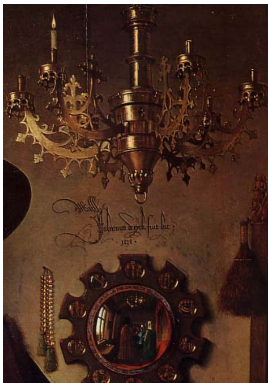
شکل ۳: تصویر شاهدان مراسم در آینه (جزئیات اثر یان وان ایک)

او شاعری ترانه‌ساز و هنرمندی پیشتاز در نقاشی است که قالبی انتزاعی و فهم‌نشدنی دارد؛ اما تمام آثارش دربردارنده حسی تأثیرگذار است. او طراح بزرگ و نقاش دیوارها و سقف‌های معبد‌های فرهنگ غربی و نیز تماشاخانه‌ها بود. همچنین، به هنر کاشی‌کاری و شیشه‌کاری‌های رنگ‌شده زندگی نوینی بخشید. مواد متنوع از علت‌هایی بود که باعث جذب او به این هنرها شد ۱۷ (همان، صص ۱۹۹ و ۱۷۸).