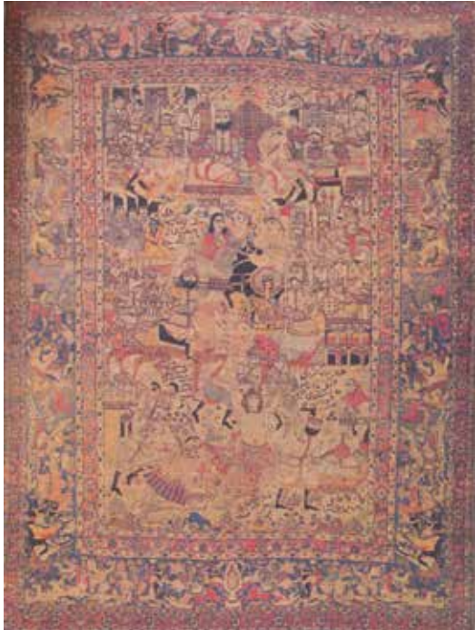
تصویر ۷- قالی تصویری، نقش خورشید خانم بر فراز تخت سلطنت، کاشان، دوره قاجار، ۲۶۰×۳۵۰