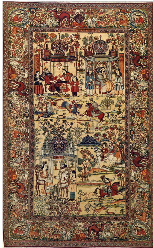
تصویر ۳- بهرام گور در هفت گنبد، (بهارستان، ۱۳۸۴: ۱۷۷) محل و تاریخ بافت: کرمان. ۱۲۹۵ هـ ش محل نگهداری: مجموعه خصوصی

شرح داستان: (تصویر ۳) این داستان مربوط به ازدواج بهرام با دختران هفت اقلیم و ساختن هفت گنبد است، می‌دانیم که بهرام گور از هفت دختر، از هفت کشور، در هفت گنبد هفت‌رنگ، در هفت روز هفته داستان‌ها می‌شنید. لباس