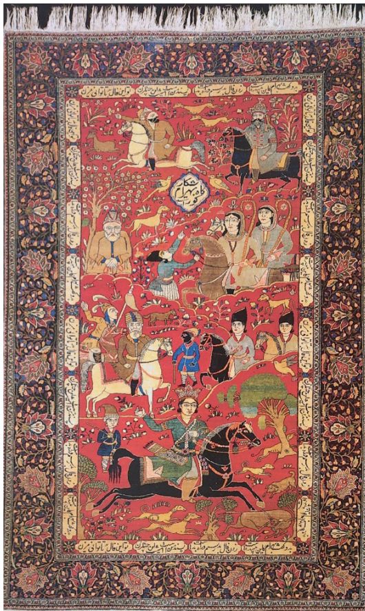
تصویر ۴- بهرام گور و گوهرفروش، (sakhai، ۲۰۰۸: ۱۰۴) محل بافت و تاریخ: کاشان. قرن ۱۹ میلادی محل نگهداری: مجموعه خصوصی

شرح داستان: (تصویر ۴) این داستان مربوط به ملاقات بهرام با گوهرفروش و دخترش است. بهرام در بیشه‌ای به شکار شیر مشغول بود. در این میان به بیشه‌ای رسید که گوسفندان بسیاری مشغول چرا بودند. شاه از شبان علت حضور در این بیشه را که مناسب چرا نمی‌دانست پرسید. شبان به وی پاسخ داد که وی تنها شبان این گوسفندان است و گله از آن گوهرفروش است که خروارها زر و سیم و مال دارد و تنها دختری زیباروی دارد که جز از دست او جام باده نگیرد و از عدالت بهرام شاه است که او بدین ثروت و مال رسیده است. بهرام چون این شنید از لشکریان جدا شده و راه خانه گوهرفروش را در پیش گرفت. روزبه موبد به لشکریان گفت اکنون شاه به در خانه گوهرفروش رفته و مهمان او خواهد شد و از دختر او خواستگاری خواهد کرد. شاه در حرم‌سرا اینک بیش از صد زن دارد. این برای پادشاه کشور شایسته نیست او را به تباهی خواهد کشاند. بهرام به‌سوی خانه گوهرفروش رهسپار شده و خود را گشسب‌سوار معرفی می‌کند و با گوهرفروش به باده‌گساری می‌پردازد و هنگام مستی دختر وی را که در چنگ‌نوازی و زیبایی سرآمد است خواستگاری می‌کند. گوهرفروش به بهرام می‌گوید که نیک در دختر و روی و موی و کردار و رفتار او دقت کن و نیز در مستی پیوند باکسی مبند. بهرام می‌گوید «این دختر پسند من است، فال بد در این کار مز» (دبیر سیاقی، ۱۳۸۴: ۳۱۳-۳۱۱).