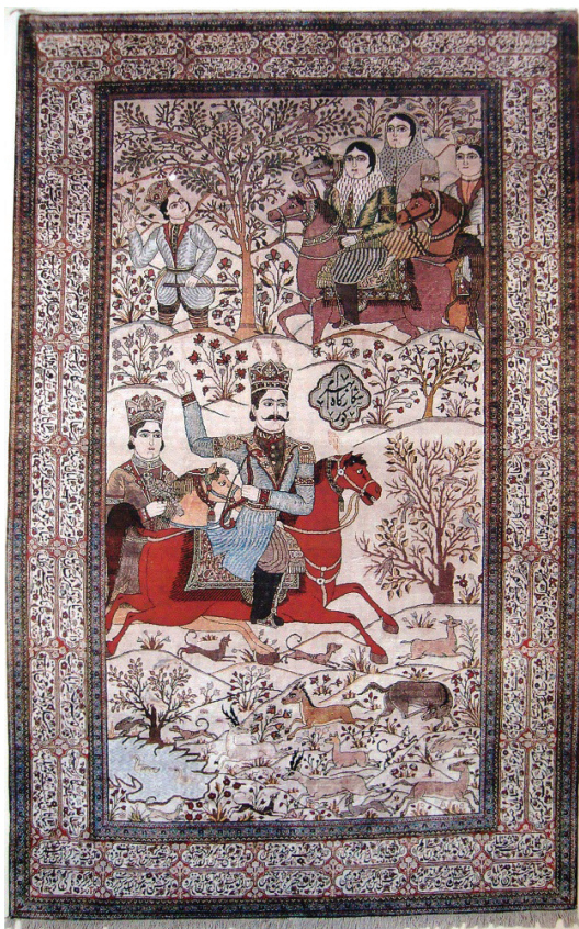
تصویر ۵- شکارگاه بهرام گور، (دادگر، ۱۳۸۰: ۴۷) محل و تاریخ بافت: کاشان، قرن ۱۹ میلادی محل نگهداری: موزه فرش ایران

است؛ چنانچه، بافت این فرش نیز مربوط به دوران حکومت احمدشاه است. کنیزک به‌عنوان دومین عنصر اصلی و بارز تصویر، سوار بر اسبی به رنگ پیازی بوده