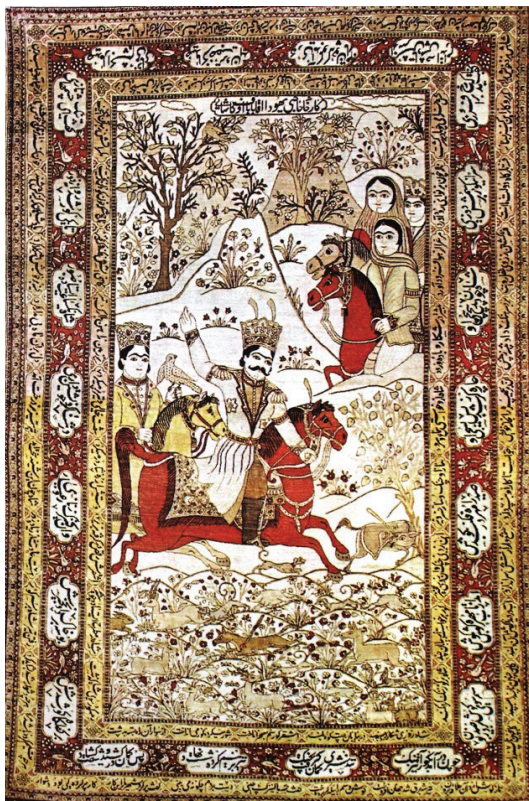
تصویر ۶- شکارگاه بهرام گور، (یساولی، ۱۳۷۴: بخش تصاویر) محل و تاریخ بافت: کاشان، قرن ۱۹ میلادی محل نگهداری: مجموعه خصوصی

نسبت به رنگ زمینه از کنتراست پایینی برخوردار است. بهرام دارای تاجی است که شباهت بسیاری با تاج کیانی دوره قاجار دارد. در پشت سر وی شخص دیگری