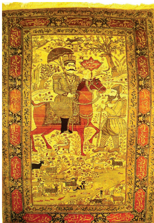
تصویر ۲- بهرام و شبان - (Milanesi, 1999:97) محل و تاریخ بافت: کاشان، سده ۱۹ میلادی محل نگهداری: مجموعه خصوصی

نمونه دوم فرش حکایت بهرام گور و شبان: شرح داستان: (تصویر ۲) این نمونه هم اشاره به داستان بهرام گور و شبان دارد. بهرام گور بعد از آگاهی یافتن از خیانت وزیر سر به کوه و صحرا گذاشته است تا به چاره‌اندیشی بپردازد. در این میان با شبانی مواجه می‌شود که سگی را به درخت بسته است؛ بهرام جوپای این کار وی می‌شود و پی می‌برد که شبان به علت خیانت سگ به گله، او را مجازات کرده است. شرح تصویر: این صحنه همانند مورد قبل لحظه پند گیری بهرام از شبان و سگ به دار آویخته را نشان می‌دهد. در متن فرش همه عناصر اعم از پیکره‌های انسانی و حیوانی و گیاهان از لحاظ رنگی تنالیده ای از رنگ زمینه هستند و در کل متن فرش به صورت متعادل پخش شده‌اند. تنها عنصری که از لحاظ رنگی در زمینه فرش جلب توجه می‌کند رنگ قرمز اسب بهرام گور است و کتیبه‌ای به همین رنگ در بالای سر اسب که اشاره به حکایت بهرام گور و شبان می‌کند. از همین رنگ در رنگ قاب‌های حاشیه پهن نیز استفاده شده است.