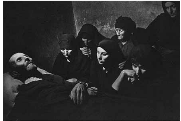
تصویر (۱۲): یوجین اسمیت، مرگ در دهکده اسپانیایی، ۱۹۵۱