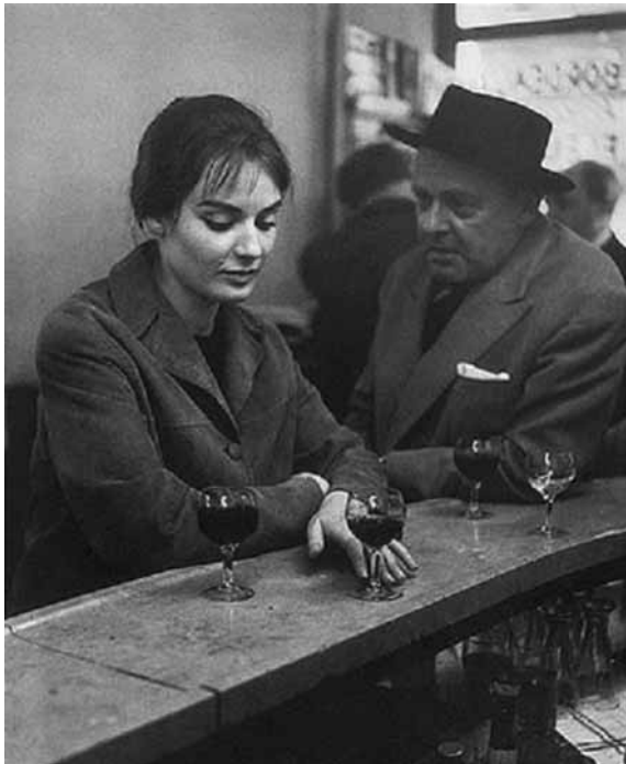
تصویر (۱۱): رابرت دوانو، کافه در پاریس، ۱۹۵۸