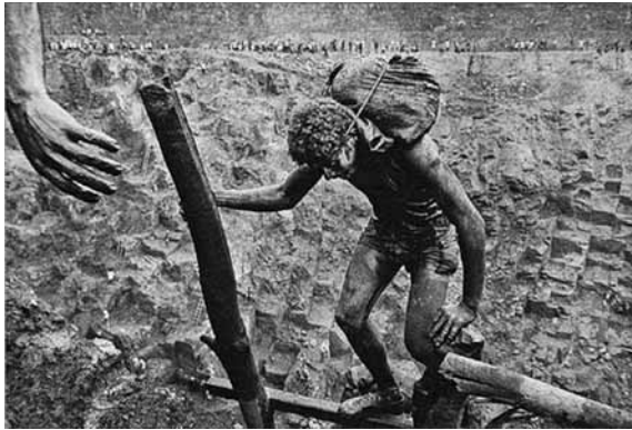
تصویر (۱۳): سباستیائو سالگادو، معدن طلای برزیل، ۱۹۸۶