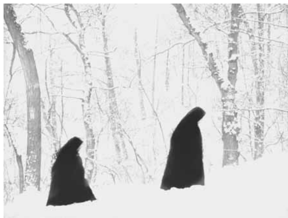
تصویر (۳): رابرت هاووز، راه های پایین، ۱۹۵۴