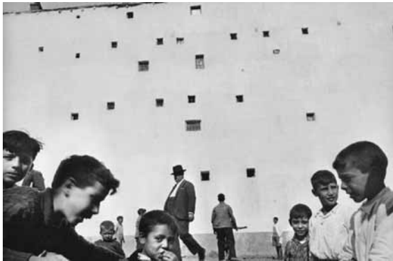
تصویر (۴): هانری کارتیه برسون، مادرید، ۱۹۳۳