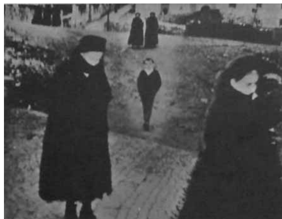
تصویر (۱۶): ماریو جاکوملی، ۱۹۶۳

بر اساس کنش قاب- لحظه، گونه های دیگر دسته بندی عکس ها نیز امکان پذیر است. به طور مثال از قاب- لحظه- های نثر گونه، قاب- لحظه های نظم گونه، قاب- لحظه های شعر گونه می توان سخن گفت که در ادامه در بخش انواع متن ها به آن خواهیم پرداخت تا هم شاخصی برای دسته بندی انواع عکس ها به دست آید و هم به نوعی امکان ارزیابی زیبایی شناسانه آنها فراهم گردد. چراکه از نظر زیبایی شناسی هر متنی که عکس نیز جزء آنهاست واجد مولفه ها و خصوصیتی است که از درجه اعتبار هنری، بصری و مفهومی آن خبر می دهد.