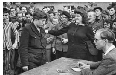
تصویر (۲): هانری کارتیه برسون، محاکمه جاسوس، آلمان، ۱۹۴۵