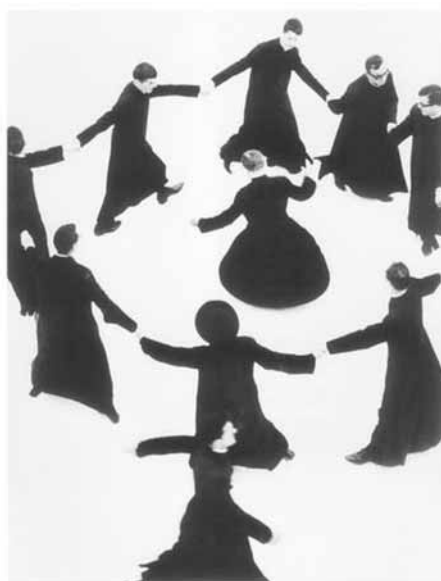
تصویر (۱۴): ماریو جاکوملی، رقص