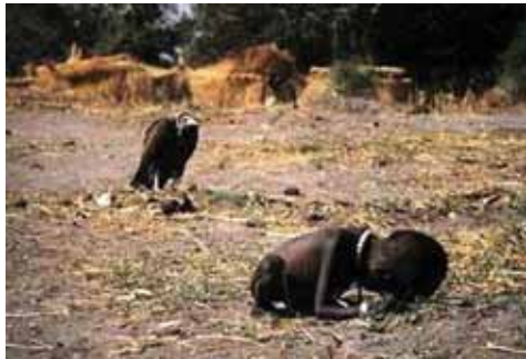
تصویر (۷): نیک یوت، ویتنام، ۱۹۷۲