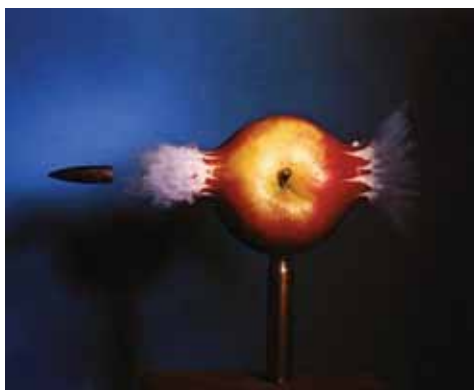
تصویر (۸): هارولد آجرتون، شلیک به سیب، ۱۹۶۴