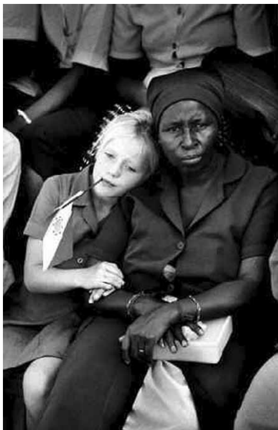
تصویر (۱۰): آمریکا، ۱۹۷۶

ایجاد کننده متن های گوناگون در لحظات متفاوت (برقرار می سازد، بهره برده و دنیا و مکاشفات درونی خود را با عکس به نمایش می گذارد. عکاس با ابزاری مکانیکی (دوربین) تکه ای از عالم واقع را در قاب جای داده و پس از سامان بخشی به عوامل و عناصر آن بر اساس دیدگاه و هدف خود در لحظه دلخواه با فشردن دکمه شاتر به واقعیتی تازه به نام عکس امکان ظهور می دهد (تصاویر ۴ و ۱۴ و ۱۵). در این میان، بنا به ضرورت می تواند از امکانات تکنیکی دوربین مانند استفاده از انواع لنزها برای اغراق در تصویر، انواع فیلم ها با کنتراست کم و زیاد، محو کردن و جلوه های بصری دیگر استفاده نماید. حتی اگر عکاس از جلوه ای بصری برای تولید عکس سود نبرده باشد، عکس جهانی همسان و همانند جهان واقع نمی آفریند؛ بلکه همان طور که سوزان لانگر بیان می کند: "تصویر خود ضرورتاً یک نماد است و نباید آن را روگرفتی از اصل دانست، زیرا تصویر از پاره ای جهات با موضوع خود مشابهت دارد ولی عین آن نیست" (ضمیران، ۱۳۸۲: ۵۱). عکسی که سالگادو از معدن طلا در برزیل شکار کرده است اگر چه از موضوعی واقعی حکایت می کند اما آنچه عکس را به اثری هنری تبدیل ساخته، واقعیت و عناصر قابل شناسایی در آن نیست. واقعیت و عناصر آن با توجه به کنش هنرمندانه عکاس، در جهان عکس استحاله می یابند و تاویل های متعدد را می آفرینند (تصویر ۱۳). واقعیت رخ داده در جهان واقع تنها امکان اکتشاف بصری و مفهومی را برای عکاس فراهم ساخته است و عکاس به هدف ارائه نسخه ای دیگر از آن دست به