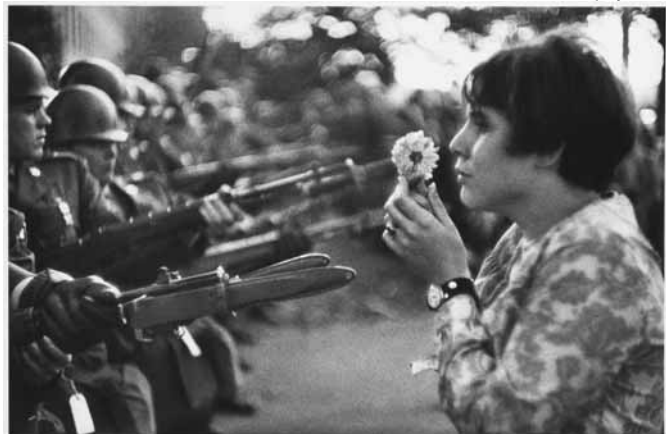
تصویر (۹): مارک ریبود، پنتاگون، ۱۹۶۷

ایجاد کننده متن های گوناگون در لحظات متفاوت (برقرار می سازد، بهره برده و دنیا و مکاشفات درونی خود را با عکس به نمایش می گذارد. عکاس با ابزاری مکانیکی (دوربین) تکه ای از عالم واقع را در قاب جای داده و پس از سامان بخشی به عوامل و عناصر آن بر اساس دیدگاه و هدف خود در لحظه دلخواه با فشردن دکمه شاتر به واقعیتی تازه به نام عکس امکان ظهور می دهد (تصاویر ۴ و ۱۴ و ۱۵). در این میان، بنا به ضرورت می تواند از امکانات تکنیکی دوربین مانند استفاده از انواع لنزها برای اغراق در تصویر، انواع فیلم ها با کنتراست کم و زیاد، محو کردن و جلوه های بصری دیگر استفاده نماید. حتی اگر عکاس از جلوه ای بصری برای تولید عکس سود نبرده باشد، عکس جهانی همسان و همانند جهان واقع نمی آفریند؛ بلکه همان طور که سوزان لانگر بیان می کند: "تصویر خود ضرورتاً یک نماد است و نباید آن را روگرفتی از اصل دانست، زیرا تصویر از پاره ای جهات با موضوع خود مشابهت دارد ولی عین آن نیست" (ضمیران، ۱۳۸۲: ۵۱). عکسی که سالگادو از معدن طلا در برزیل شکار کرده است اگر چه از موضوعی واقعی حکایت می کند اما آنچه عکس را به اثری هنری تبدیل ساخته، واقعیت و عناصر قابل شناسایی در آن نیست. واقعیت و عناصر آن با توجه به کنش هنرمندانه عکاس، در جهان عکس استحاله می یابند و تاویل های متعدد را می آفرینند (تصویر ۱۳). واقعیت رخ داده در جهان واقع تنها امکان اکتشاف بصری و مفهومی را برای عکاس فراهم ساخته است و عکاس به هدف ارائه نسخه ای دیگر از آن دست به