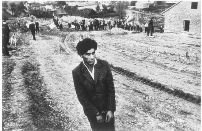
تصویر (۵): ژوزف کودلکا، بدون عنوان، بدون تاریخ