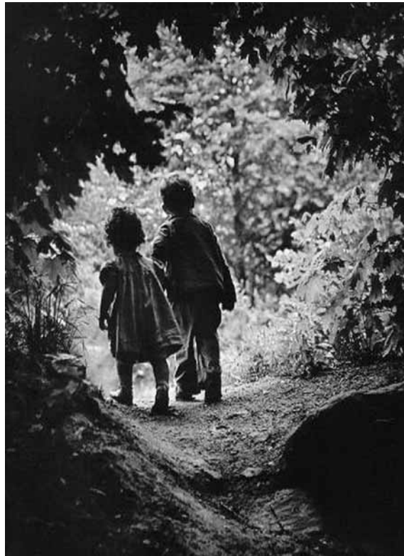
تصویر (۱): یوجین اسمیت، دروازه بهشت، ۱۹۵۵