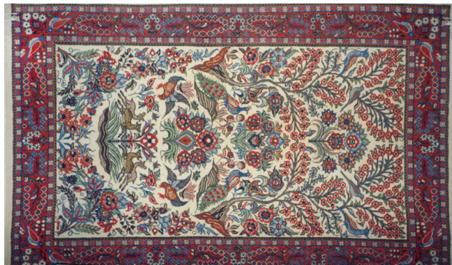
تصویر (۱): قالی محلات