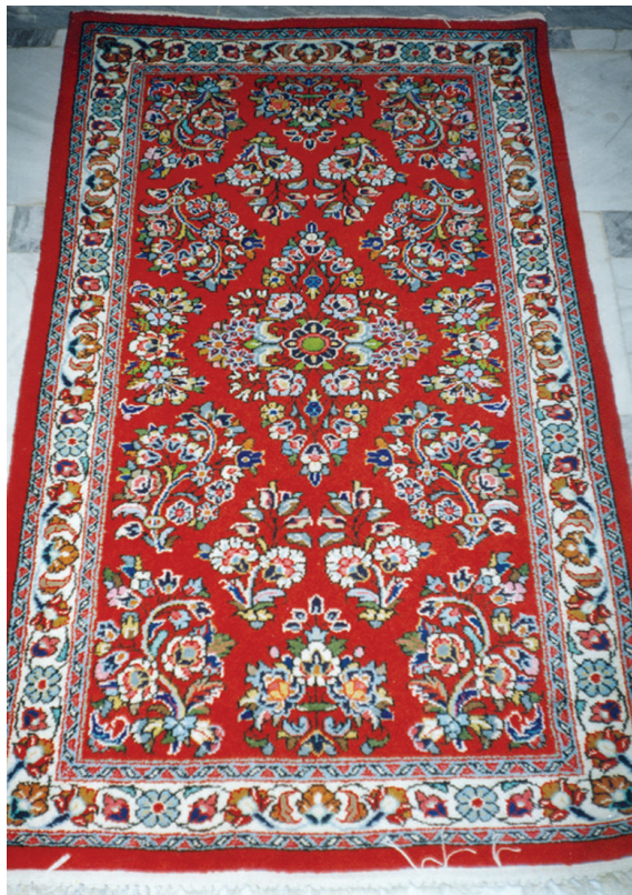
تصویر (۲): قالی محلات