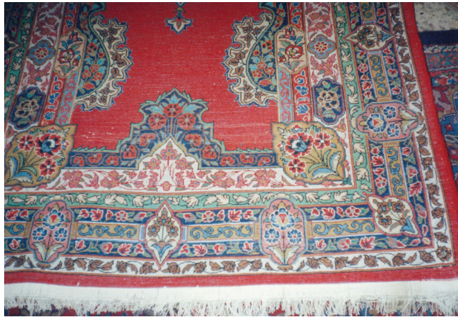
تصویر (۵): سفیدک زدن پشت قالی