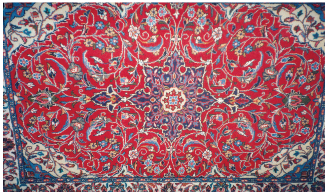
تصویر (۶): ترنج دار شدن قالی

مهم ترین علل ایجاد بالازدگی قالی محلات عبارت است از عدم تناسب مواد اولیه یعنی ضخامت زیاد هر یک از مواد اولیه، نخ پود، چله یا پرز یا توامان با رج شمار قالی که در ۴۶/۵٪ از موارد مشاهده شده است، (جدول شماره ۵). از دیگر عوامل بروز این عیب می توان شل بودن تارهای قالی در ۱۳/۹٪ از موارد و نایکنواختی ضربات شانه در ۱۱/۶٪ از موارد را نام برد. عدم نظم در فاصله تارها نیز ۷٪ موارد را شامل می شود.