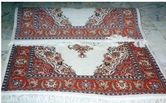
تصویر (۳): کجی در گلیم بافی ابتدای قالی

به دنبال علت یابی عیوب و با در نظر گرفتن عوامل موثر بر ایجاد کجی در قالی در ۵۱ مورد یعنی ۴۲/۱٪ از موارد مشاهده شده مهم ترین علت ایجاد کجی در قالی، کشیدن بیش از حد پود ضخیم است. در ۸/۳٪ از موارد توزیع نامناسب تارها در عرض قالی، در ۲/۵٪ معیوب بودن دار قالی و در سایر موارد عدم استفاده از پهنان یا سایر ابزار مشابه آن و تاب زیاد پود ضخیم باعث ایجاد این عیب شده است.