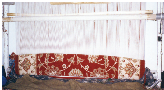
تصویر (۴): پایین زدگی دو طرف قالی

علل ایجاد عیب پایین زدگی قالی محلات، در ۴۷/۶٪ موارد عدم تناسب مواد اولیه با رج شمار قالی است. نامناسب بودن ضخامت مواد اولیه، نخ بود و پرز و چله، یعنی نازک بودن هر یک از آنها و یا مجموعه آنها باعث بروز عیب پایین زدگی می شود. سفت بودن بیش از حد چله یا عدم نظم آن عامل بروز این عیب در ۱۴/۳٪ و نایکنواختی ضربات شانه ۱۴/۳٪ از موارد مشاهده شده را شامل می شود.