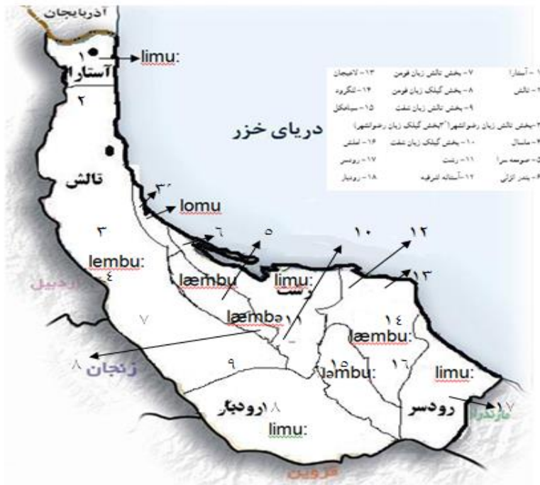
شکل ۱: نقشه واژه لیمو در اطلس گویش گیلکی

ابتدا نقشه استان گیلان را از اینترنت دانلود کرده و ۱۸ ناحیه را در آن شماره گذاری کردیم. برای هر واژه، یک نقشه مستقل، در نظر گرفته شده و اطلاعات مربوط به تنوعات و فرایندهای آوایی، زیر هر نقشه ذکر شده است. در زیر، نقشه مربوط به اسم «لیمو» درج شده است.