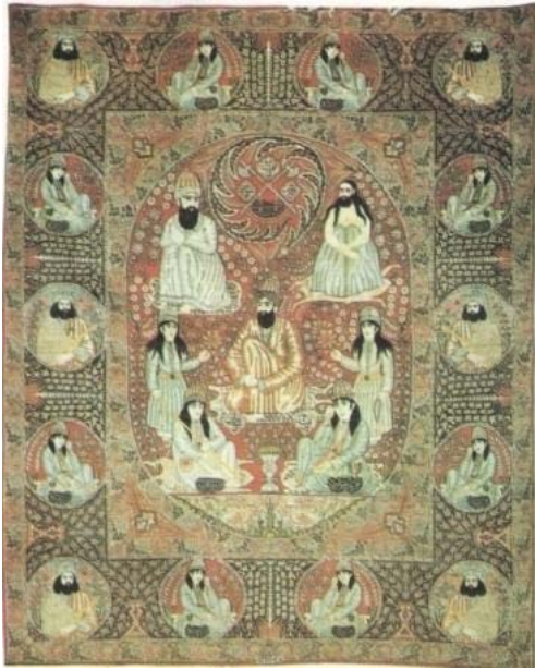
تصویر ۱: قالی تصویری کرمان با نقش دراویش در متن و حاشیه. ابعاد ۳/۴۸×۲/۷۶