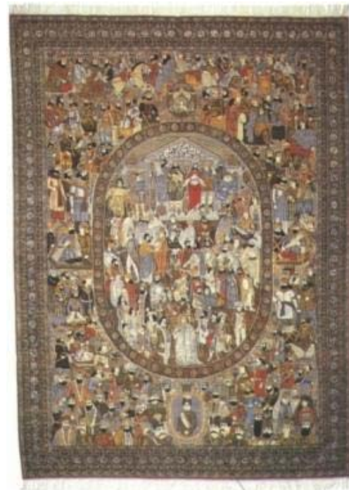
تصویر ۶: