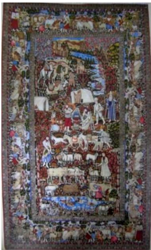
تصویر ۷: