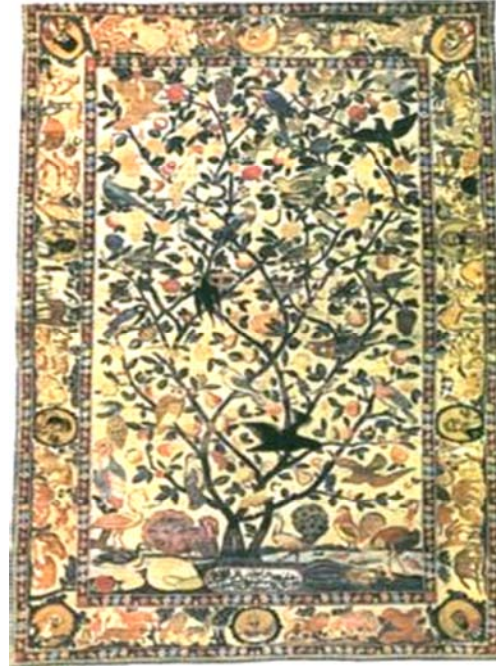
تصویر ۹: قالی ملیت