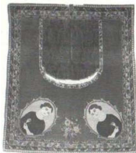
تصویر ۱۱: روزینی با نقش زن.

تصویر ۱۲، نیم تنه زن (تصویر ۱۲): کرمان اوایل قرن ۱۴ ه. ق. اندازه: ۷۳×۵۸ cm