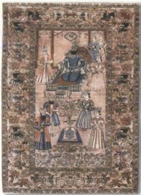
تصویر ۱:

تصویر ۱، تاج‌گذاری نادر در دشت مغان را نشان می‌دهد. محل نگهداری آن موزه فرش ایران است. استفاده از سایه روشن با کاربرد دو رنگ در فیگورهای قالی‌های تصویری کرمان، ویژگی قالی‌های این منطقه است.