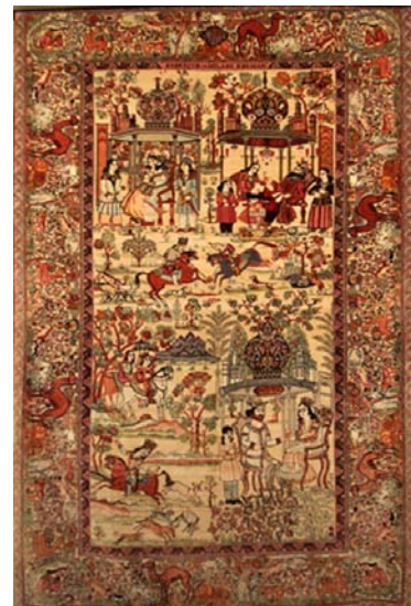
تصویر ۱۴: بهرام گور در هفت گنبد