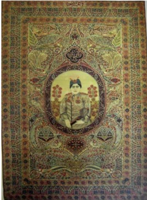
تصویر ۲: احمد شاه، مأخذ تصویر: ملول، ۱۳۸۴، ص ۱۷۹

این تابلوی تاریخی را که نمایی از صحنه تاج بخشی به اردشیر و شاپور بابکان است، در ۱۳۰ سال قبل در اندازه ۲/۰۵ \times ۲/۵۶ متر با ۴۰۳۰۰۰ گره در متر مربع پدید آورده است. این اثر بدیع هم اکنون زینت بخش موزه فرش ایران است. ۳۶ کتیبه دورتادور قالی، شامل هجده بیت از اشعار حکیم نظامی گنجوی است (نصیری، ۱۳۷۴: ۱۸۳).