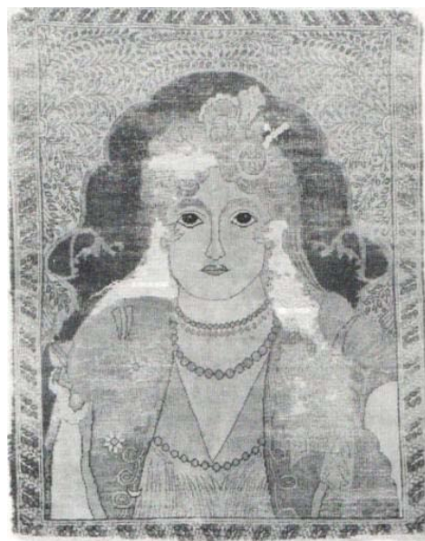
تصویر ۱۲:

رنگ‌ها: دارای ۷ رنگ سورمه‌ای، زیتونی روشن، زرشکی، صورتی، قهوه‌ای سوخته، قهوه‌ای، عاجی است. با اینکه روزگار، صدمات زیادی به این قالیچه (تصویر ۱۲) وارد آورده و قسمت‌هایی از تار و پود آن را بیرون ریخته است، هنوز از جاذبه‌های رازگونه بهره‌مند است. این قالیچه باید از اولین قالیچه‌هایی باشد، که از روی تصویر این زن