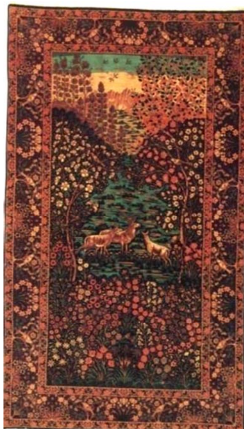
تصویر ۸: قالی تصویری راور، طرح منظره یا دورنما

قالی تصویری، محل بافت: راور کرمان، ابعاد: ۱۵۱×۲۶۳ سانتی‌متر، ۱۹۲۰ میلادی، گره: نامتقارن. طرح این قالی (تصویر ۸) که به صورت سرتاسری، ترسیم و اجرا شده است، چشم‌اندازی زیبا از یک باغ را نمایش می‌دهد. انواع درختان، گل‌ها و بوته‌های طبیعی، آذین‌بخش سرتاسر تصویر است. جای‌گیری صحیح سه آهو و گوزن در مرکز کار، جایی که معمولاً ترنج قرار می‌گیرد و احاطه آن با شاخه و برگ درختان، موجب شده که بیننده، زودتر به مضمون اصلی طرح توجه داشته باشد. همچنین آناتومی و ترکیب‌بندی صحیح حیوانات، نشان از آن دارد که طراح کرمانی تنها در طراحی گل‌ها و درختان چیره‌دست و مهارت نیست.