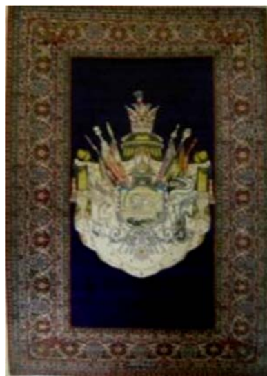
تصویر ۱۵: