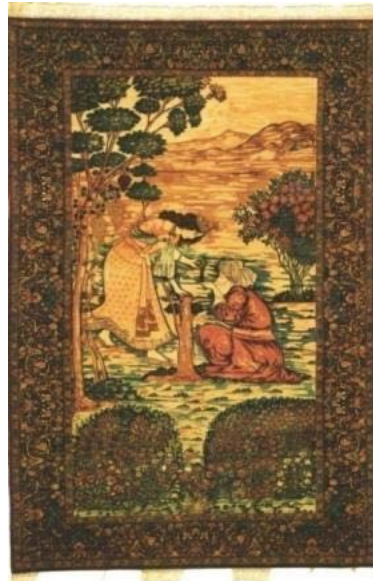
تصویر ۱۳: نقش مینیاتور

در مقاله حاضر، انواع طرح‌های به‌کار رفته در